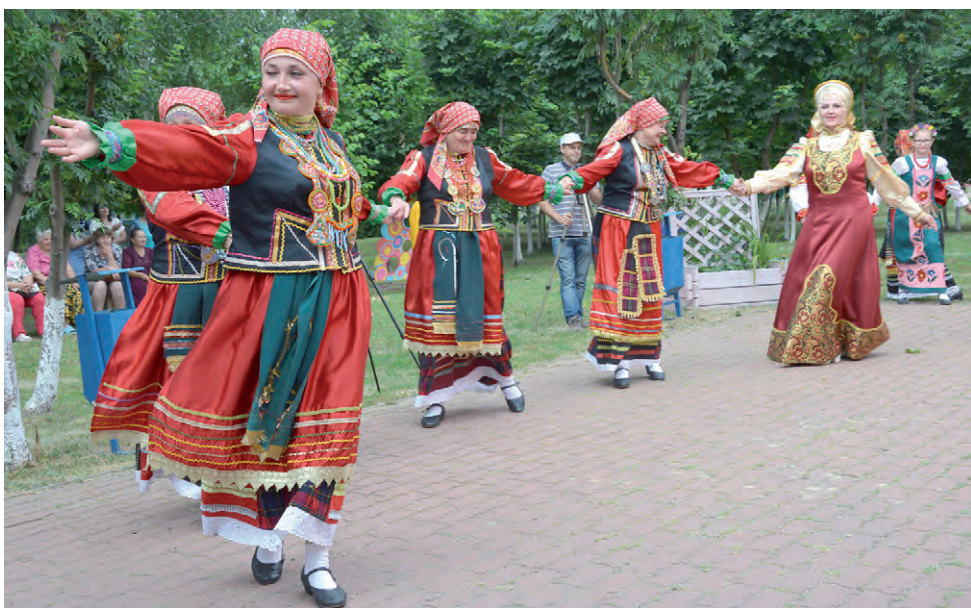
...и водили дружно хоровод.