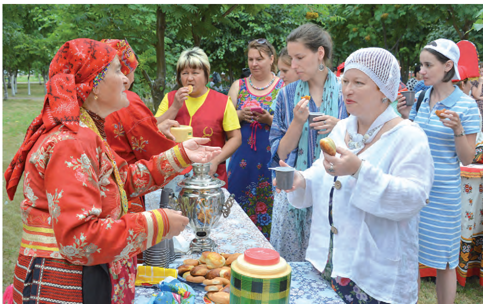
Душистым чаем и сладостями угощали всех желающих...