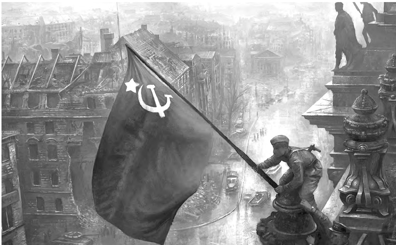
Знамя Победы водружено над поверженным Рейхстагом.