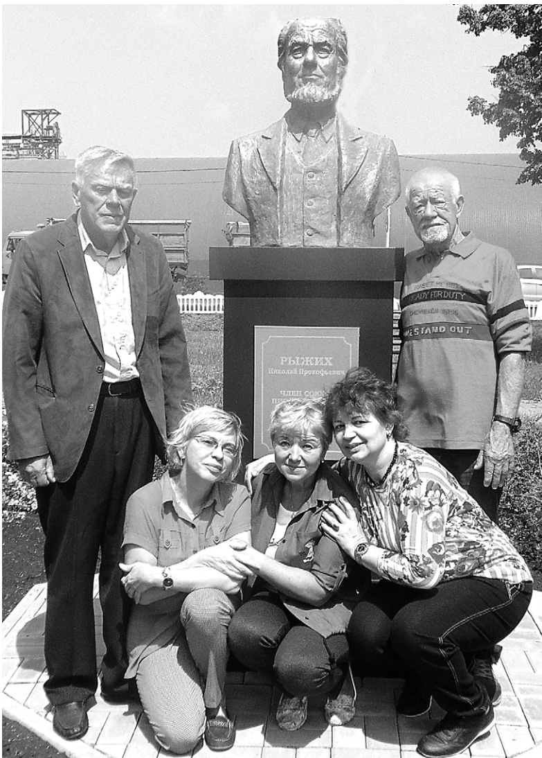
Родственники писателя возле его бюста в селе Хлевище.