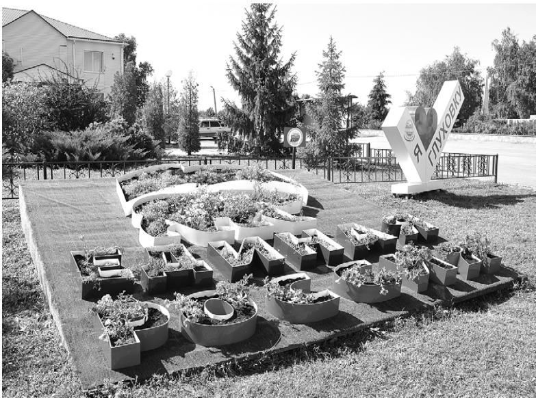
Клумба в Глуховке — один из фаворитов конкурса.