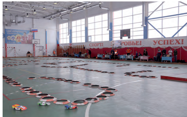
Тот самый слалом, организованный в зале «Юности».