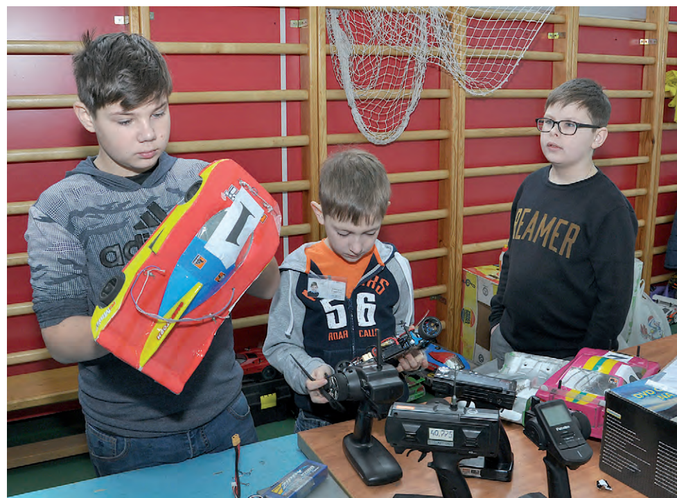
Юные алексеевцы готовят свои модели к заездам.