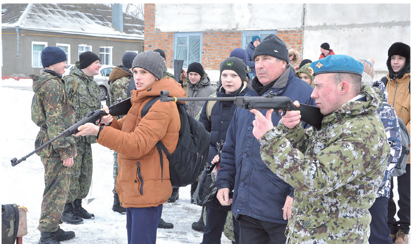
Любой желающий мог проверить свою меткость.