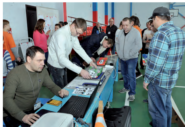
За столиком арбитров всё серьёзно — идёт взвешивание моделей, принявших участие в гонке.

В соревнованиях были представлены четыре класса моделей: РМ-1, РЦЕ-12, ТС-10 S и GT-10. Первый — реальные копии существующих автомобилей с мотором, работающим на растя-