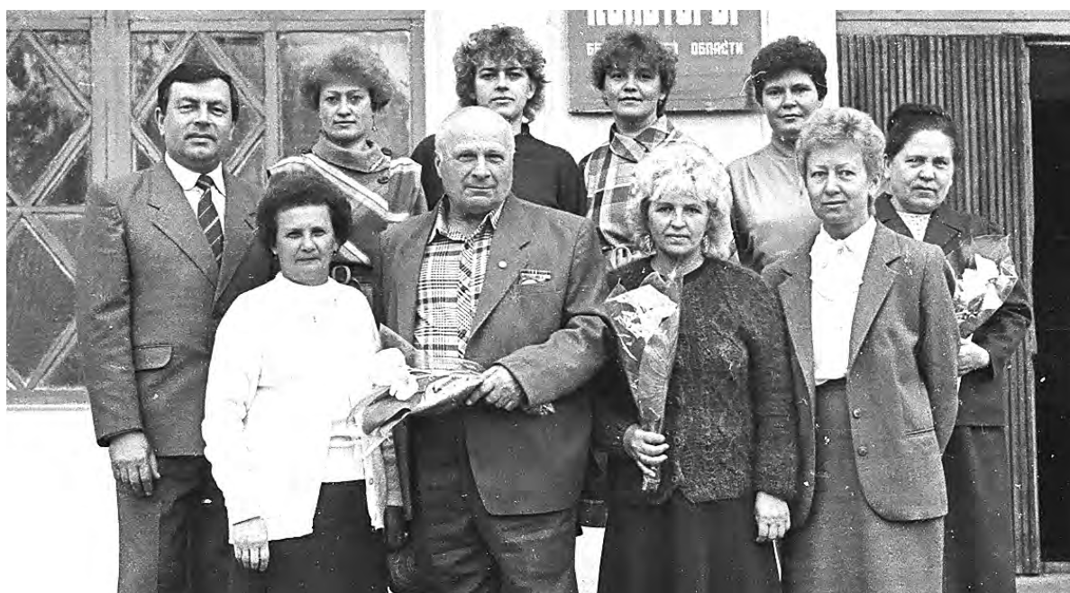
Работники Алексеевской типографии (1990-й год).