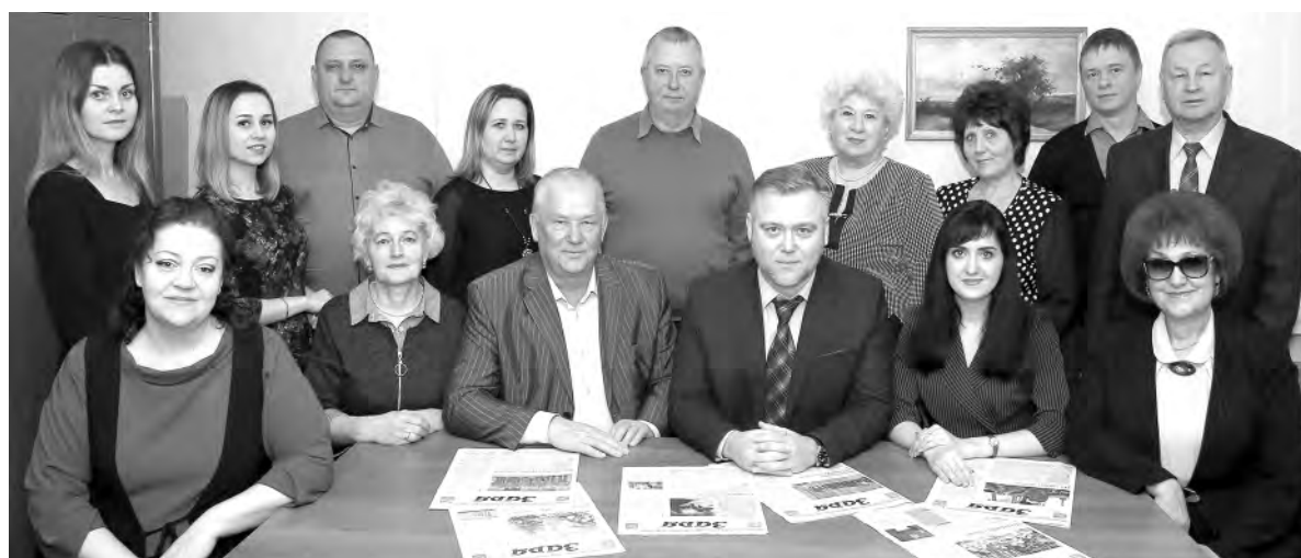
Коллектив «Зари» в год векового юбилея (2020-й год).