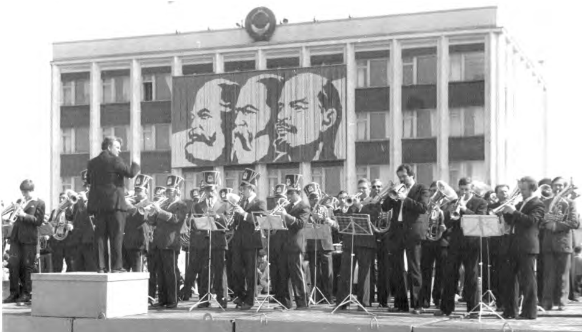
Выступление сводного духового оркестра в 80-е годы не оставляло равнодушным ни одного горожанина.