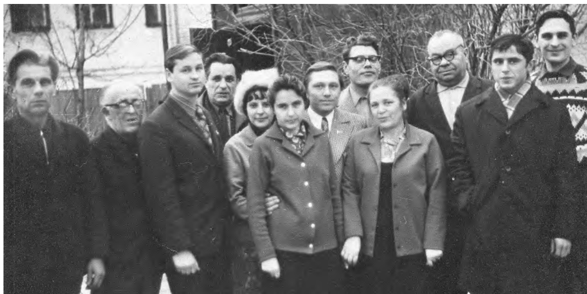
Дружный коллектив алексеевских газетчиков в 1973 году.