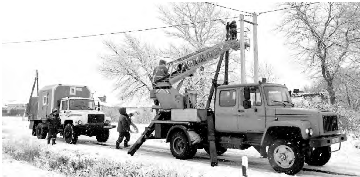
Бригада рэсовцев реконструирует электролинию в селе Новоуколово.