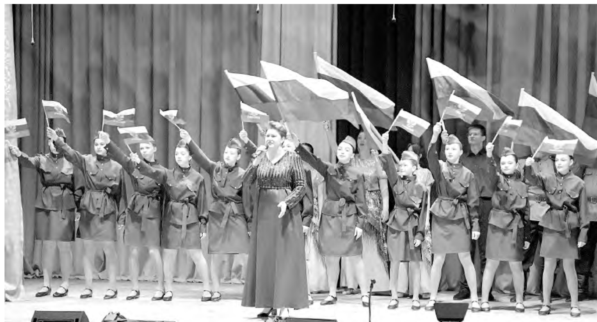
Концертная программа, наполненная патриотическим духом, тронула сердца всех присутствовавших.

Татьяна КРАСНОВА.