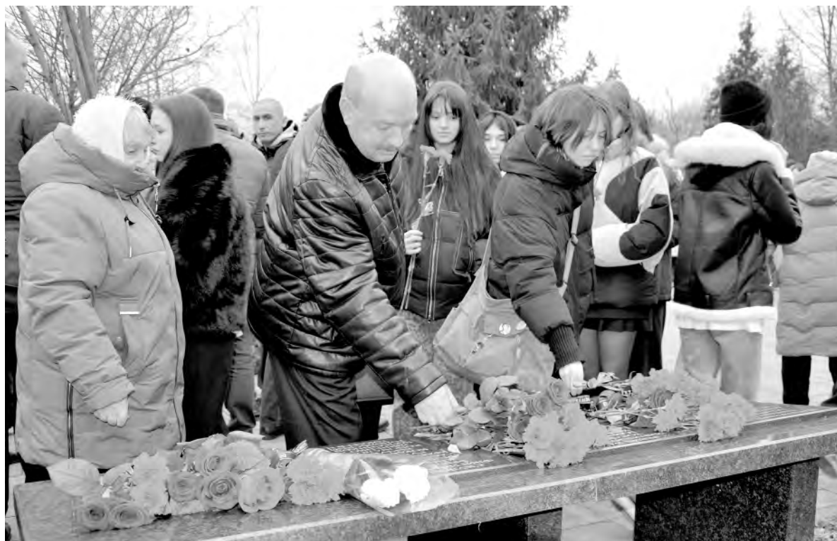
Подвиг павших героев почтили жители муниципалитета всех возрастов.

и Чечни, участники специальной военной операции.