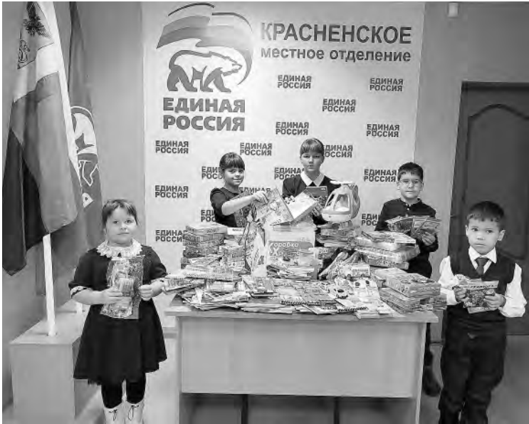
Ученики младших классов Красненской средней школы принесли свои подарки в «Коробку храбрости».