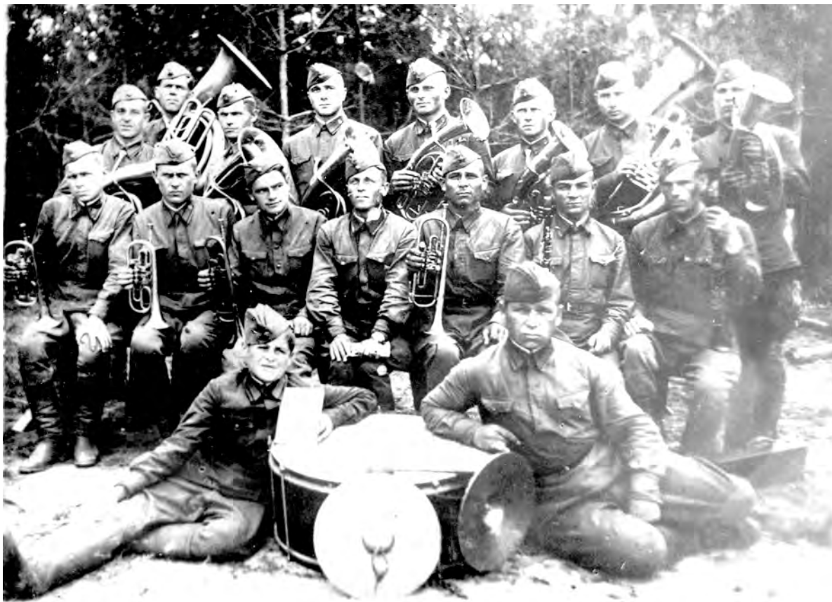
Духовой оркестр 744-го стрелкового полка в Алексеевке.

Затем последовал 200-километровый марш в составе дивизии. По пути перехода полк