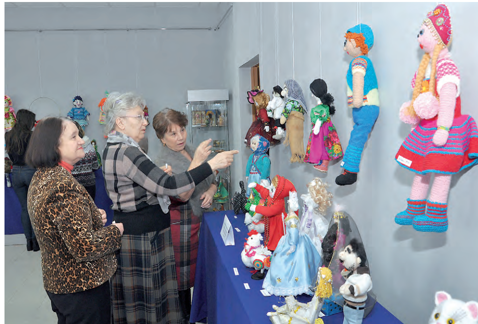
Посетители остаются довольны увиденным.