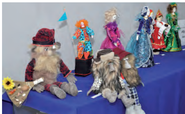
Куклы удивляют многообразием образов и стилей.

Текстильные куклы удивляют многообразием образов и стилей. Перед вами представлены персонажи, одетые в традиционный костюм Алексеевского района, куклы-барышни, сказочные персонажи. Каждая из них воплотила мастерство местных рукодельниц и передаёт частицу тепла мастера зрителям, настроение творчества и