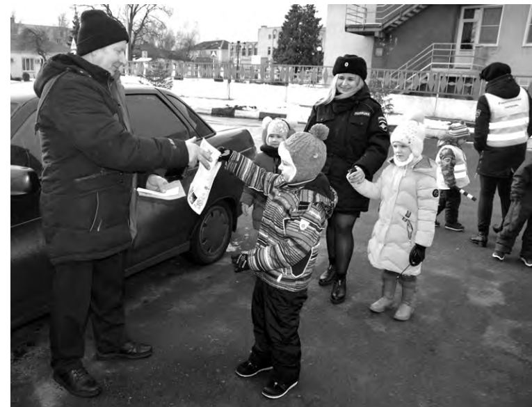
Воспитанники «Капельки» с детства знакомы с правилами дорожного движения.

Работа по предупреждению детского дорожно-транспортного травматизма и воспитанию законопослушных участников дорожного движения много лет ведётся в тесном сотрудничестве с инспекторами ГИБДД. В «Капельке» полицейские проводят обучающие занятия с дошкольниками и акции по безопасности. Дети рады повышенному вниманию, а родители — тому, что малыши получают знания, которые пригодятся им в жизни.