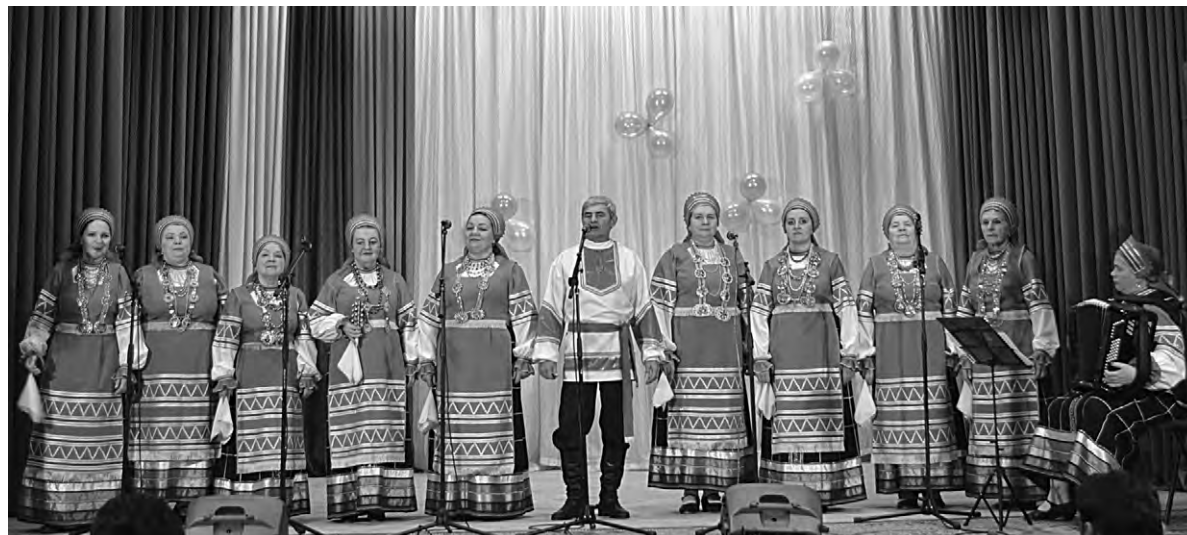
Местный народный коллектив «Сударушка» особенно рад ремонту учреждения.

Сегодня такая роспись — большая редкость, и сохранилась она в Красненском районе только в Большом. В центре культурного развития имеются литературно-музыкальный салон, тренажёрный и диско-залы, комнаты административно-хозяйственного персонала и художественно-методического