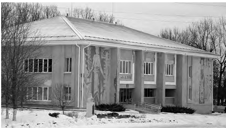
Новая кровля украсила Большовский центр культурного развития.