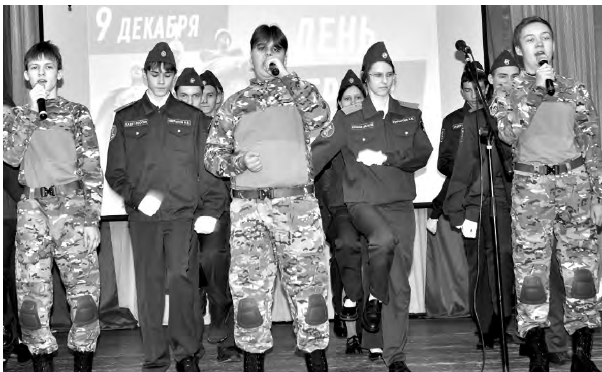
Алексеевские студенты и школьники — не только зрители подобных мероприятий, но и активные участники.

Те, кто видел войну воочию, знают, как непросто сегодня на передовой нашим парням. Потому они не могут просто наблюдать. Местная общественная организация инвалидов войны и военной травмы активно участву-