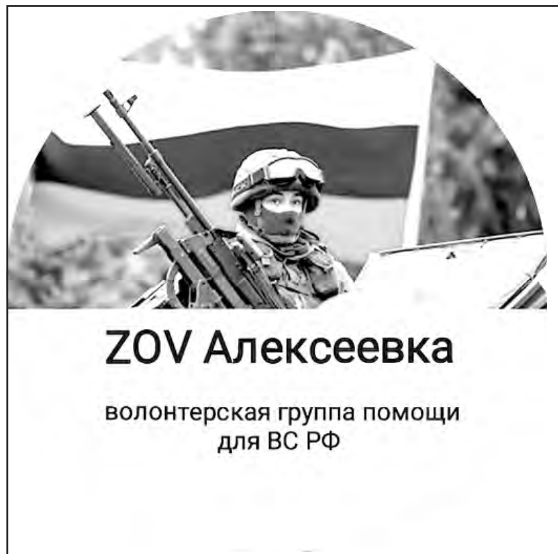
Эмблема алексеевской группы знакома многим бойцам.