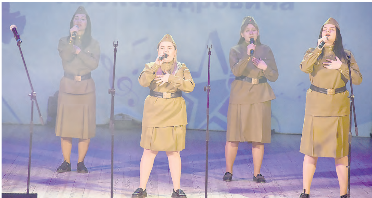
Душевно звучали песни в исполнении участниц студии эстрадной песни «Экспрессия» из Алексеевки.

Валерия ЮРЬЕВА.