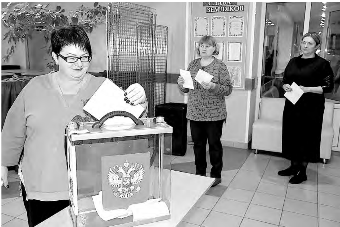
Процесс тайного голосования по обновлению состава местного политсовета.

Приёмы проходят в разных уголках нашей страны. Их проводят представители исполнительной власти и депутаты всех уровней.