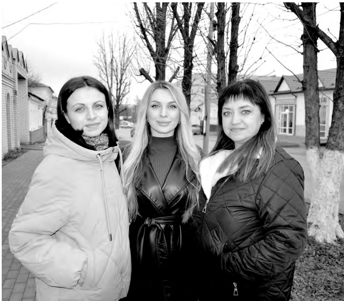
Три хрупкие девушки объединили сердца равнодушных людей для помощи фронту.

Как-то, прогуливаясь с подругой и её тётей, встретили совсем молоденьких военных и предложили их накормить, — охотно рассказывает моя собеседница. — Тогда мы смогли угостить 15 человек. Ребята сказали, что скоро приедут ещё 60. Поняли, что сами не потянем такое количество ртов. На своей рабочей странице в соцсетях кинула клич всем неравнодушным. У нас всё получилось. Дальше — больше. Вскоре обратилась знакомая с просьбой открыть сбор и помочь ребятам. Самыми первыми были танкисты с Макеевского направления. Потом уже сработало сарафанное радио, о нас стали узнавать.