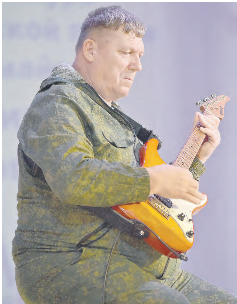
Момент выступления участника ансамбля «Ясный Колодец» из Корочанского района.

Заря Учредители: министерство общественных коммуникаций Белгородской области; администрация Алексеевского городского округа, администрация Красненского района Белгородской области, Совет депутатов Алексеевского городского округа Белгородской области, муниципальной совет муниципального района «Красненский район», АНО «Редакция газеты «Заря».