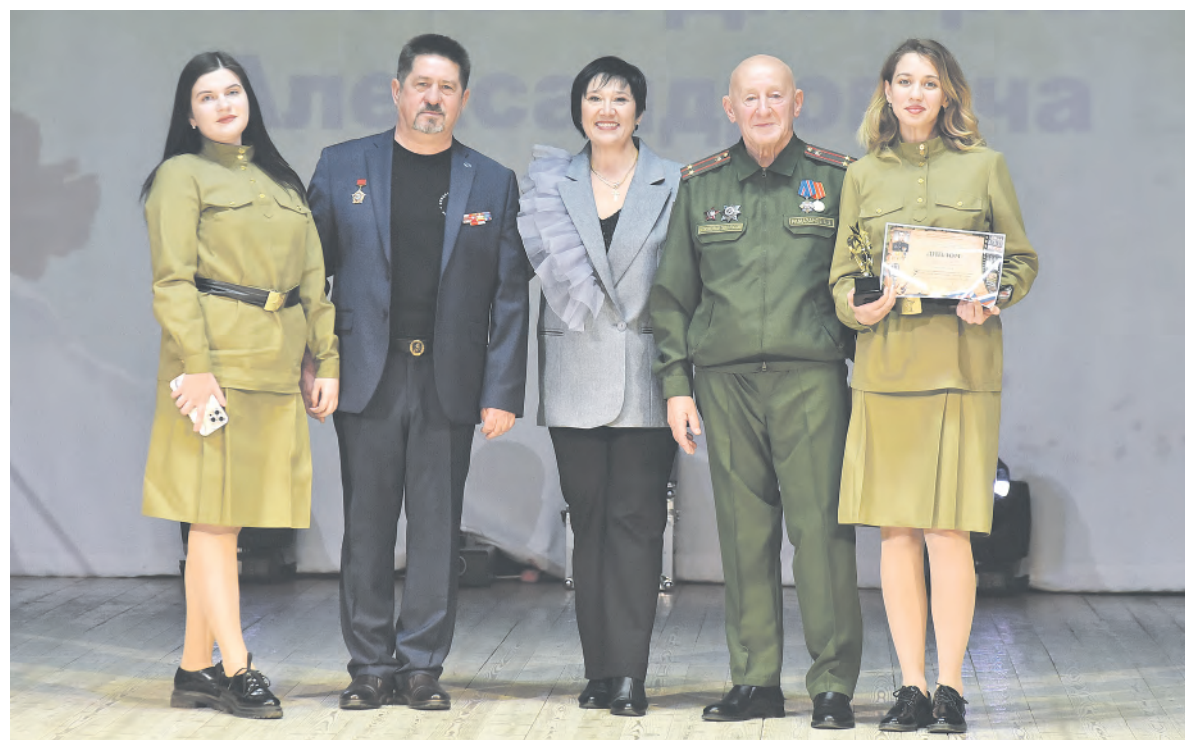
Члены жюри с дипломантами конкурса во время церемонии награждения.