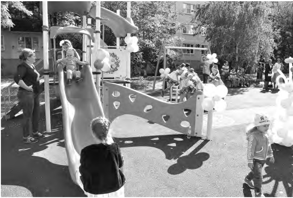
Для юных жителей микрорайона это неоценимый подарок.