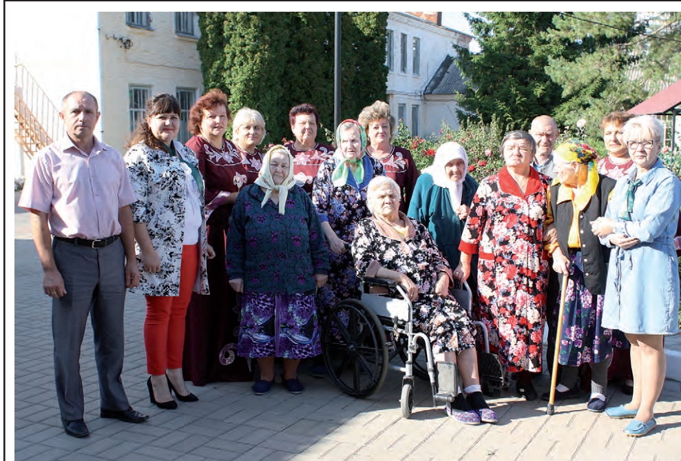
Жители дома-интерната для престарелых и инвалидов рады были сфотографироваться с гостями на память.