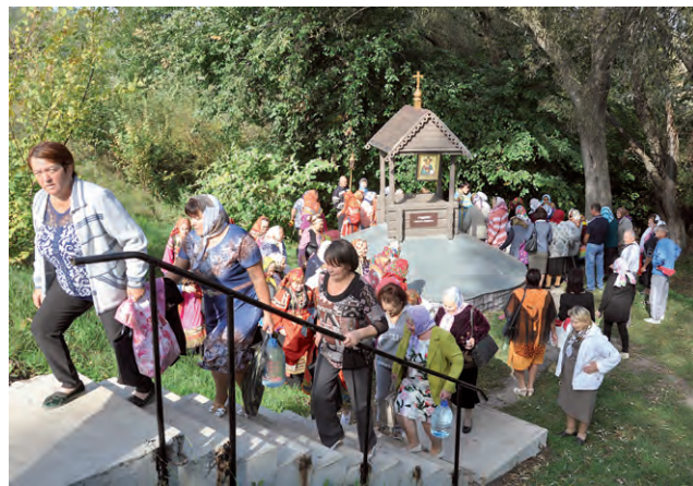
Подсередненцы у источника.