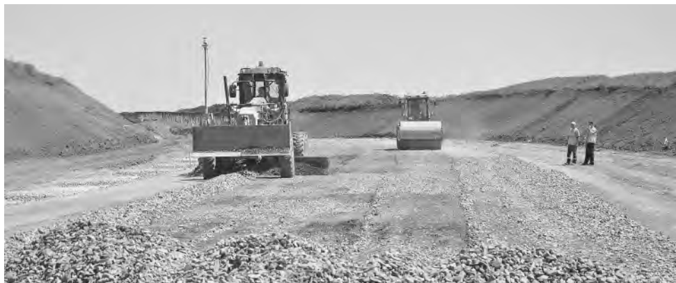
Готовится щебёночное основание дороги.