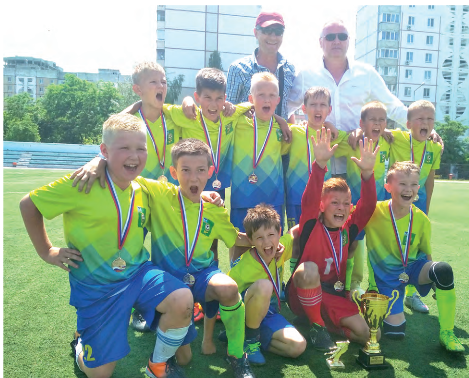
Радость «серебряной» «Слободы».