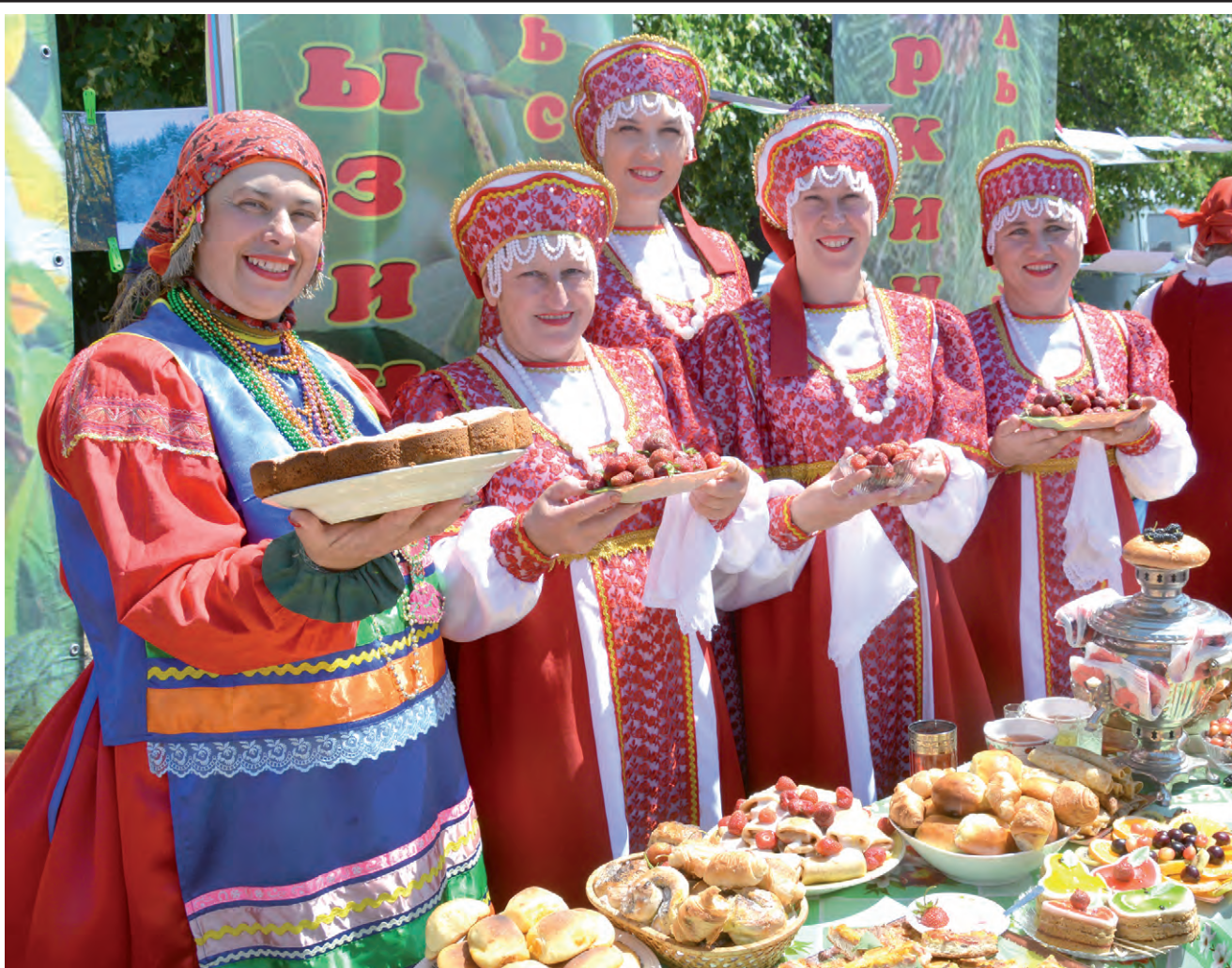
Участники фестиваля из Камызинского сельского поселения были щедры на угощения.