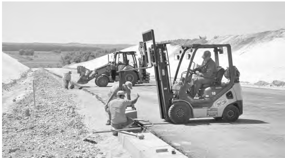
Идёт укладка плит водостока.

К сооружению переправы через реку приступили в начале марта, когда пойменный участок оказался заболоченным, местами затопленным. Это замедлило