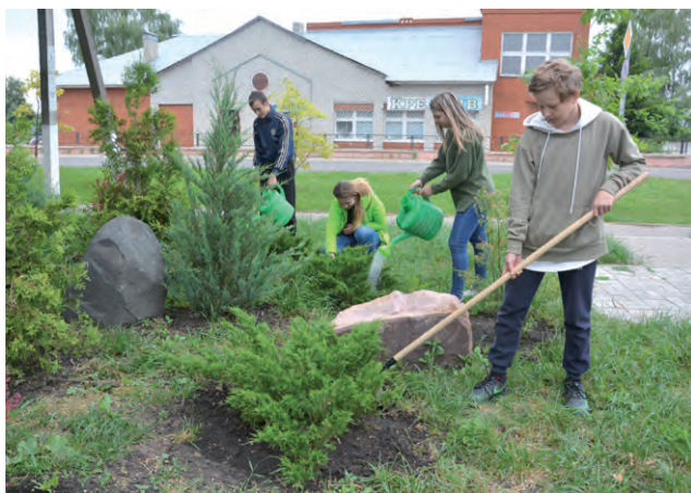
Больше всего подростков работает на благоустройстве территории.

Программа временного трудоустройства оказалась востребованной среди подростков Красненского района. В июньской смене занято работой более 60 несовершеннолетних. Общий план на лето — 118 человек.