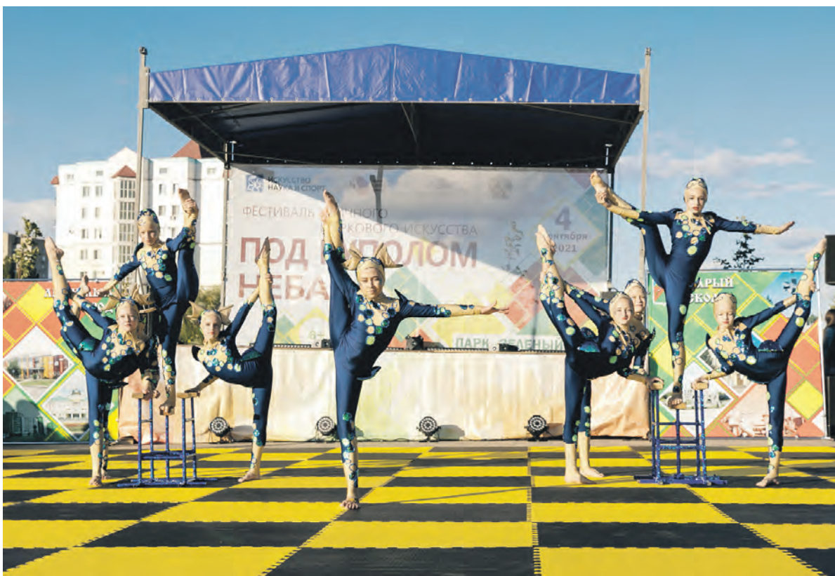
Алексеевский коллектив «Парадокс» показал на фестивале своё мастерство.