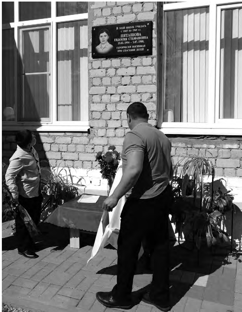
На открытии мемориального знака.