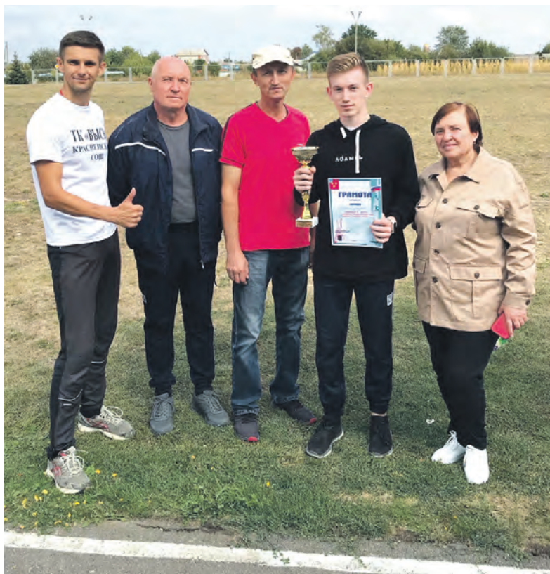
Команда Красненского сельского поселения с победным кубком.