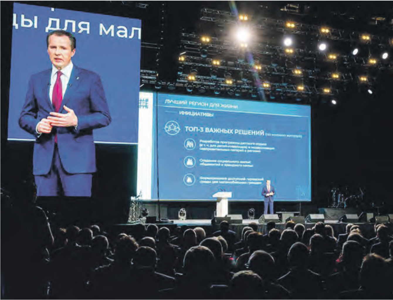
Форум, собравший тысячи жителей со всех муниципалитетов области, прошёл в новой «Белгород-Арене».