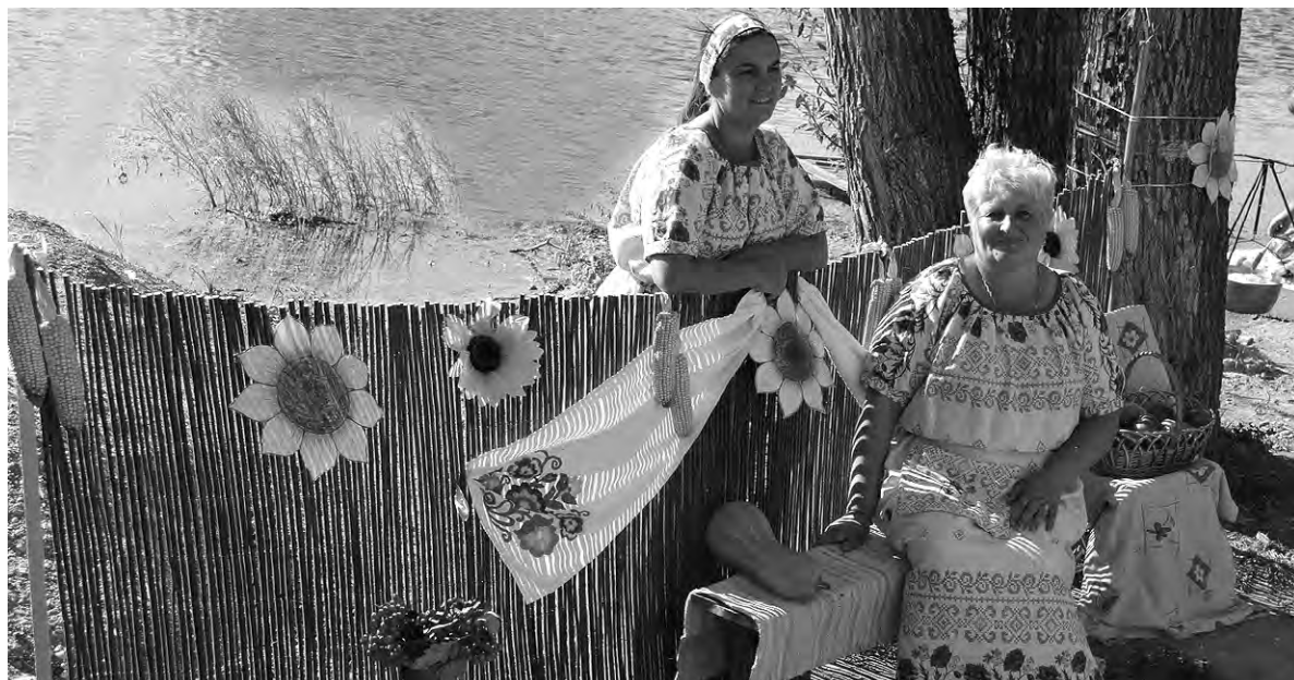
Фрагмент одной из многочисленных выставок на фестивале «Нет вольнее Тихой Сосны!».