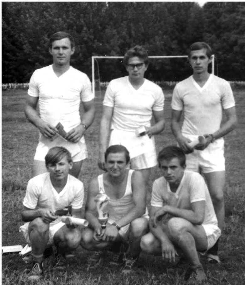
Сборная Алексеевки по лёгкой атлетике в конце 1960-х годов.