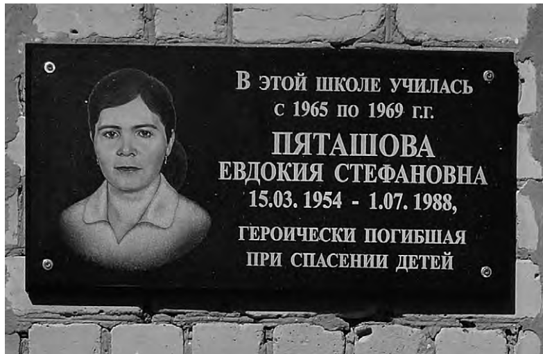
Памятная доска в честь Евдокии Пяташовой.