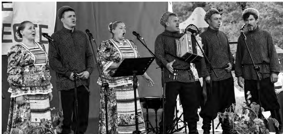
Гости из Россоши исполнили казачьи песни.