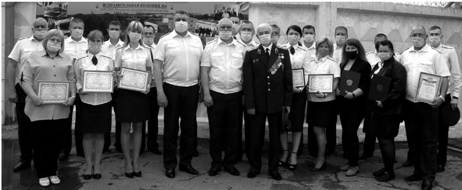
Руководство, сотрудники, ветераны колонии и гости юбилейного мероприятия.