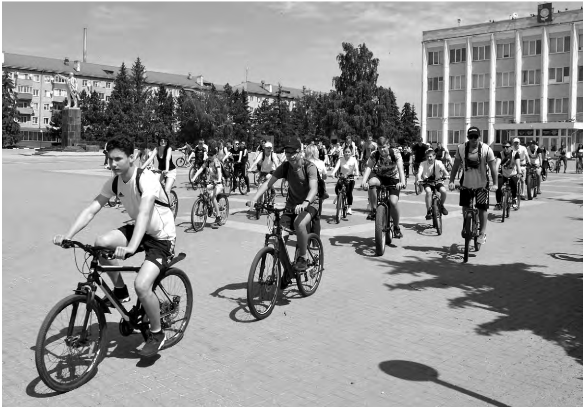
Более 85 велосипедистов стали участниками городского велопробега.