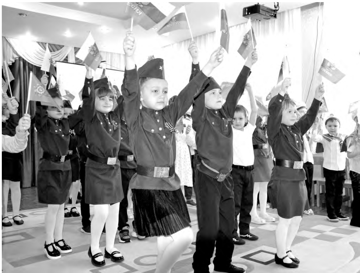
Каждый концертный номер был исполнен с душой.