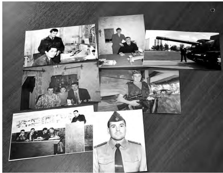
Каждая из этих фотокарточек — яркое воспоминание о службе.

А ещё он понял, что раньше не знал, что такое холод. Зима