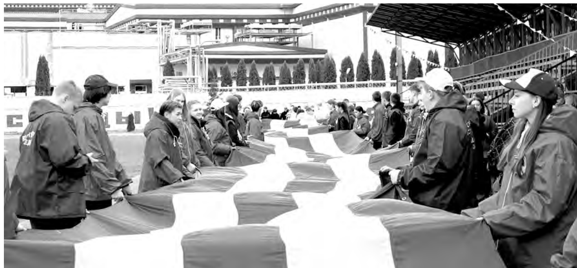
Накануне праздника волонтеры пронесли 81-метровое полотнище Георгиевской ленты по Алексеевскому центральному стадиону.