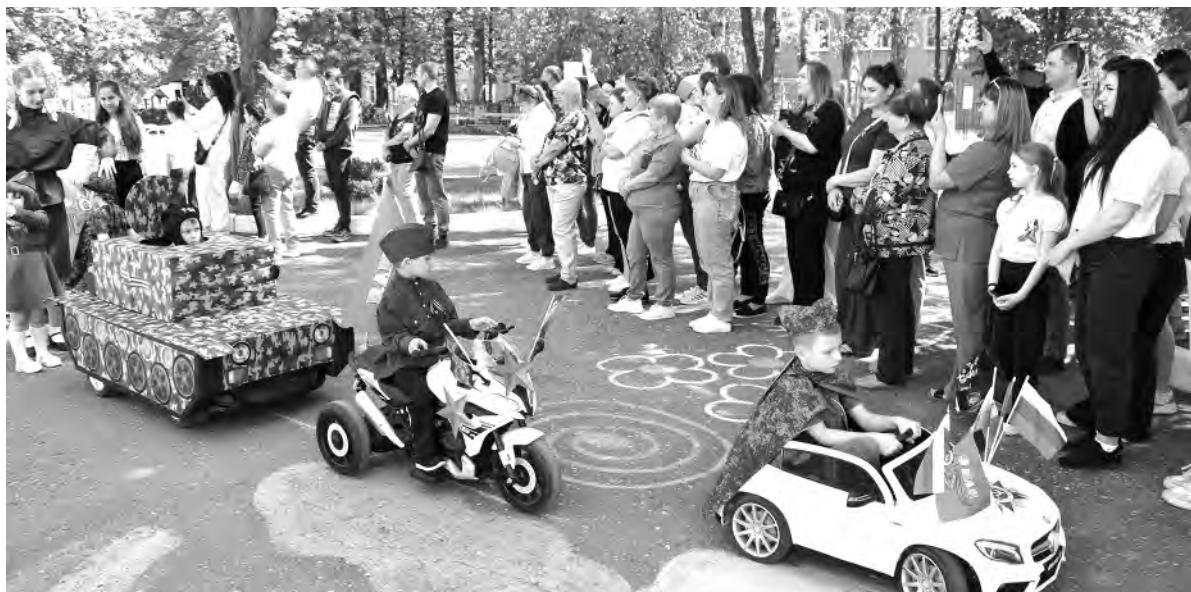
На марш выходит военная техника — макеты, сделанные руками родителей и педагогов.