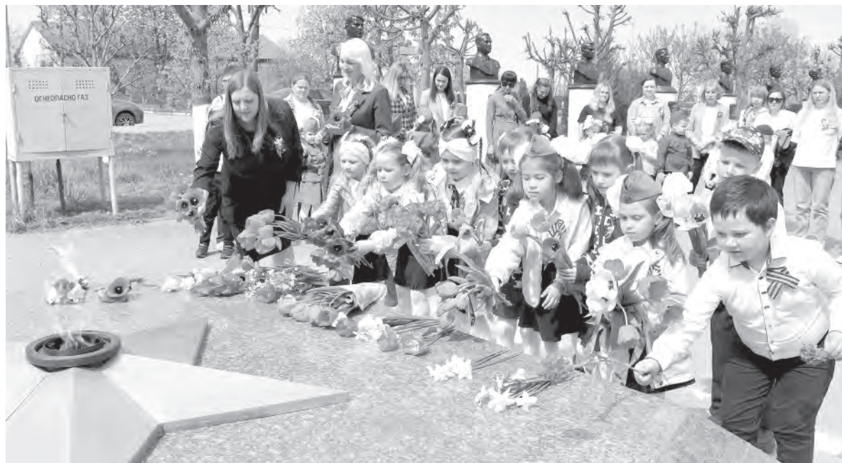
Под звуки фронтовых песен воспитанники Центра развития ребёнка — детского сада «Капелька», педагоги и родители опустили тюльпаны на гранитные плиты вечного огня.