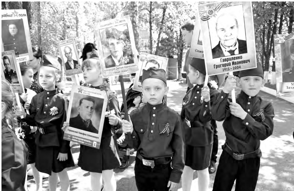
«Бессмертный полк» на портретах и в сердцах.