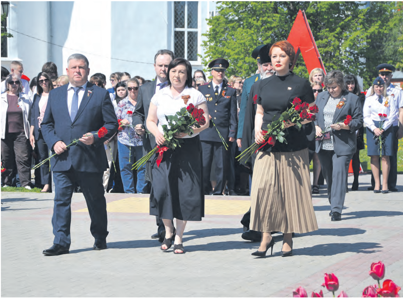
Момент торжественного возложения цветов во время празднования Дня Победы в Алексеевке.