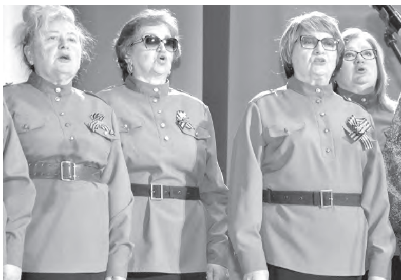
В исполнении алексеевского хора ветеранов «Поколение» прозвучали проникновенные композиции о войне.