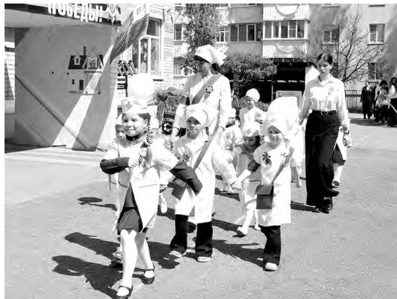
Парадный расчёт фронтовых медсестёр в исполнении детей.