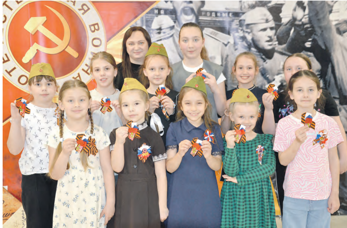
Юные мастерицы вложили частичку своей души в созданный символ Великой Победы.