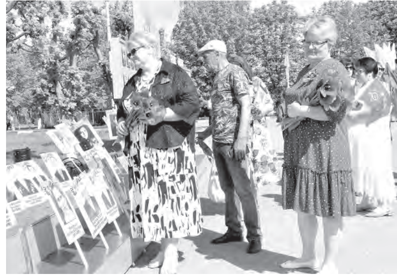
Портреты фронтовиков из Красненского района ежегодно присоединяются к «Бессмертному полку».