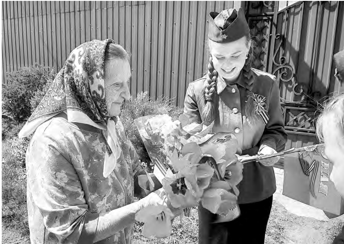
В преддверии Дня Победы работники культуры из Репенки вместе со школьниками навестили «детей войны», вручили им цветы и открытки.

Здесь же «Волонтёры Победы» устроили импровизированный танковый бой с настоящей радиоуправляемой техникой. Каждый прохожий мог взять пульт управления и стать командиром стальной машины: маневрировать, заходить в тыл противнику, устраивать засады и даже «подбивать» вражеские танки. Дети и взрослые с азартом сражались за победу, продумывали тактику и радовались каждому успешному манёвру. Причём, атмосфера была как в настоящем штабе: крики «Огонь!» и дружные возгласы.