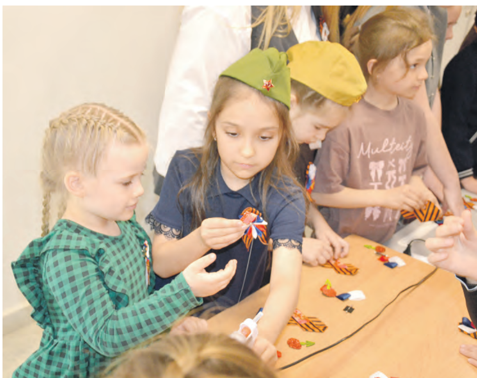
Дети с удовольствием окунулись в творческую атмосферу мастер-класса.

Так, накануне Дня Победы ученики 4 «Б», 5 «В», 7 «Б» и 7 «В» классов Алексеевской общеобразовательной школы № 7 встретились с