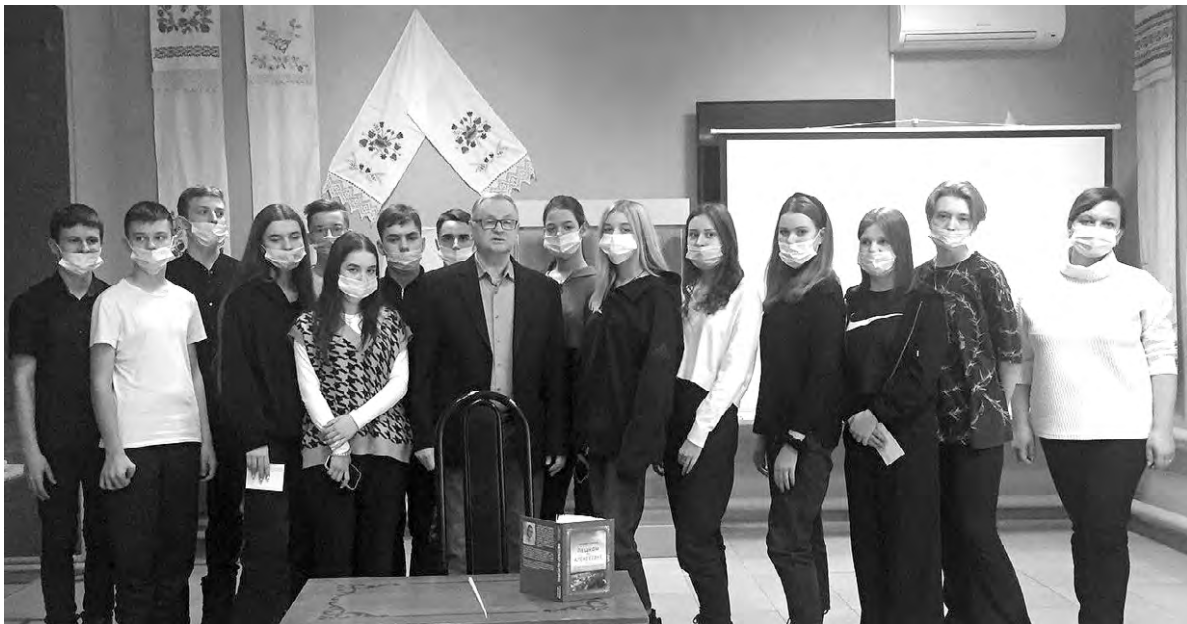
Старшеклассники городской средней школы № 7 на встрече с автором книги.