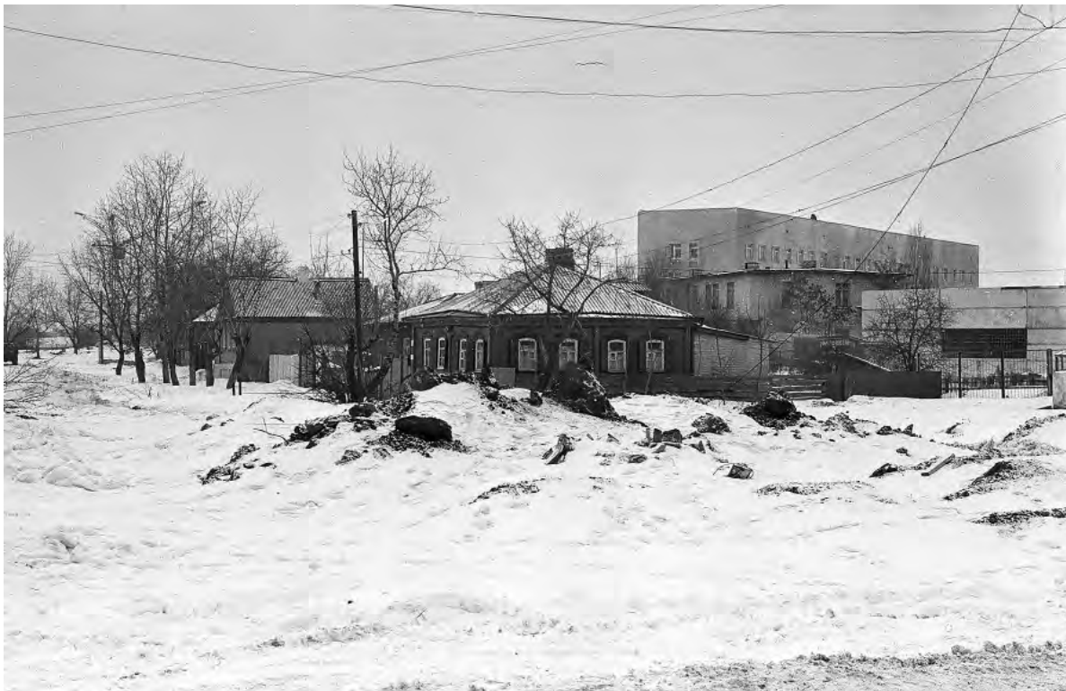
Пересечение ул. Некрасова и Ст. Разина. Конец 1980-х гг.