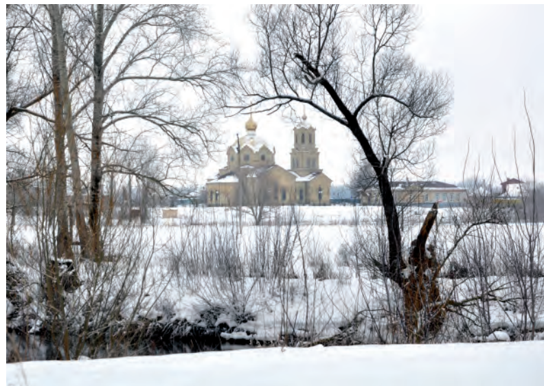
Храм Рождества Пресвятой Богородицы во всём своём величии.

Колтуновка вольготно раскинулась по обоим берегам Тихой Сосны. Когда возникло село, откуда пошло его название, точно никто не знает. Существует две версии. Первая — первопоселенцы страдали от волосяной болезни, которую называли колтунами. Вторая — по фамилии первопоселенцев, мелкопоместных дворян, неких Колтуновых.