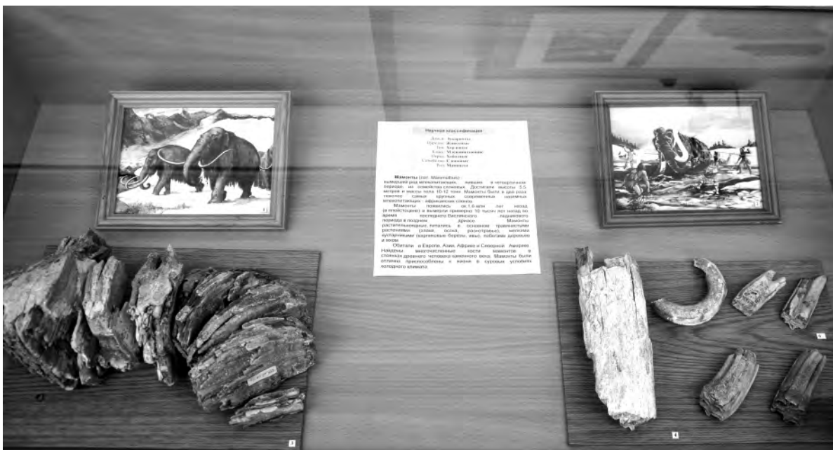
Фрагменты окаменевших бивня и зубы мамонта.

Подготовила Татьяна Краснова.