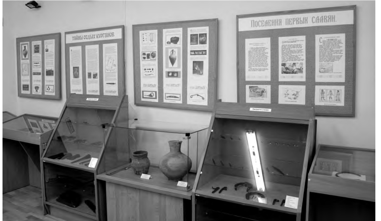
Все предметы, расположенные на витринах, найдены в нашей местности.

С 1964 по 1985 годы эти раскопки проводила археологическая экспедиция Академии наук СССР под руководством профессора Петра Либерова. На основе найденных предметов воссоздаётся картина прошлого. Многие находки были отправлены в столичный и Белгородский историко-краеведческий музей. А в районном можно посмотреть фотографии найденных вещей. Это украшения из серебра и золота,