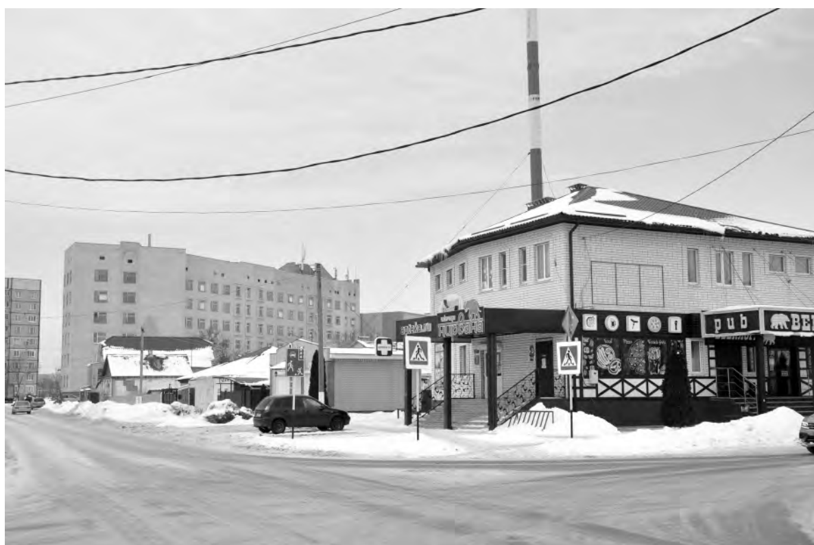
То же место в наши дни.