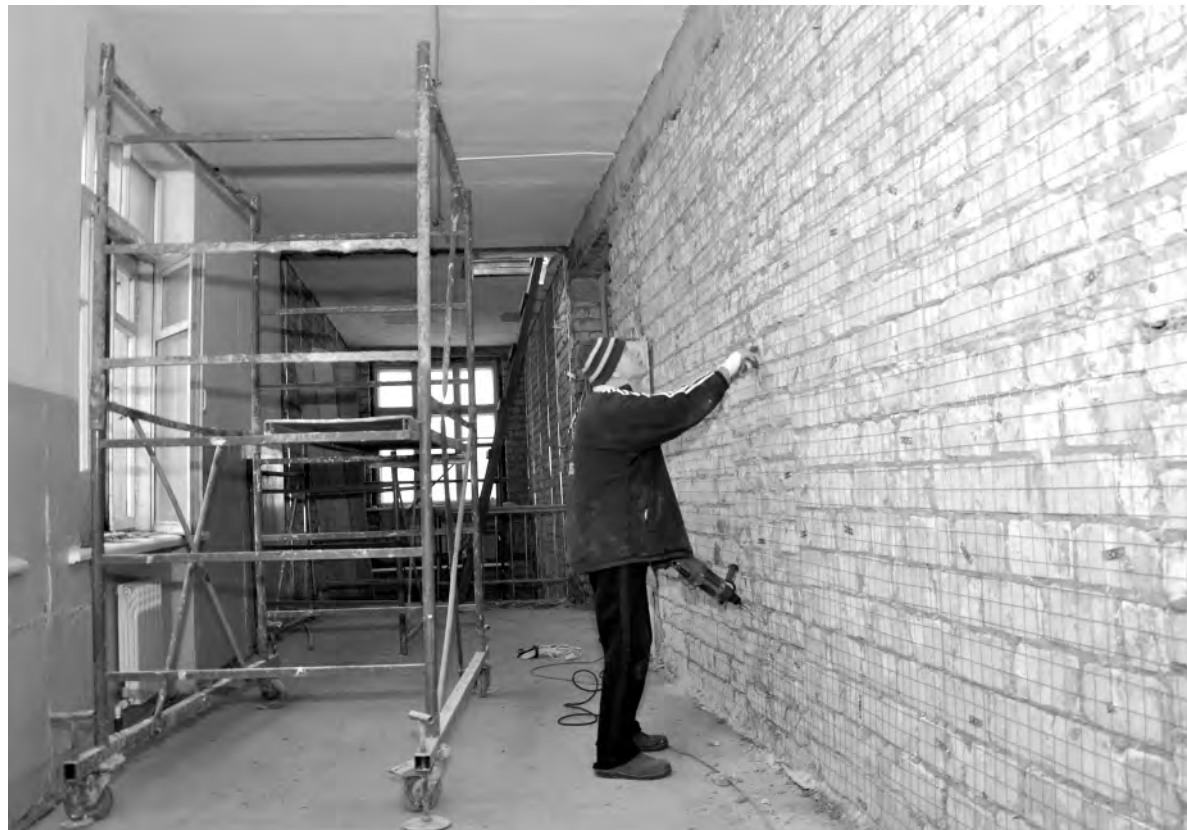
Идёт подготовка стены к отделке.