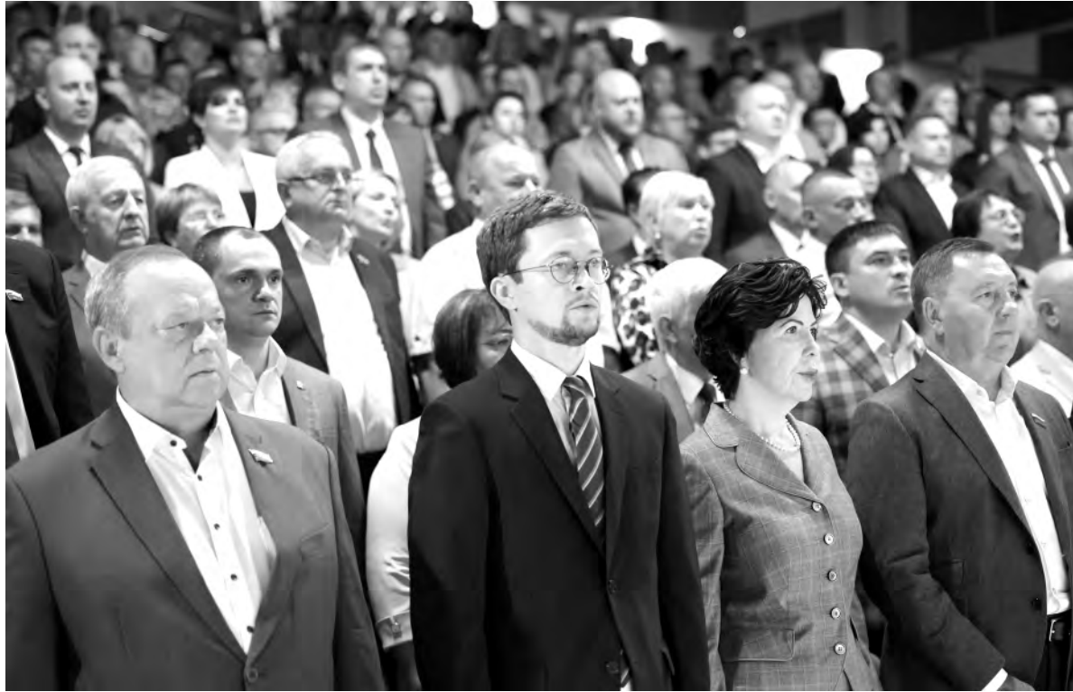
Депутаты облдумы и приглашённые во время исполнения гимна Российской Федерации.

— Мы верим в наше будущее и поэтому более всего вкладываемся в наших детей, — подчеркнул губернатор.