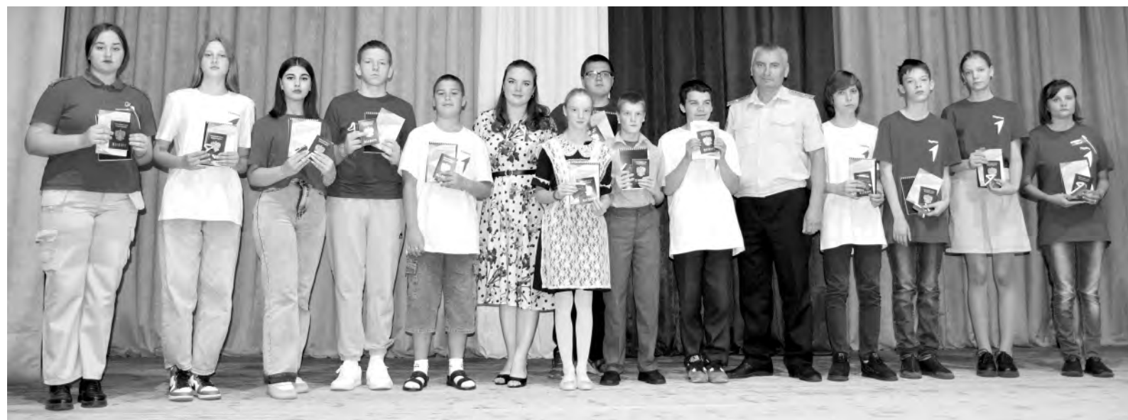
Символичным было вручение паспортов 14-летним жителям Красненского района в честь Дня России.