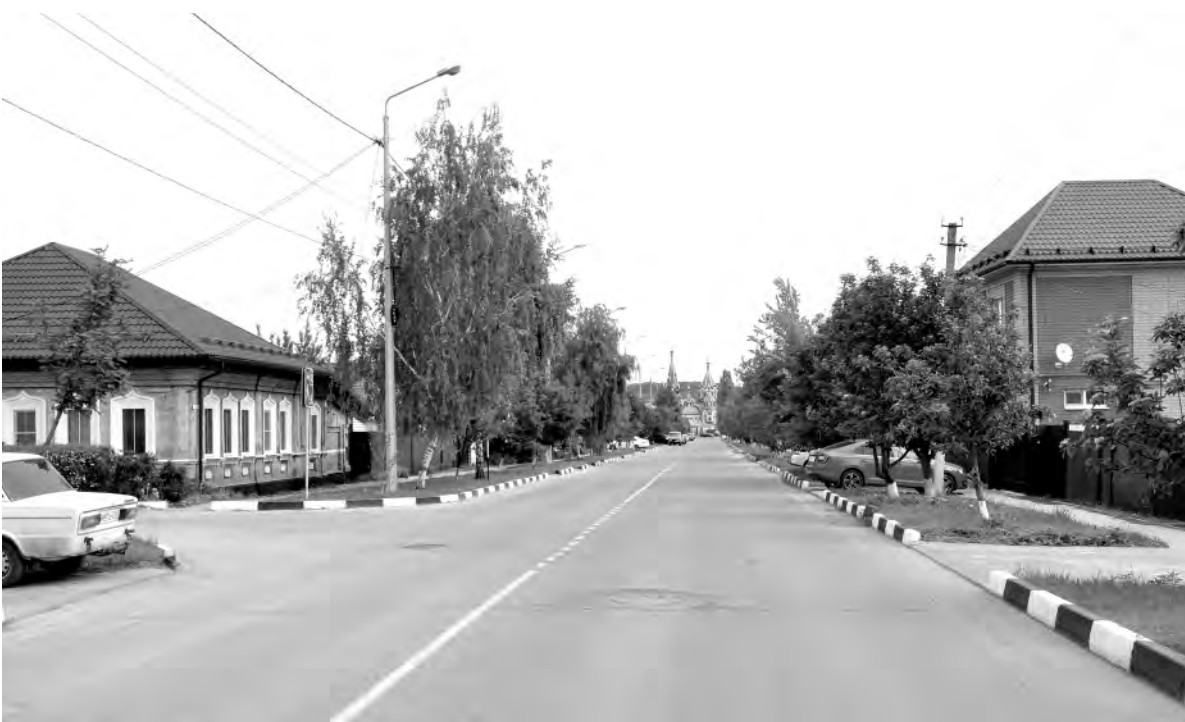
Это же место в наши дни.