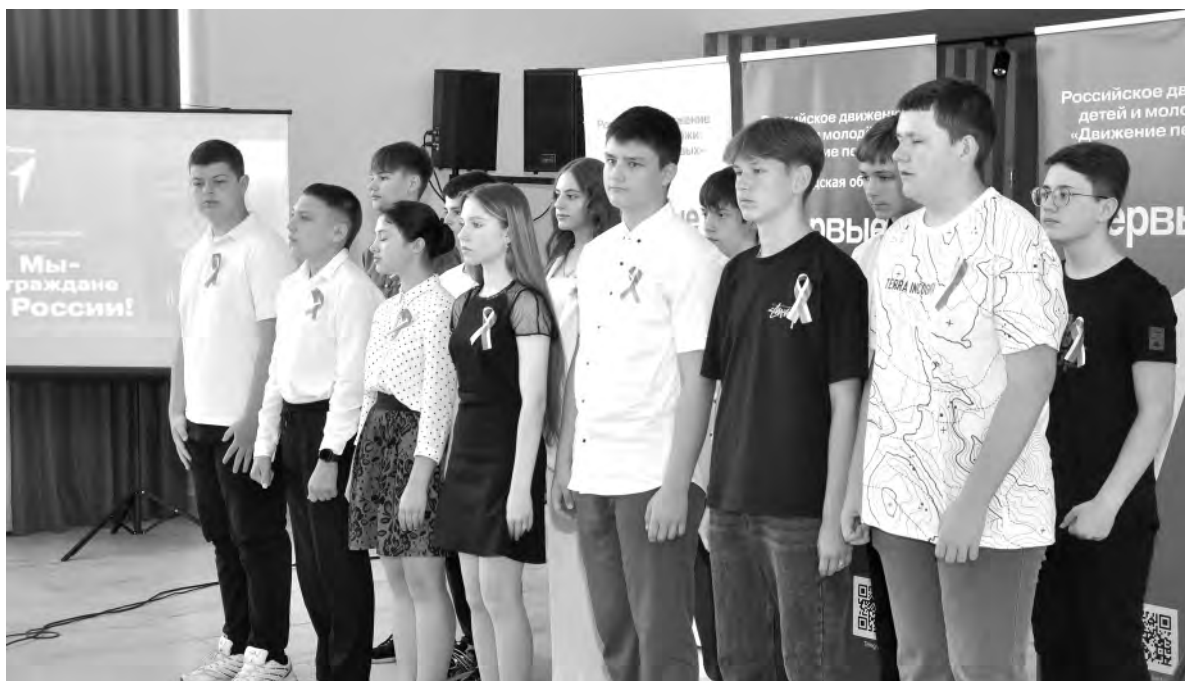
В жизни 14-летних подростков наступает новый этап.