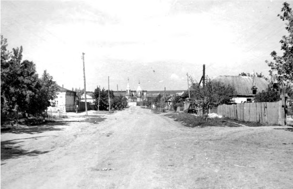
Ул. Слободская (Урицкого), 1970-е годы.