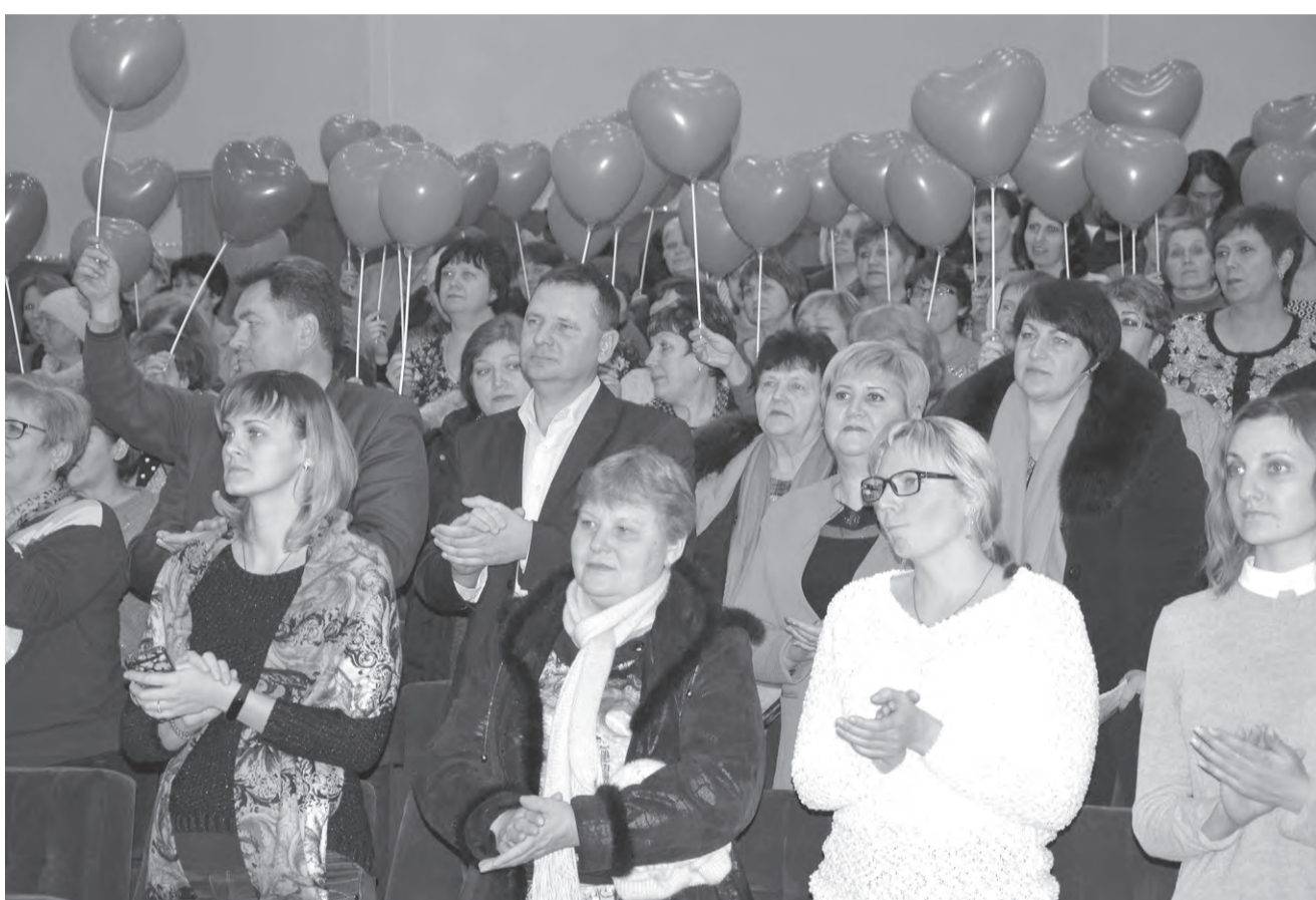
Красные воздушные шары в руках зрителей символизировали их отношение к добрым делам.