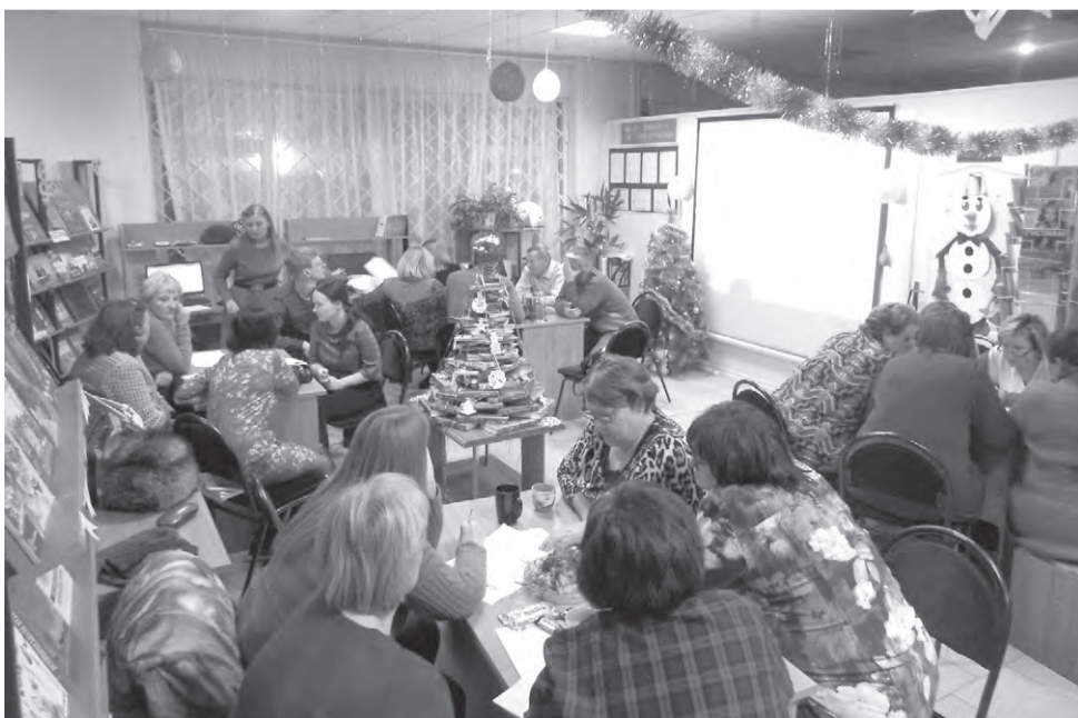
Коллективная мыслительная деятельность не только развивает, но и сплочает.