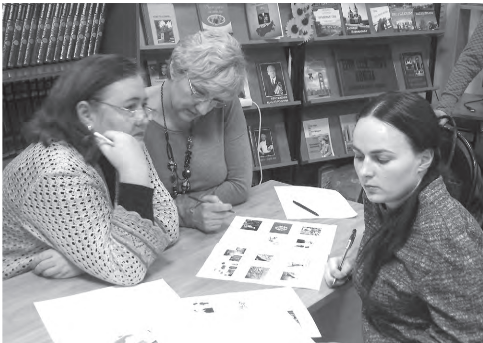
Команда «Мачете» в раздумье...

Следующий раунд — по картинкам (пикче). Вопросы проецируются на настенный экран, на столиках находятся те же самые картинки, на