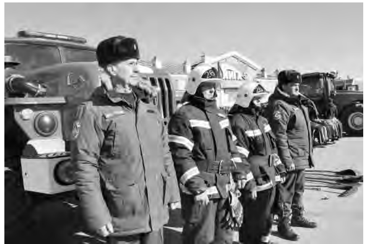
Сотрудники пожарно-спасательной части № 26 всегда готовы к оперативному выезду для ликвидации возгораний.