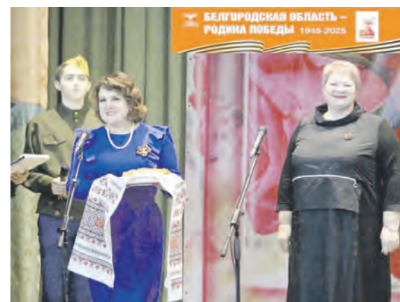
Соб. инф.

В скором времени принимающие стороны совершат ответные визиты и порадуют жителей новым творческим опытом.