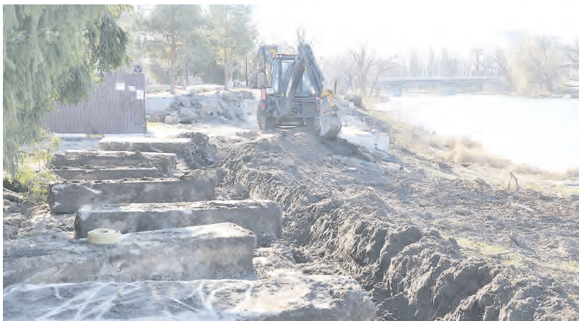
Тяжёлая техника незаменима при выполнении сложных работ.

С утра до вечера на набережной ведутся работы по демонтажу тротуарной плитки.