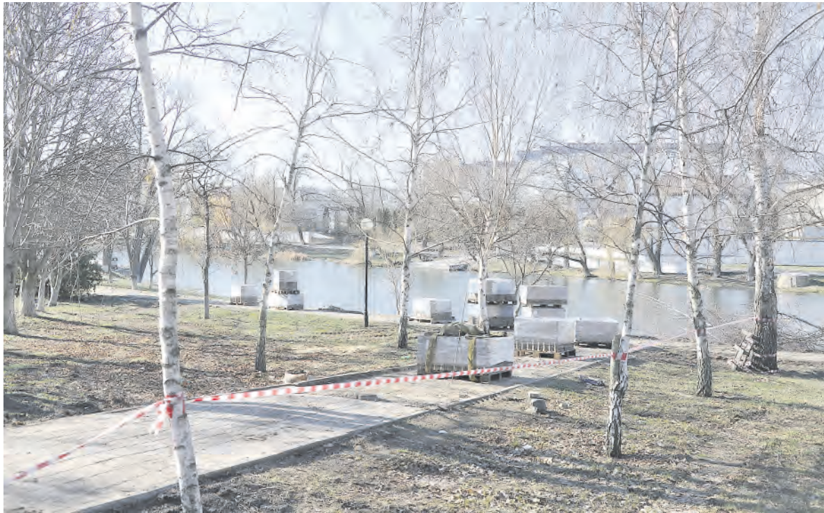
До 1 августа текущего года завершатся работы по благоустройству участка набережной Тихой Сосны.