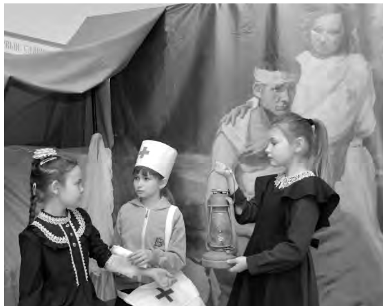
В импровизированном госпитале дети инсценируют ситуации военного времени.

Ежедневно на странице музея в ВК сотрудники ведут онлайн-календарь «Приближая великую дату», где рассказывают хронологию фронтовых событий 1945-го года. Статистический исторический материал, соответствующий определённым датам, специалисты дополняют подвигами и биографиями ветеранов-земляков.