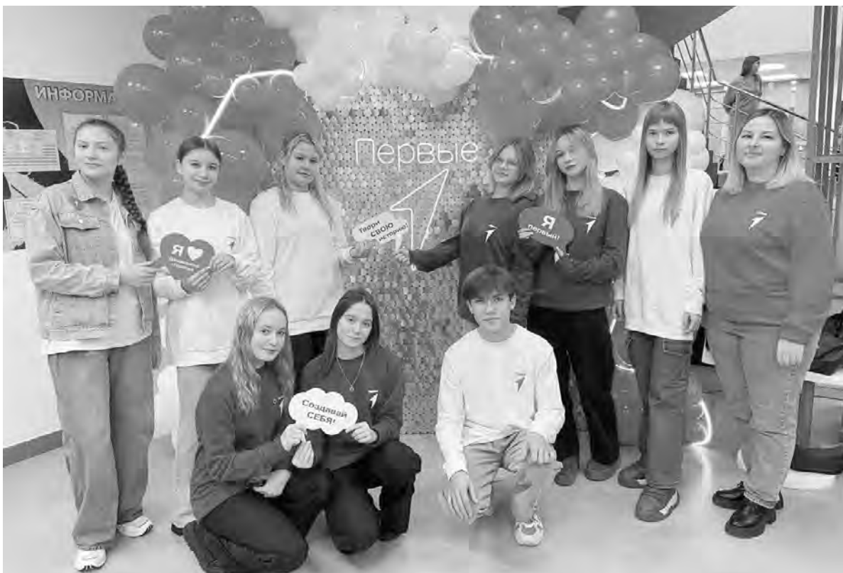
Активисты движения сделали фото на память во время выборов совета Первых местного отделения.