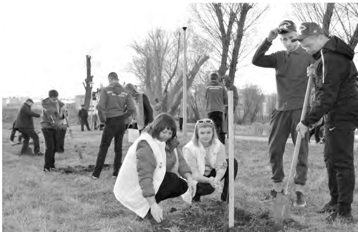
На набережной Тихой Сосны высадили 80 саженцев ивы, катальпы и черёмухи.