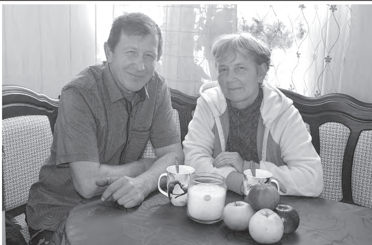
После домашних хлопот супруги Бугаковы любят поговорить за чашкой чая.