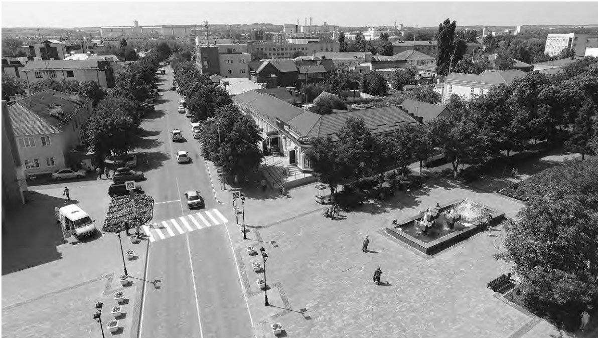
На перекрёстке улиц имени Гагарина и Мостовой. 2019 год.