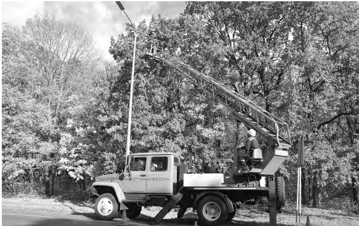
Красненские энергетики проверяют техническое состояние новых фонарей.