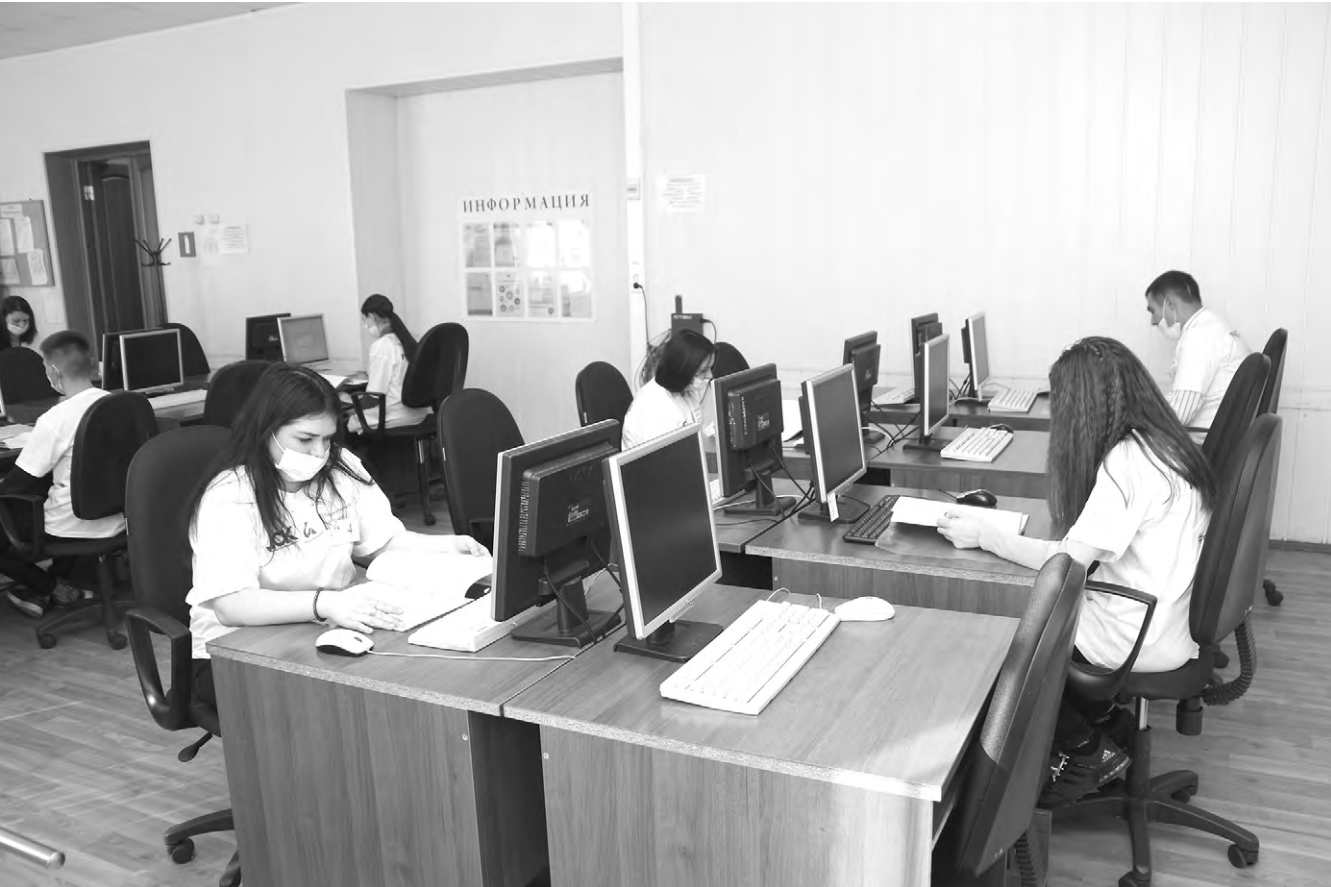
Началось первое конкурсное соревнование, требующее сосредоточенности и прочных знаний.