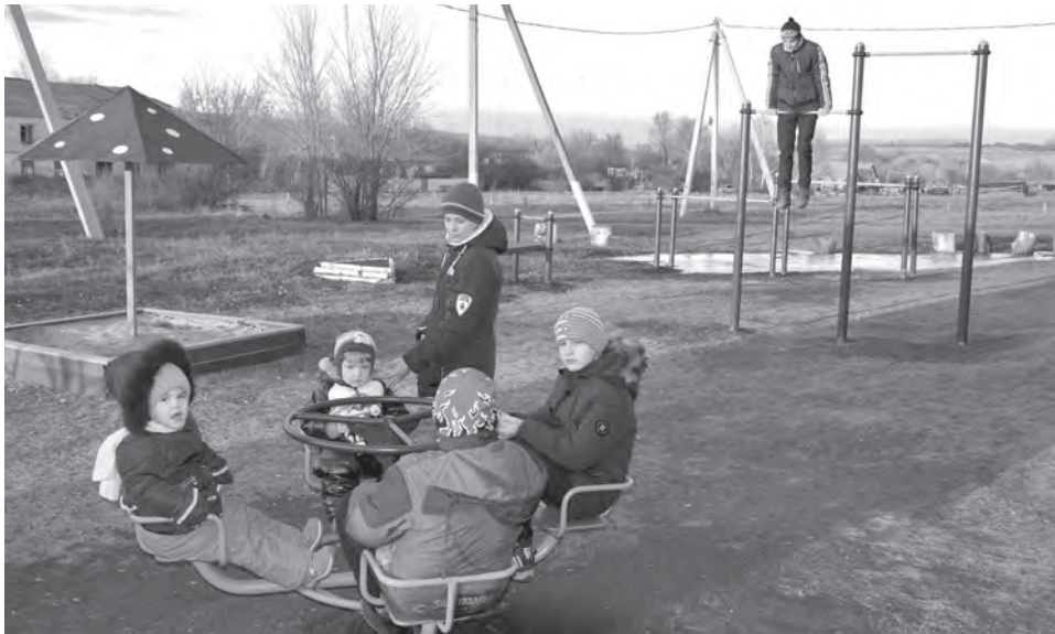
Чтобы дети не скучали и здоровье укрепляли!