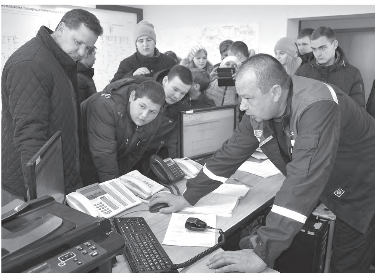
В диспетчерском пункте было всё интересно.

ВТОРНИК, 4 декабря: температура: днём -3°, ночью -12°; давление (мм рт.