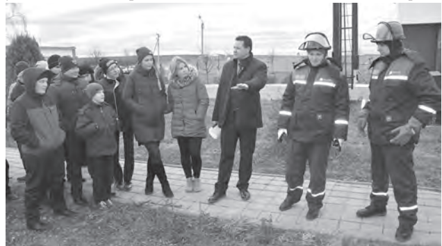
На учебно-тренировочном полигоне ребятам показали практические занятия электриков.

С 3 по 13 декабря проходит Всероссийская декада подписки. Стоимость полу- годового комплекта межрайонной газеты «Заря» 489 руб. 54 коп. Для участников Великой Отечественной войны, инвалидов 1-й и 2-й групп по предъявлению удостоверения стоимость составляет 428 руб. 94 коп. Подписаться можно в отделениях почтовой связи или у почтальонов.