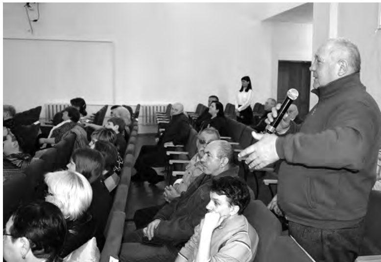
Из зала поступило немало вопросов.