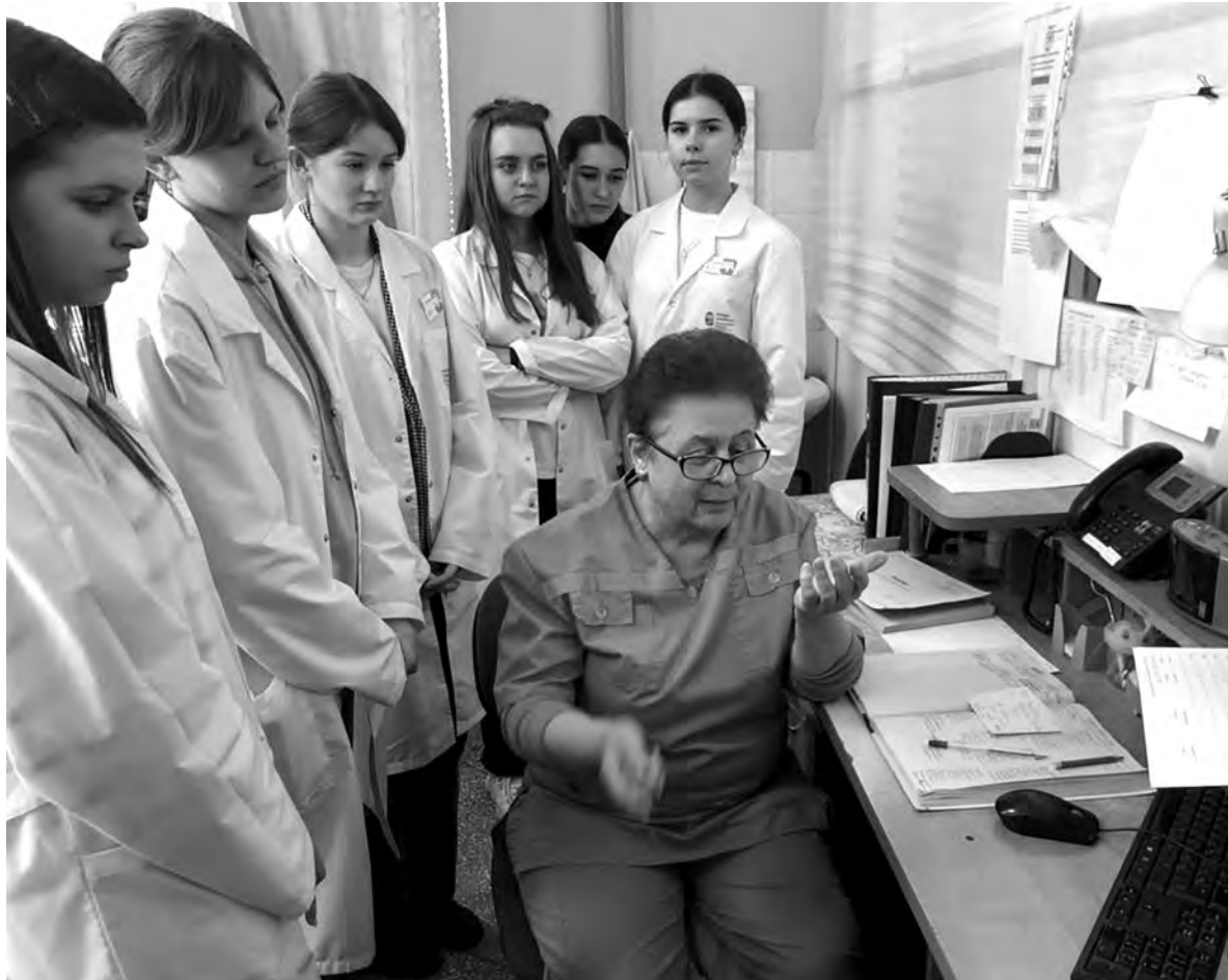
Ученики медицинских классов во время недавнего посещения Алексеевской подстанции скорой помощи.