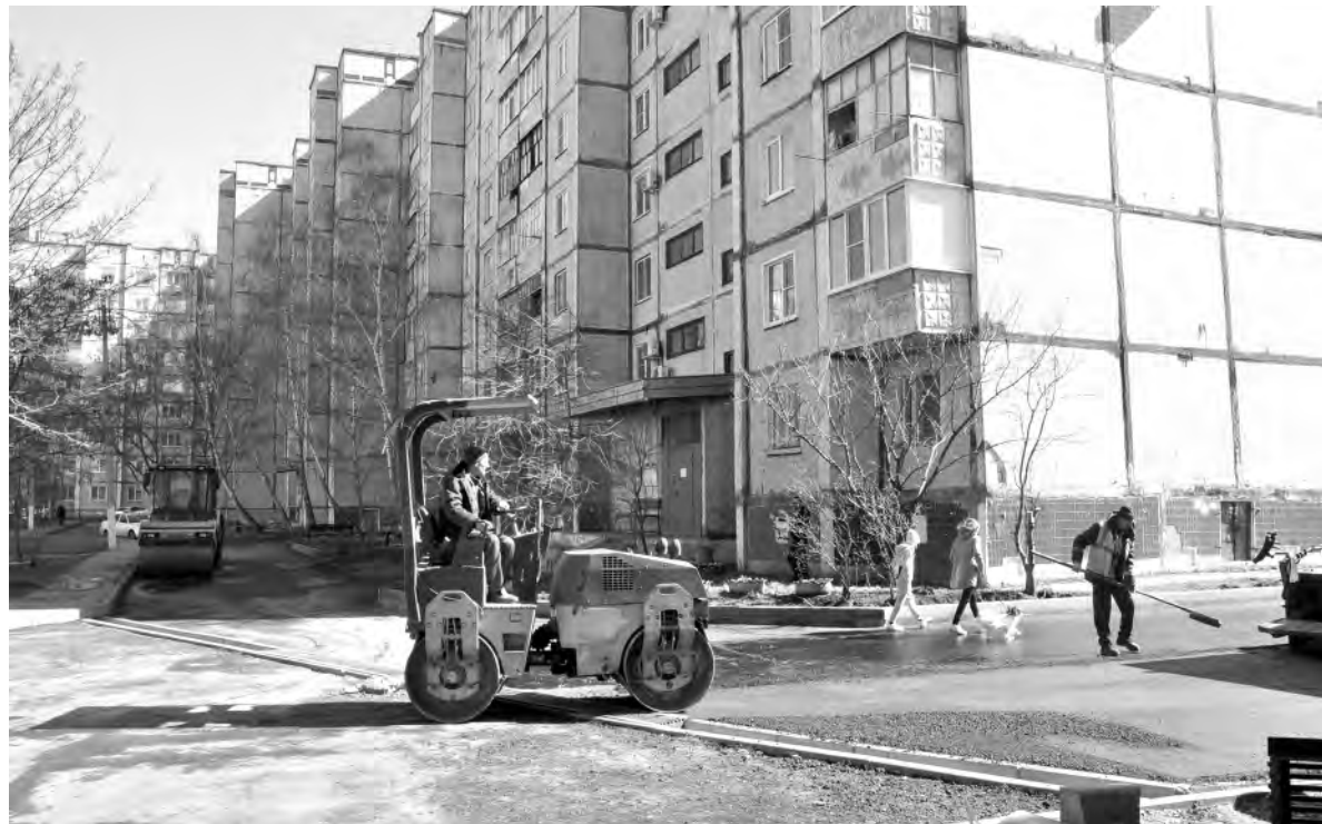
Работа во дворе девятиэтажек идёт полным ходом.