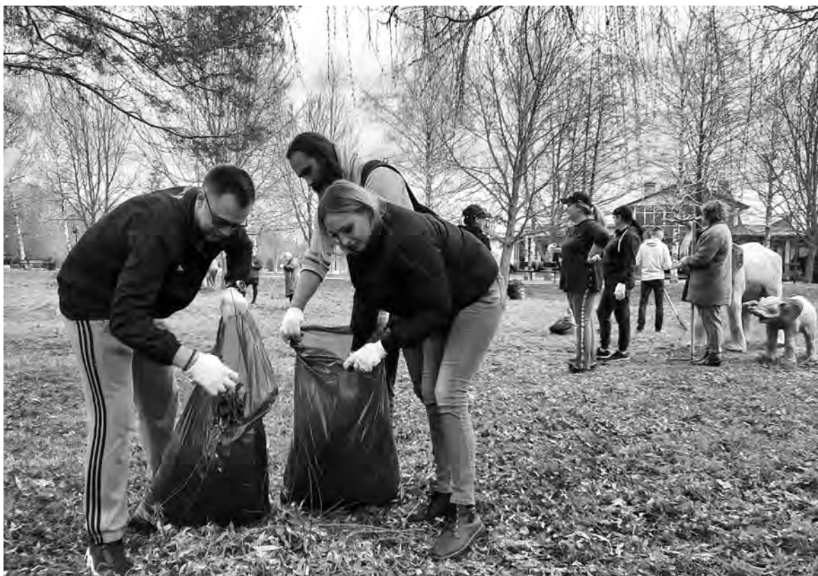
Работники управления культуры администрации горокруга во время уборки в Центральном парке.