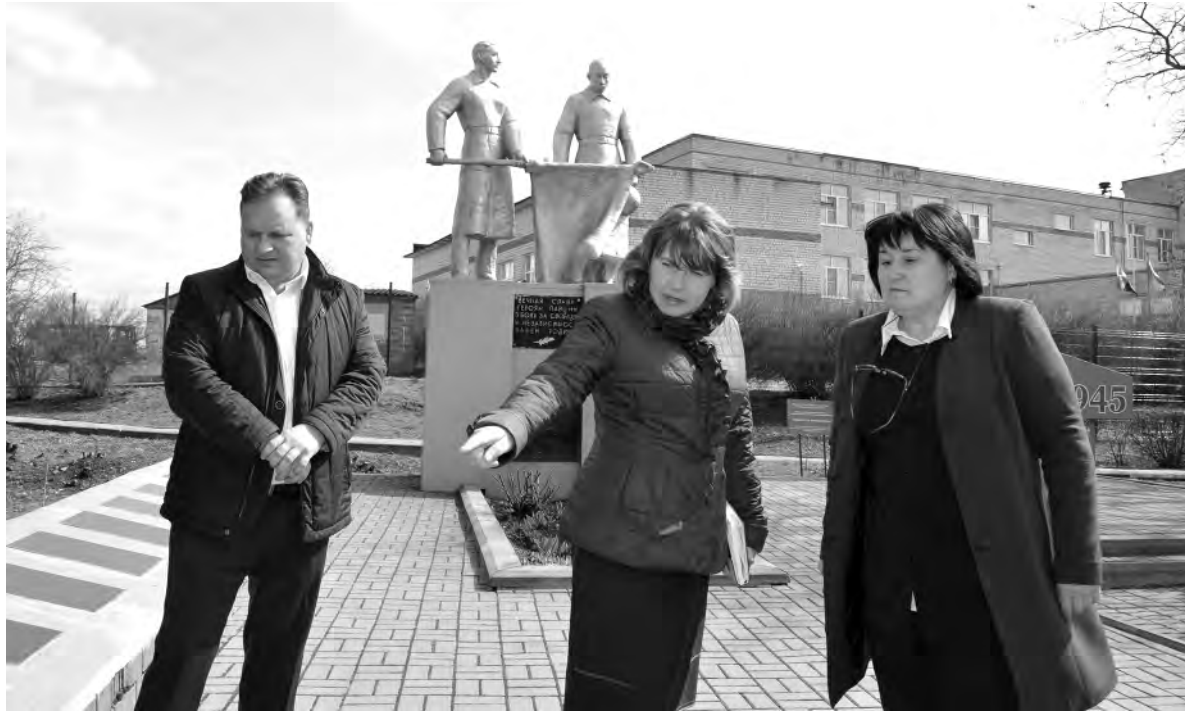
Члены рабочей группы во время осмотра центра села Матрёно-Гезово.

Другая — люди выразили желание, чтобы на сельской территории были очищены водоёмы. И вот здесь им в помощь программа губернатора Белгородской обла-