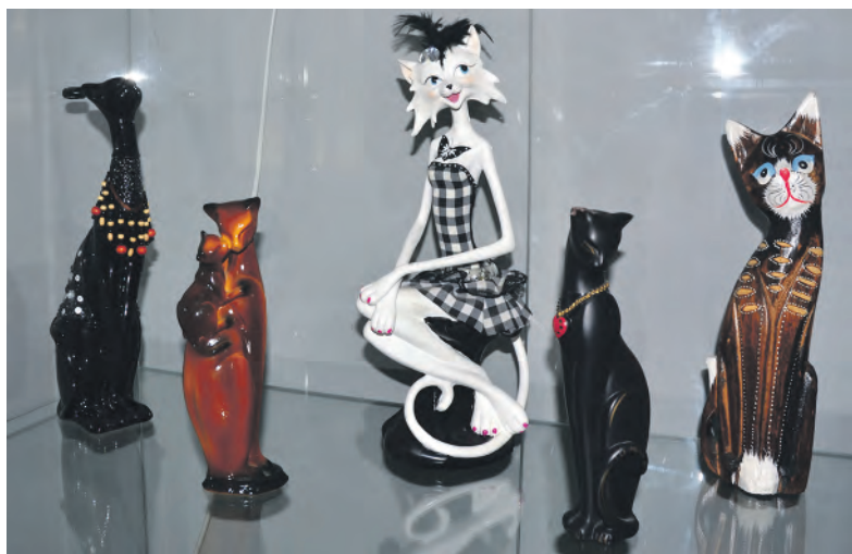
Коллекция Валентины Рыбенко.