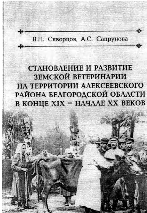
Обложка книги об истоках ветеринарии в Алексеевском городском округе.