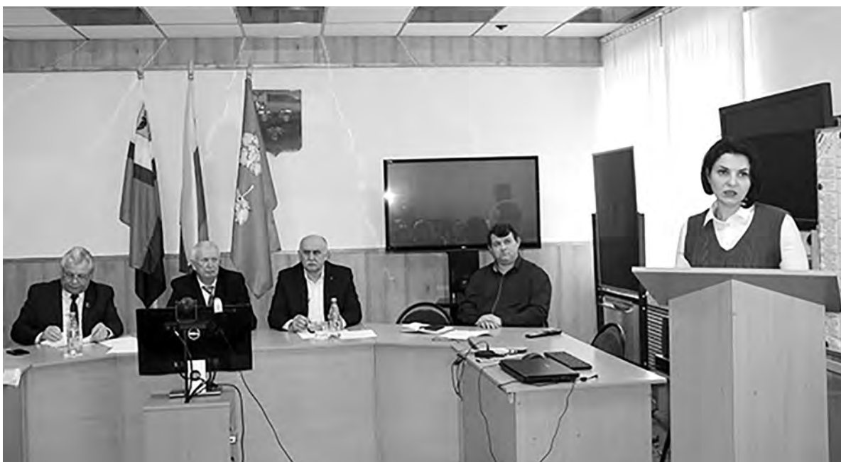
Профсоюзные лидеры района и области всесторонне проанализировали работу местного Координационного совета.