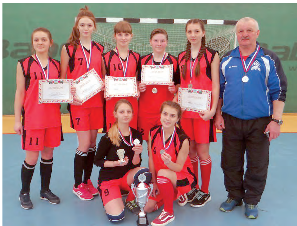
Наши девушки вместе со своим тренером после церемонии награждения.