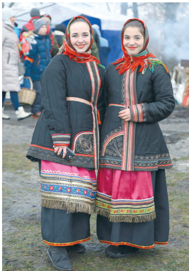
Иловские участницы фестиваля.

Молодёжный фольклорный ансамбль «Здравица» был