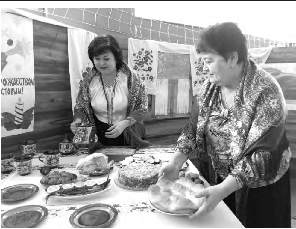
Накрытые столы были полны вкусных и разнообразных угощений.

В рамках реализации проекта «Формирование системы популяризации здорового питания на базе общеобразовательных учреждений Алексеевского района» в Глуховской школе провели несколько мероприятий. Это устный журнал «Традиции русской кухни», конкурс-викторина