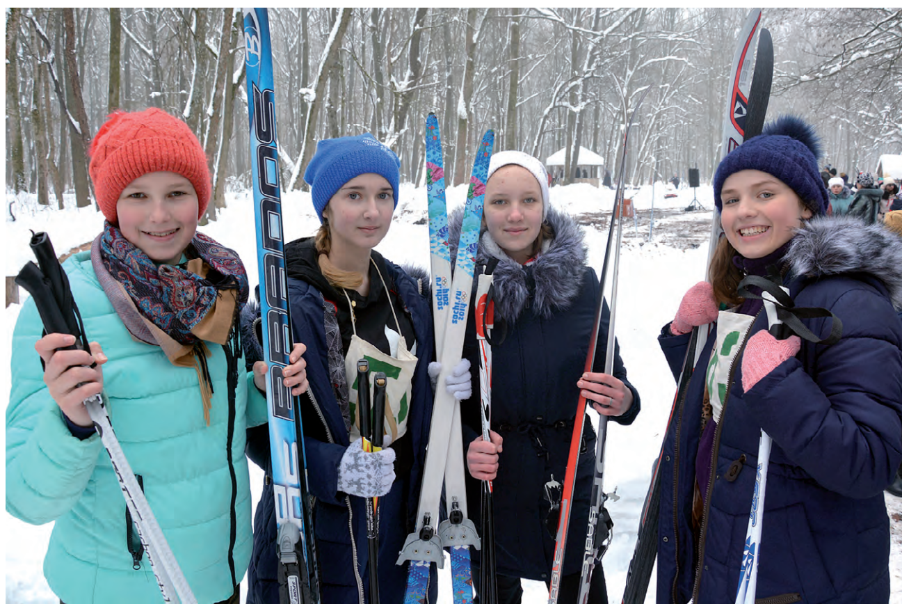
Квартет юных участниц зимнего забега из Круглого.