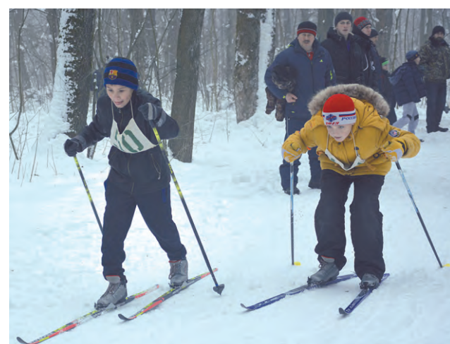
Состязание на лыжне.