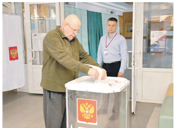
Соб. инф.

В Алексеевском муниципальном округе приняли участие в голосовании 43 198 жителей, что составляет 89,22% от общего числа избирателей, в Красненском районе свой голос за представленных кандидатов отдали 7597 жителей, или 87,6% избирателей. Территориальные избирательные комиссии обработали итоговые протоколы участковых избиркомов и подвели итоги голосования. Результаты местной избирательной кампании публикуются в сегодняшнем номере «Заря».