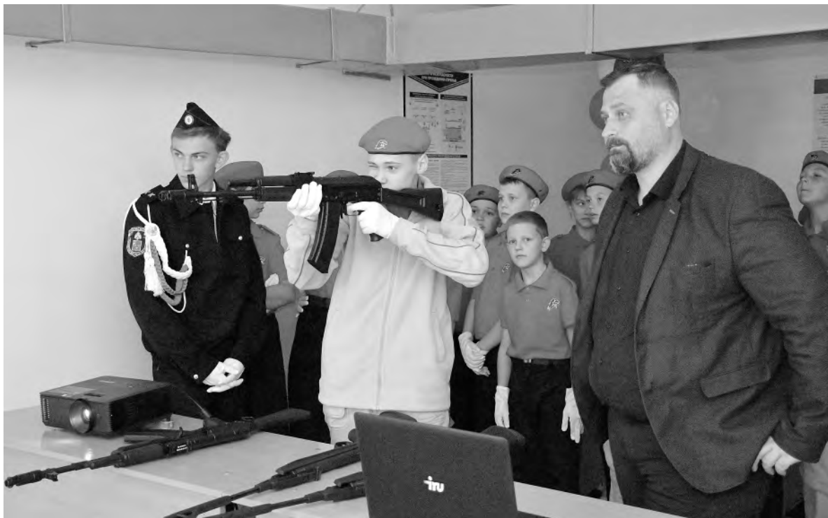
На первом занятии ребята проявили собранность и меткость, точно попадая в цель.