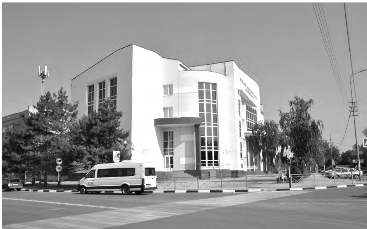
Это же место сейчас.