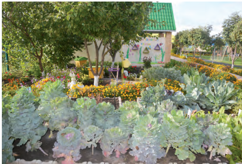
Мини-огород знакомит детей с ростом и развитием растений.