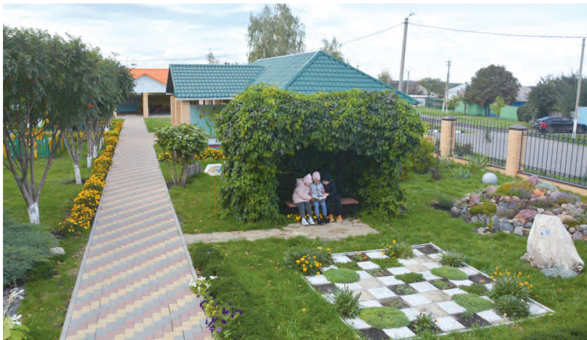
В детском саду немало уютных уголков, где можно провести время с пользой.