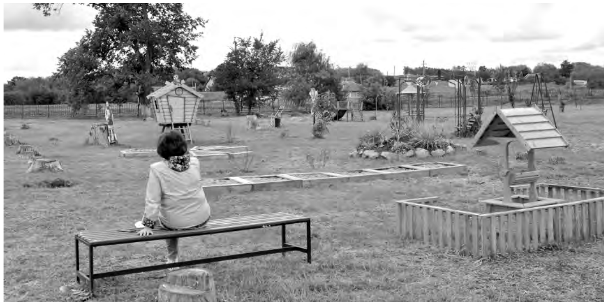
Оборудованный уголок со сказочными элементами сделал местный парк ещё привлекательнее.

Зато имеется много элементов, которые интересуют, прежде всего, детишек. А недавно здесь появились новые малые архитектурные формы: домик Бабы Яги, мельница, колодец, две скамейки и песочницы для занятий баренфутингом (хождением по нему босыми ногами), а также установ-