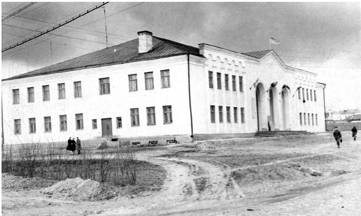
Перекрёсток ул. Победы и Мостовой. 1960-е годы.