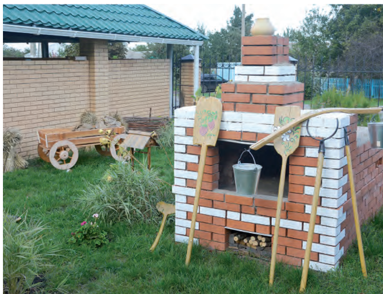
Тематическая зона «Сельский дворик».

Заря Учредители: министерство общественных коммуникаций Белгородской области; администрация Алексеевского городского округа, администрация Красненского района Белгородской области, Совет депутатов Алексеевского городского округа Белгородской области, муниципальной совет муниципального района «Красненский район», АНО «Редакция газеты «Заря».