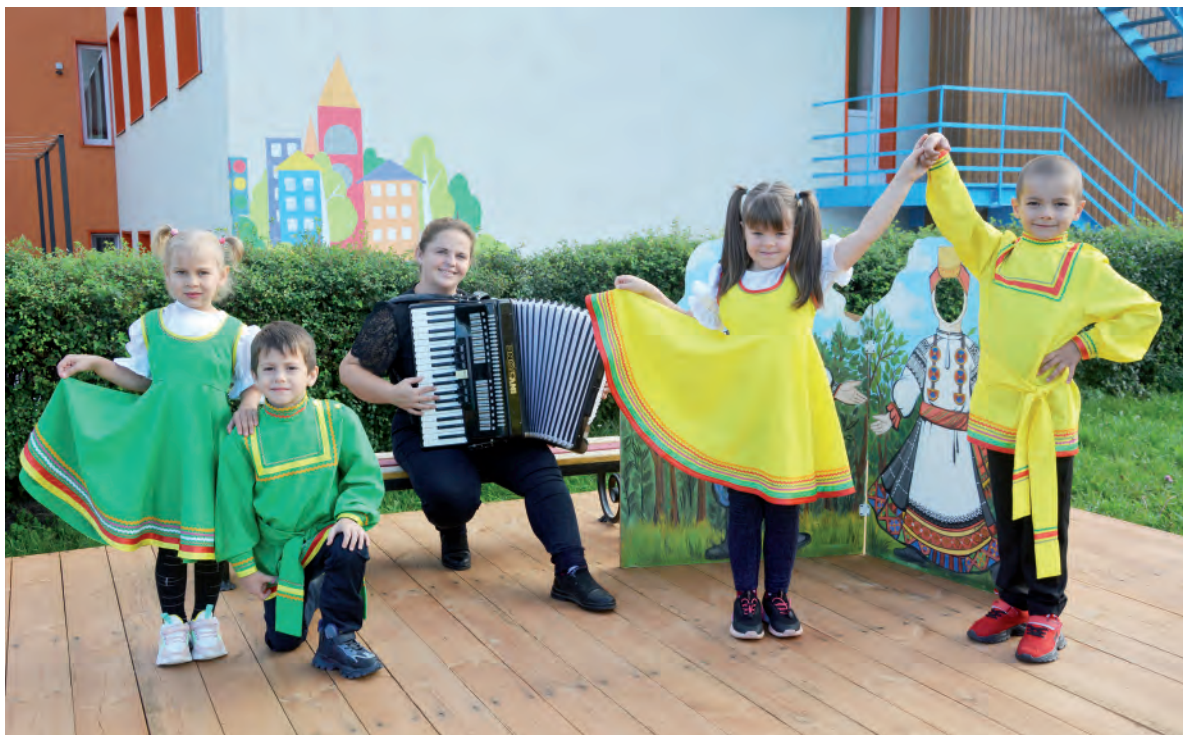
Уличная сцена — первая ступень выражения музыкальных талантов дошколят.