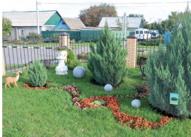
Такая красота формирует у малышей бережное отношение к природе.