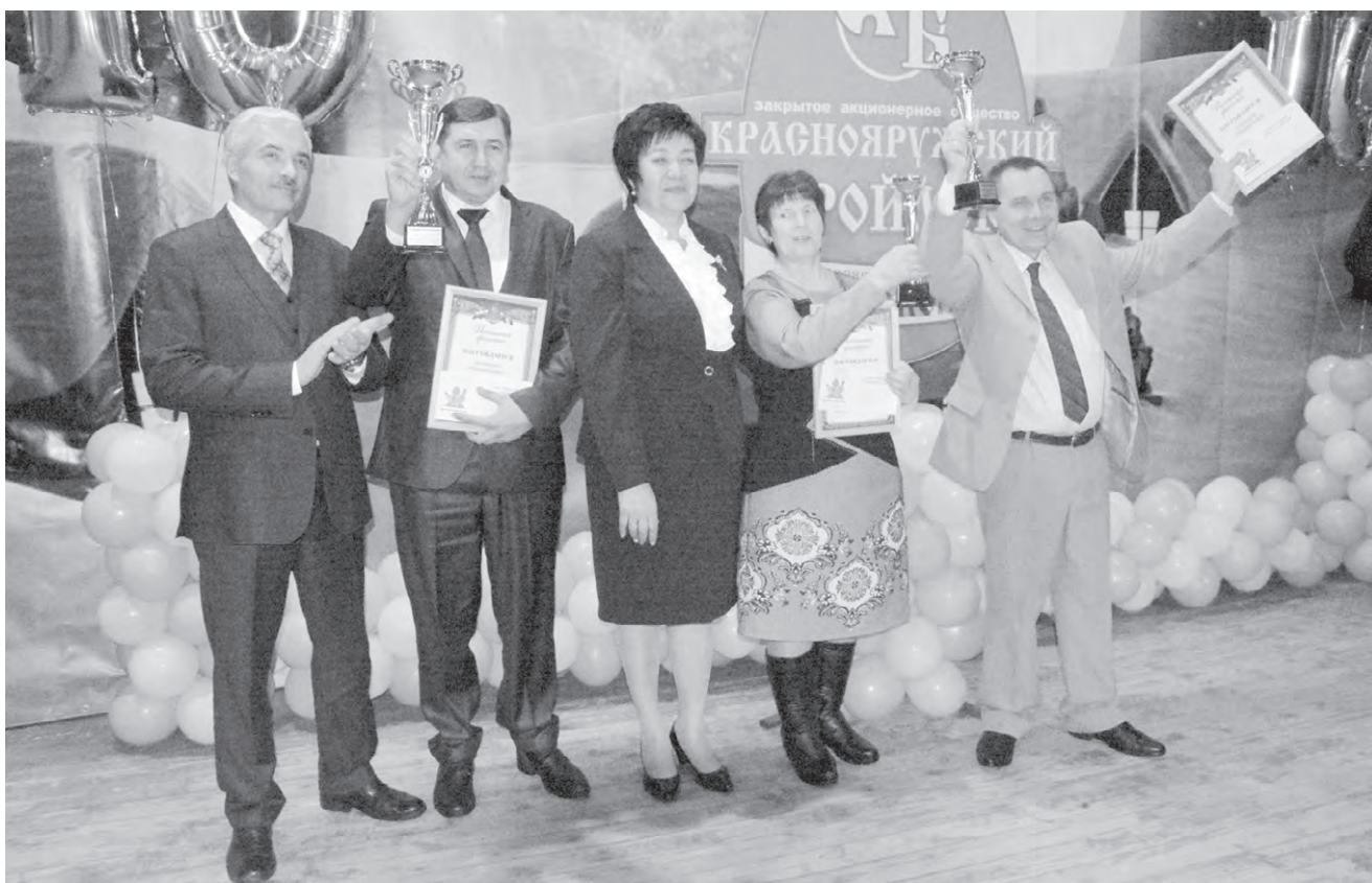
На сцене центра культурного развития «Радужный» победам радовались вместе.

ПЯТНИЦА, 19 января: температура: днём -1°, ночью -6°; давление (мм рт. ст.) 753; ветер (м/с) 5, юго-восточный, пасмурно, небольшой снег. www.gismeteo.ru