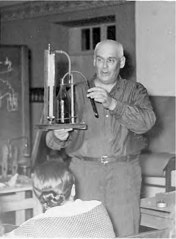
Один из приборов химкабинета, изготовленный руками учеников.