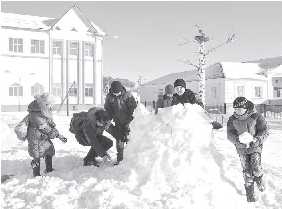
Зимние детские забавы.