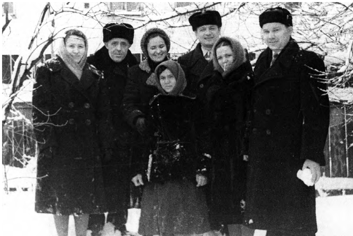
Сотрудники газеты в феврале 1962 года.