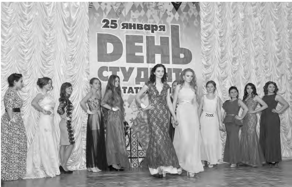
Когда сцена превращается в подиум.

Праздник молодости, красоты и талантов традиционно прошёл в День студента. В актовом зале алексеевской школы искусств собрались зрители, желающие посмотреть и дать свою оценку юным красавицам.