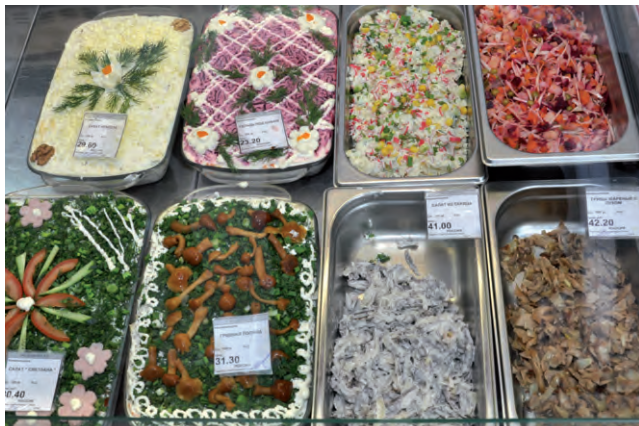
Салаты здесь пользуются неизменным успехом.