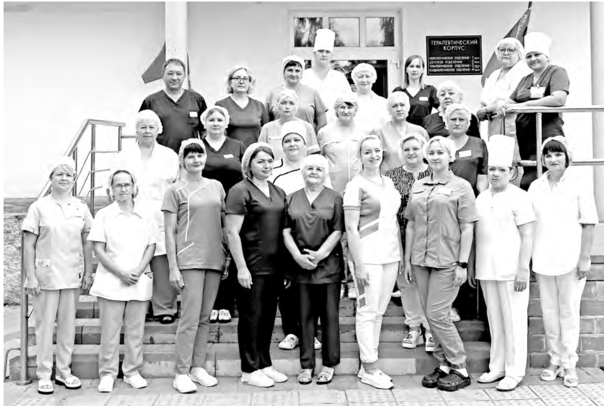
Коллектив неврологического отделения Алексеевской центральной районной больницы, занесённый на Доску Почёта муниципалитета.

— В поликлинике свои обстоятельства: много работы с до-