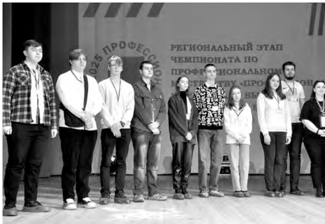
На базе Алексеевского колледжа прошёл региональный этап чемпионата по профмастерству «Профессионалы».