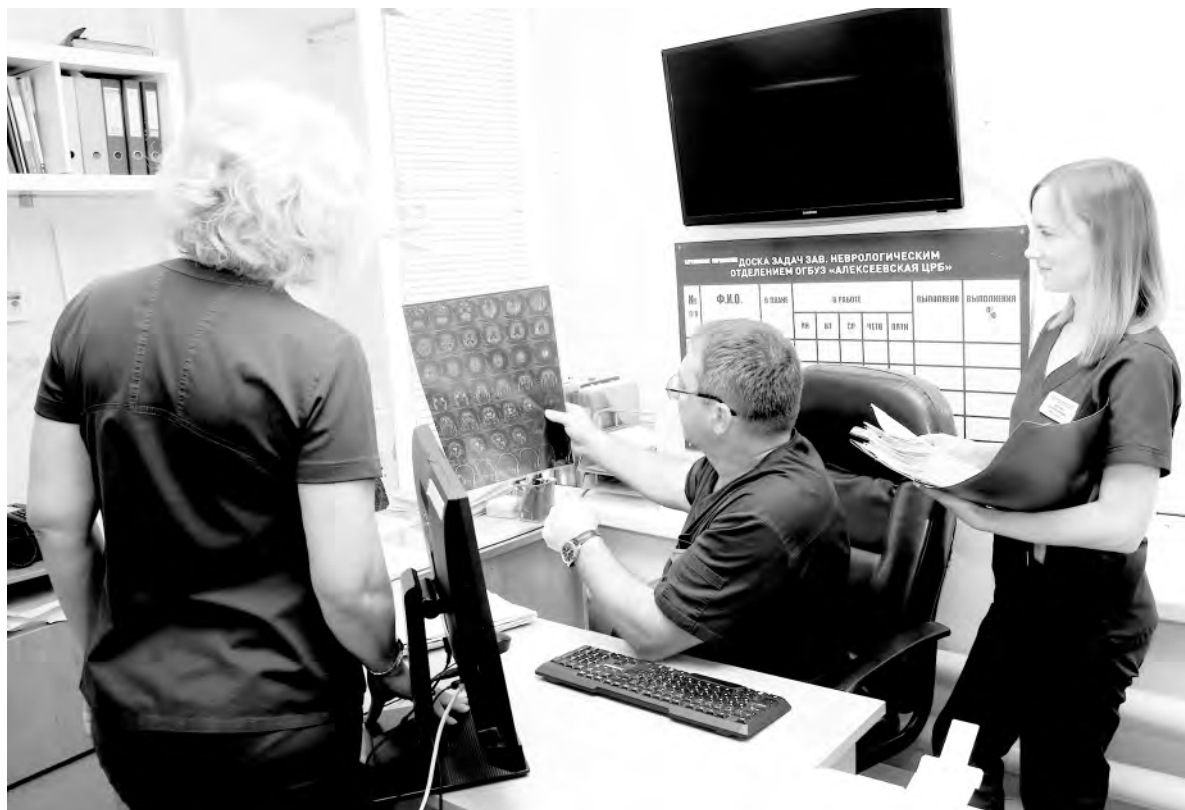
Важный этап в работе докторов-неврологов — обсуждение тактики лечения пациента.