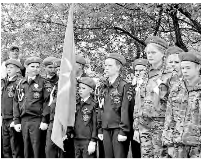
Учащиеся городских школ стали участниками мероприятий в честь Дня Победы.