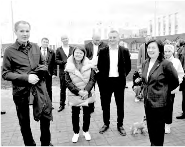
В марте текущего года Вячеслав Гладков посетил новый Центр культурного развития «Испульс» в Ильинке.