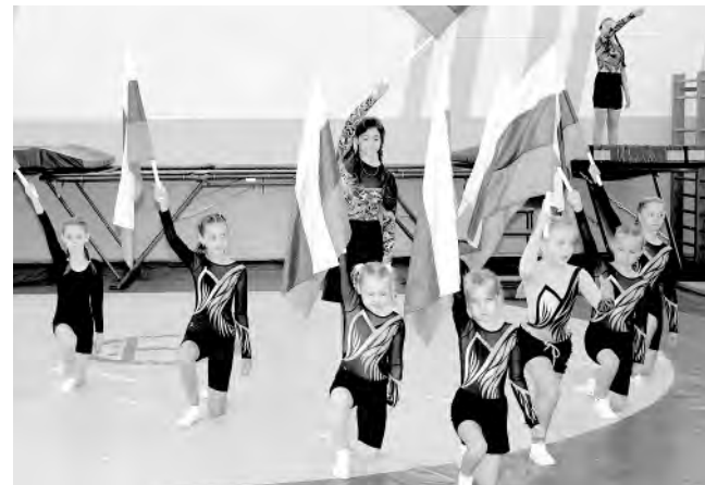
Красненские гимнасты — победители различных соревнований.