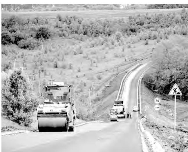
Хорошие дороги давно стали нормой для жителей муниципалитетов.