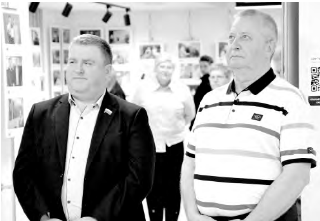
Состоялась экспозиция фоторабот фотожурналиста Александра Панченко «История в лицах».