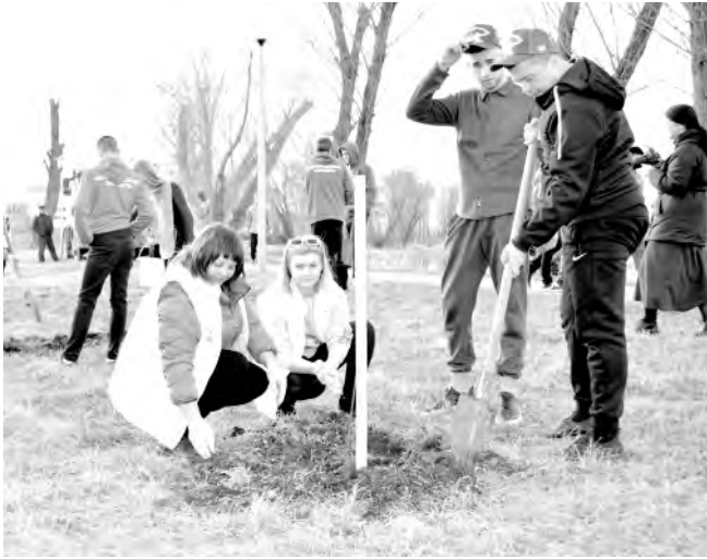
На территории округа прошла международная акция «Сад памяти», приуроченная к 80-летию Великой Победы.