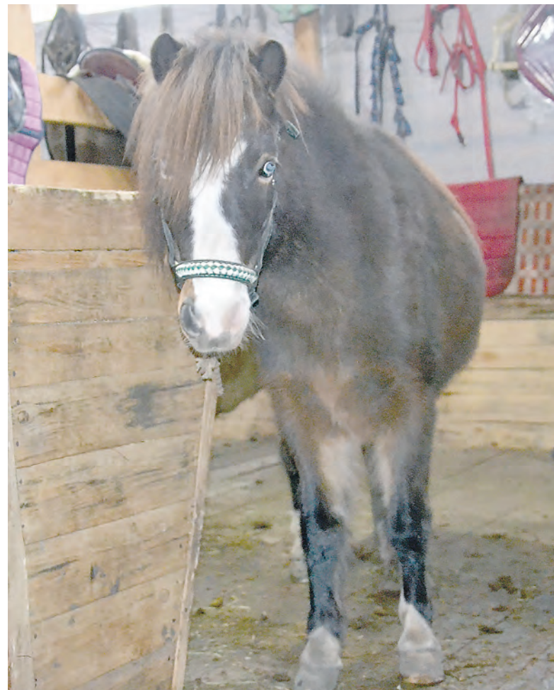
Пони Лулу ждёт в гости маленьких деток.