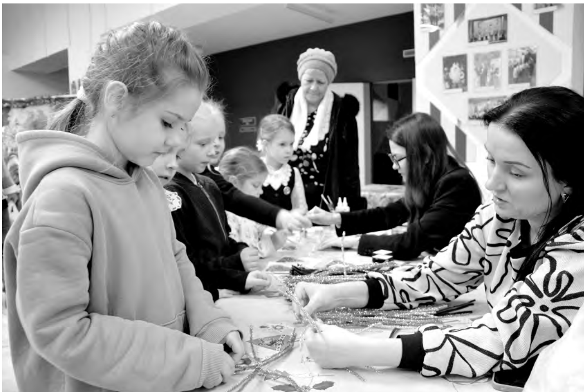
Увлекательные мастер-классы по изготовлению снежинок очень популярны среди маленьких посетителей резиденции Деда Мороза.

кой проведения ежегодной Всероссийской акции «Ёлка желаний». Исполнить заветные мечты юных алексеевцев представилась возможность первым лицам муниципалитета, депутатам Совета депутатов, руководителям предприятий и организаций, а также индивидуальным предпринимателям округа. 99 шариков с желаниями детей, оставшихся без попечения родителей, сирот, тяжелобольных, а также детей по-