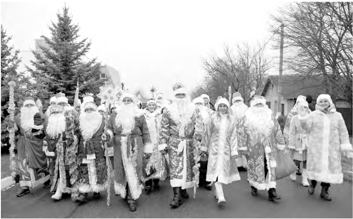
Парад сказочных персонажей стал зрелищным открытием новогодних праздников.