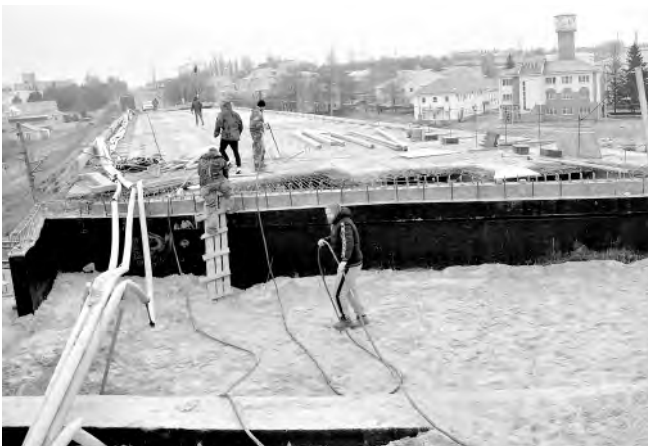
В течение года продолжались работы по капитальному ремонту путепровода по улице Революционной.