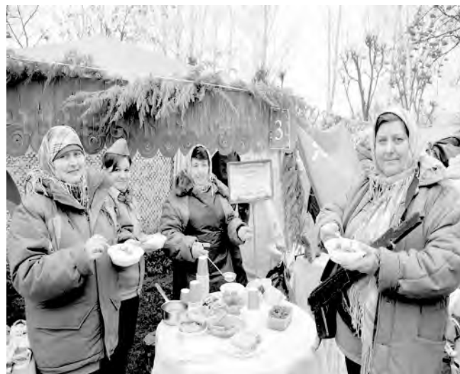
В Красном появился новый фестиваль солдатской каши.