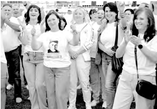
В августе в Алексеевке прошёл четвёртый летний парад физкультурников.