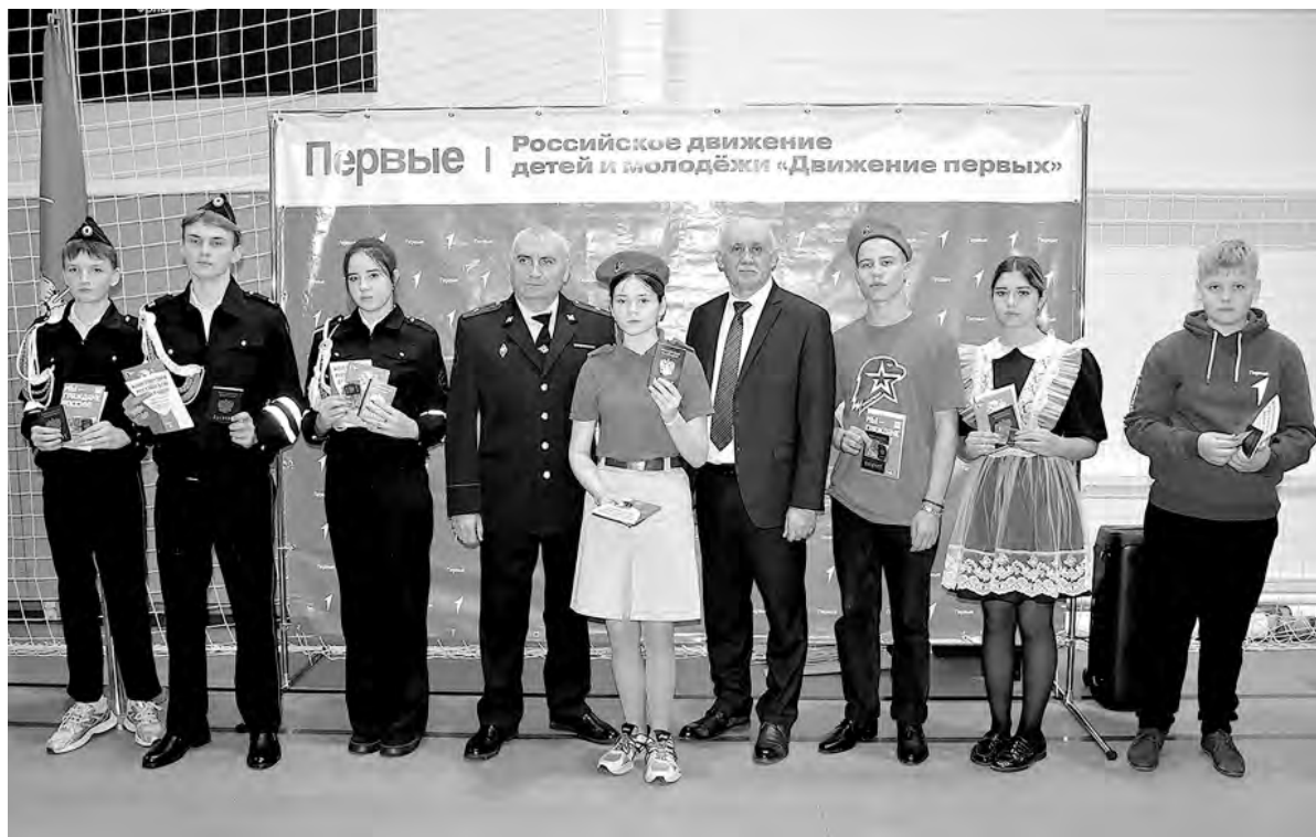
Подростки, получившие паспорта, попросили сфотографировать их на память.

В этот важный момент им аплодировали курсанты Центра военно-спортивной подготовки и патриотического воспитания молодёжи «Воин» Горской и Сетищенской школ. Ребят чествовали следующими. В течение нескольких месяцев они осваивали инженерную и огневую подготовку, навыки управления БПЛА, тактическую медицину, а затем успешно сдали экзамены. Со словами поздравления сертификаты об обучении по дополнительной программе «Время Героев» им вручил заместитель командира войсковой части по