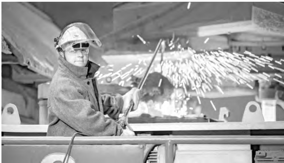
Благодаря горно-металлургическим компаниям область остаётся ключевым промышленным центром России.