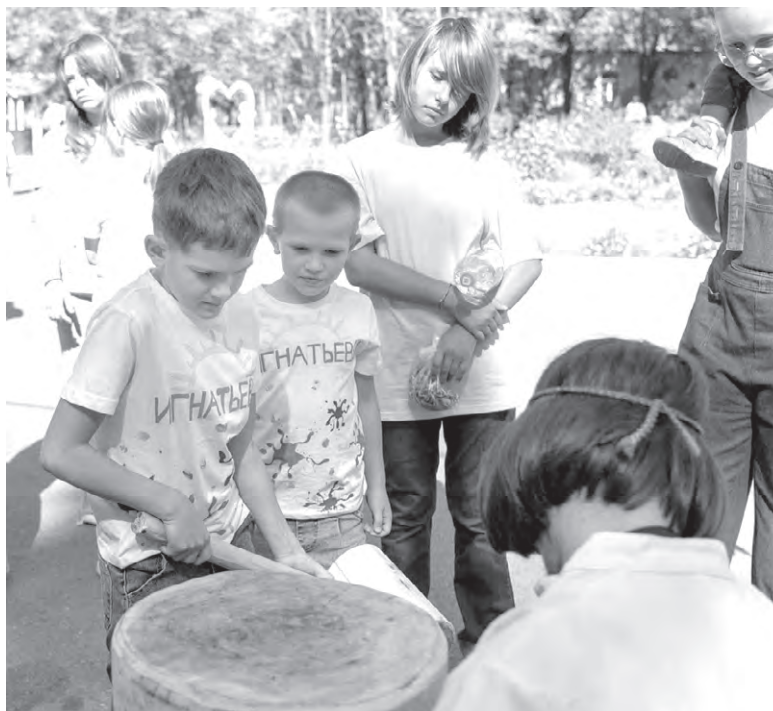
Юные участники праздника попробовали себя в роли знаменитого маслodela Даниила Бокарева.