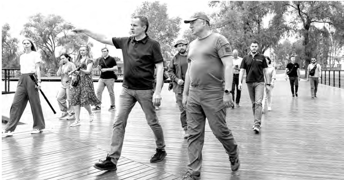
Мирная повестка занимает лидирующие позиции — большая работа ведётся по благоустройству.

За три года Гладкову удалось сформировать уникальный для России пакет жилищных программ для тех, кто самостоятельно жильём обзавестись не может. Белгородская область стала единственным в России регионом,