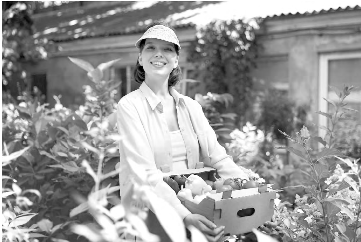
Многим жителям региона помогает программа социального контракта.

Инвестиционно привлекательной Белгородская область остаётся благодаря мощной поддержке бизнеса: с 2021 года на эти цели направлено более 9 миллиардов рублей. Только объём помощи малому и среднему бизнесу составил 3,7 миллиарда рублей. По количеству субъектов предпринимательства, включённых в реестр, Белгородская об-