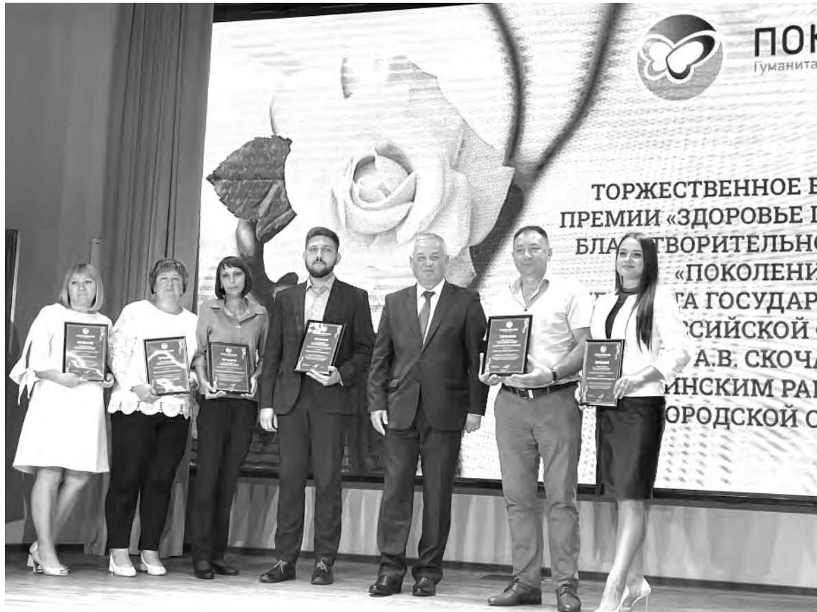
Алексеевские медики во время церемонии награждения.

За время работы фонда поддержку получили около 50 000 физических лиц, более 40% из них — дети. Приобретено и передано в дар более 570 единиц медицинского оборудования на сумму около 420 с половиной млн. руб. За 23 года приобретено 174 единицы медицинского транспорта (скорой помощи, транспорт для перевозки больных на гемодиализ и инвалидов).