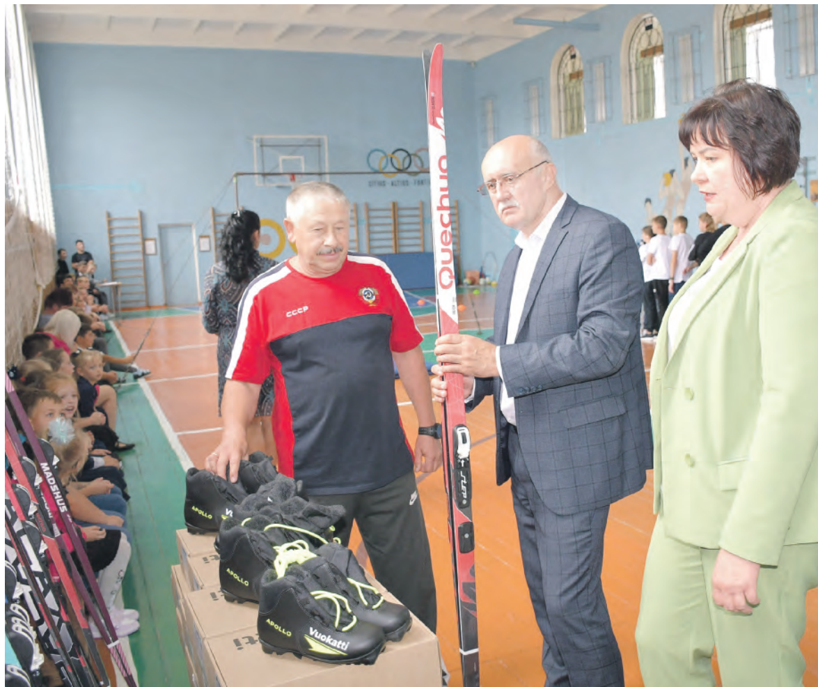
Вручение лыжных комплектов стало приятным сюрпризом для учащихся и коллектива школы.