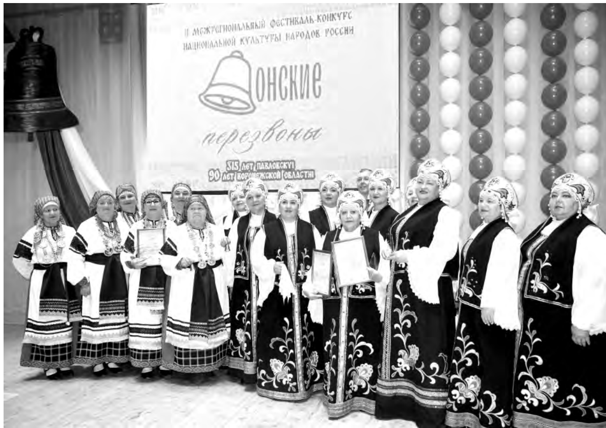
Ансамбли «Раданица» (слева) и «Красняночка» после концерта.