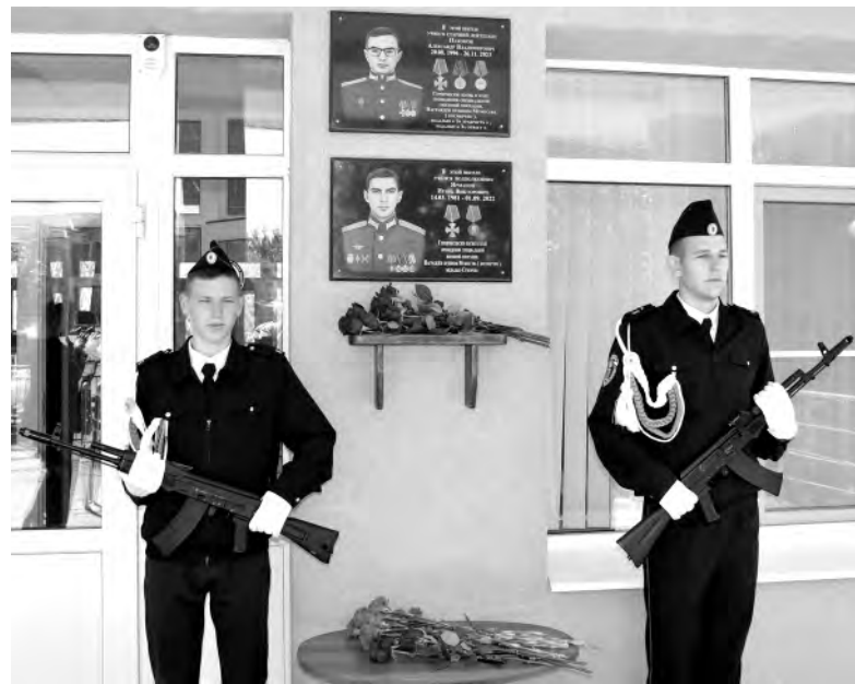
Герои, чьи имена и портреты выгравированы на табличках, отдали жизнь за свою страну и будущее каждого из нас.