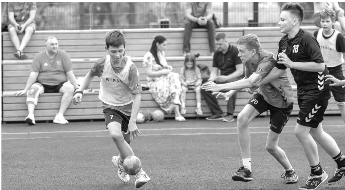
Губернатор уверен, что война не должна отменять мечты детей.