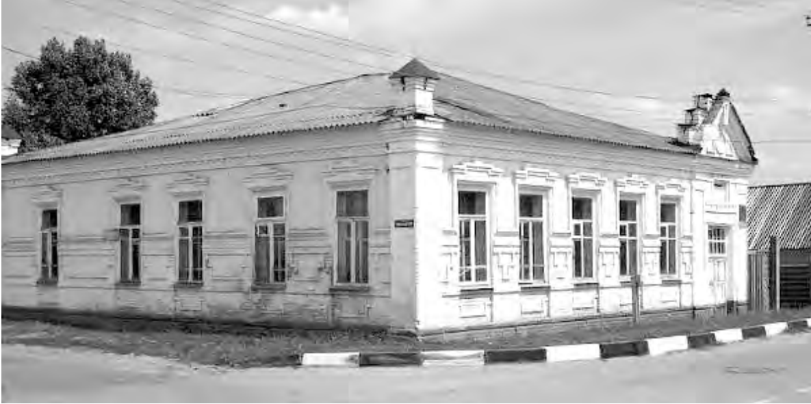
Здание стоматологической поликлиники на пересечении улиц Чернышевского и Красноармейской. 80-е годы.