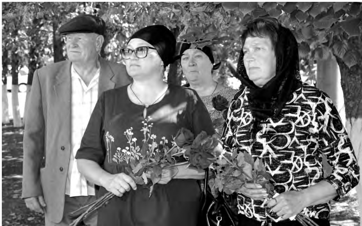
Родным погибших бойцов тяжело заглушить боль потери, но они находят силы, чтобы рассказать всем о подвиге сыновей.

В ноябре прошлого года, возвращаясь с линии боевого соприкосновения у населённого