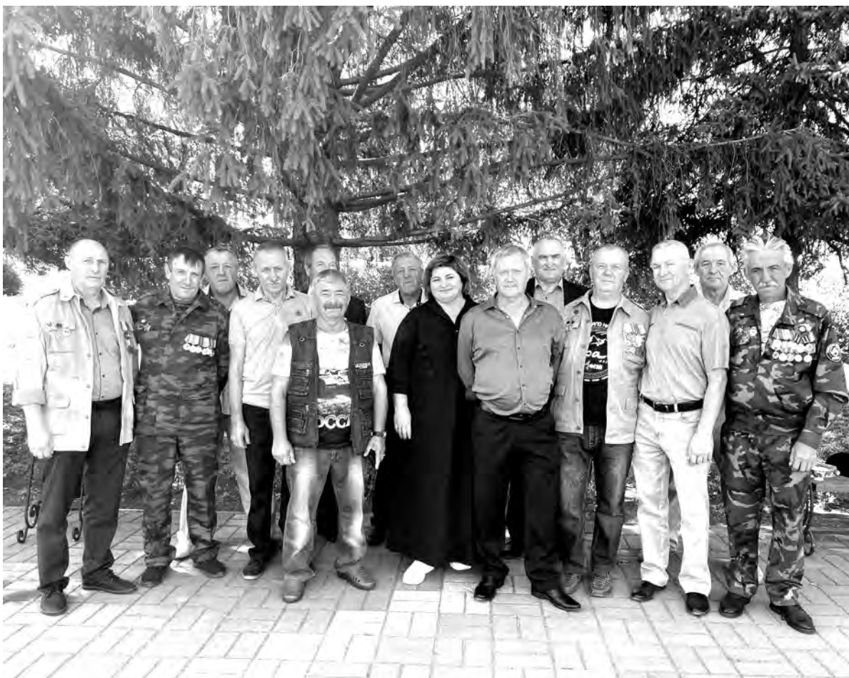
Боевые товарищи вспомнили, как измеряли свою молодость рулеткой афганских дорог.

Ольга ШОРСТОВА. с. Новоуколово.