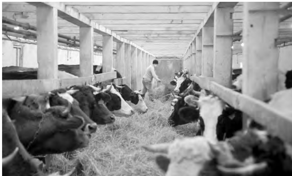
В регионе успешно развивается отрасль животноводства.