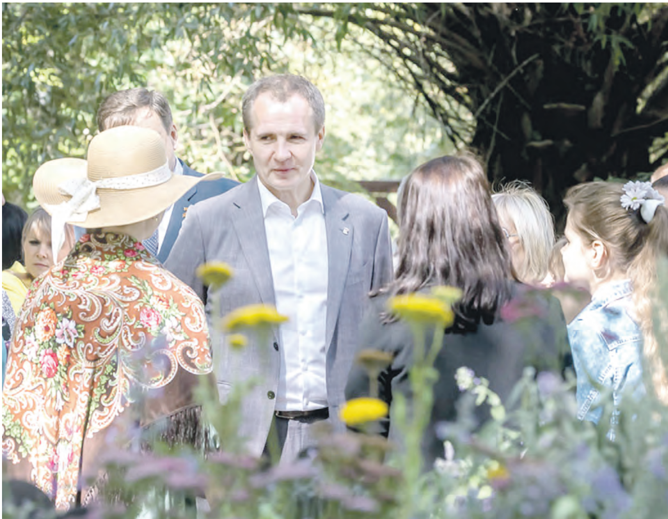
Губернатор Вячеслав Гладков всегда ведёт открытый диалог с населением.