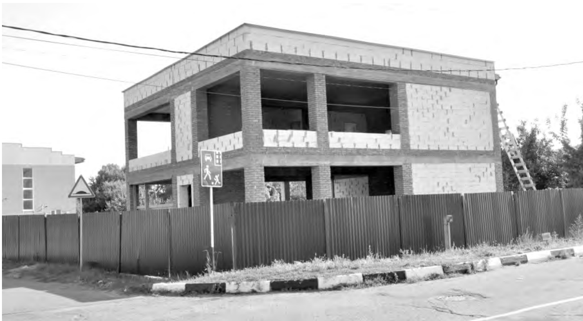
Это же место сейчас.