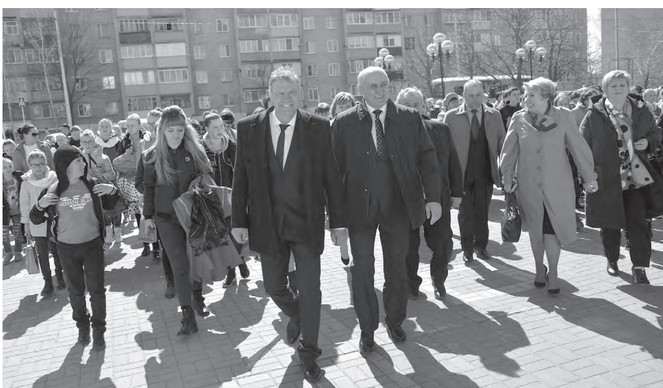
Тёплая встреча на волоконовской земле.