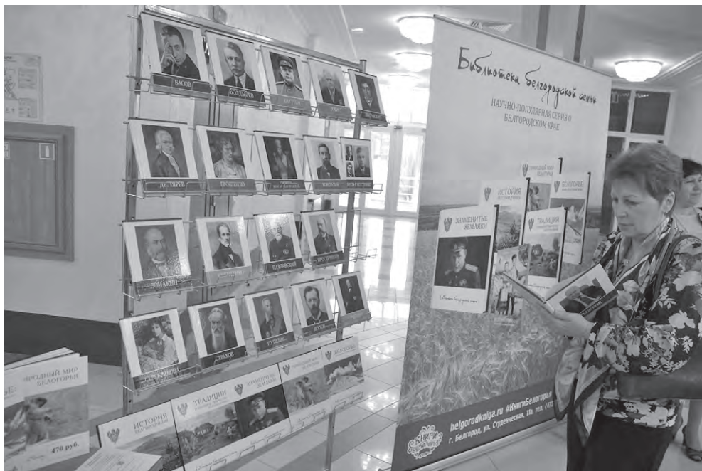
Выставка книг-новинок перед презентацией в филармонии.

В этих изданиях представлены биографии тех уроженцев и жителей Белгородчины, чья известность выходит за пределы малой родины, которые прославили наше Отечество в государственном управлении и военном деле, просвещении и религии, науке и технике, литературе и искусстве. Книжная серия предназначена для семейного чтения, жителей области и туристов. В подготовке книг принимали участие краеведы, авторские коллективы архивов, учреждений культуры и образования области, использовались уникальные архивные материалы, авторские фотогра-