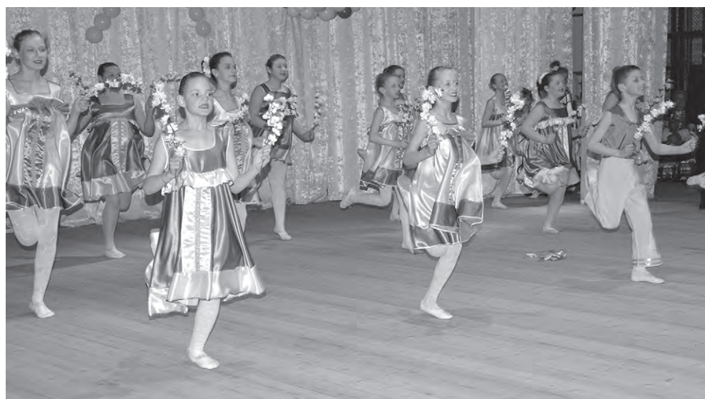
Танцуют воспитанники хореографического отделения Красненской детской школы искусств.