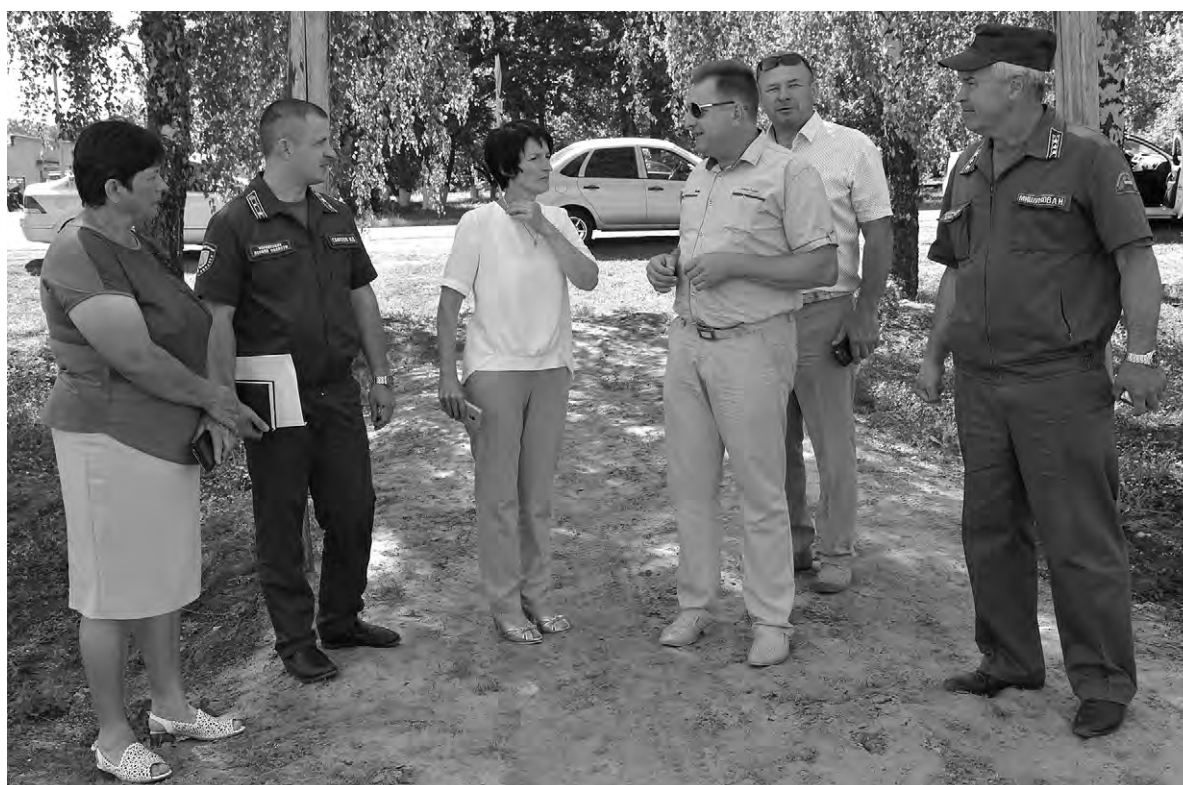
Участники первого маршрута посетили парк еловых насаждений в райцентре и обсудили рабочие моменты.

После доклада своё мнение высказали гости, которые участвовали в инспектировании муниципалитета. Многие проверяющие говорили о чистоте и