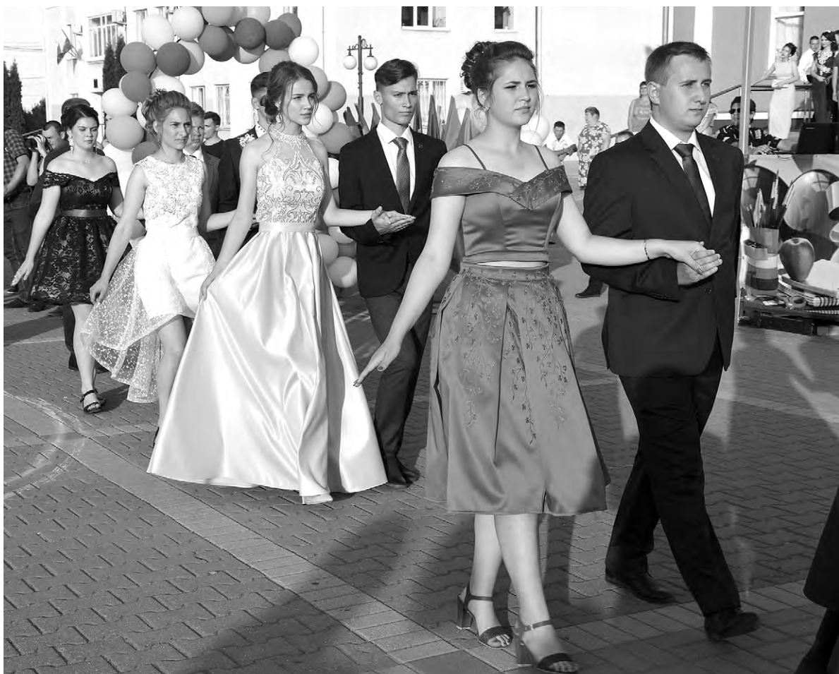
В Красном прощальный бал начался с торжественного выхода выпускников на площадь.