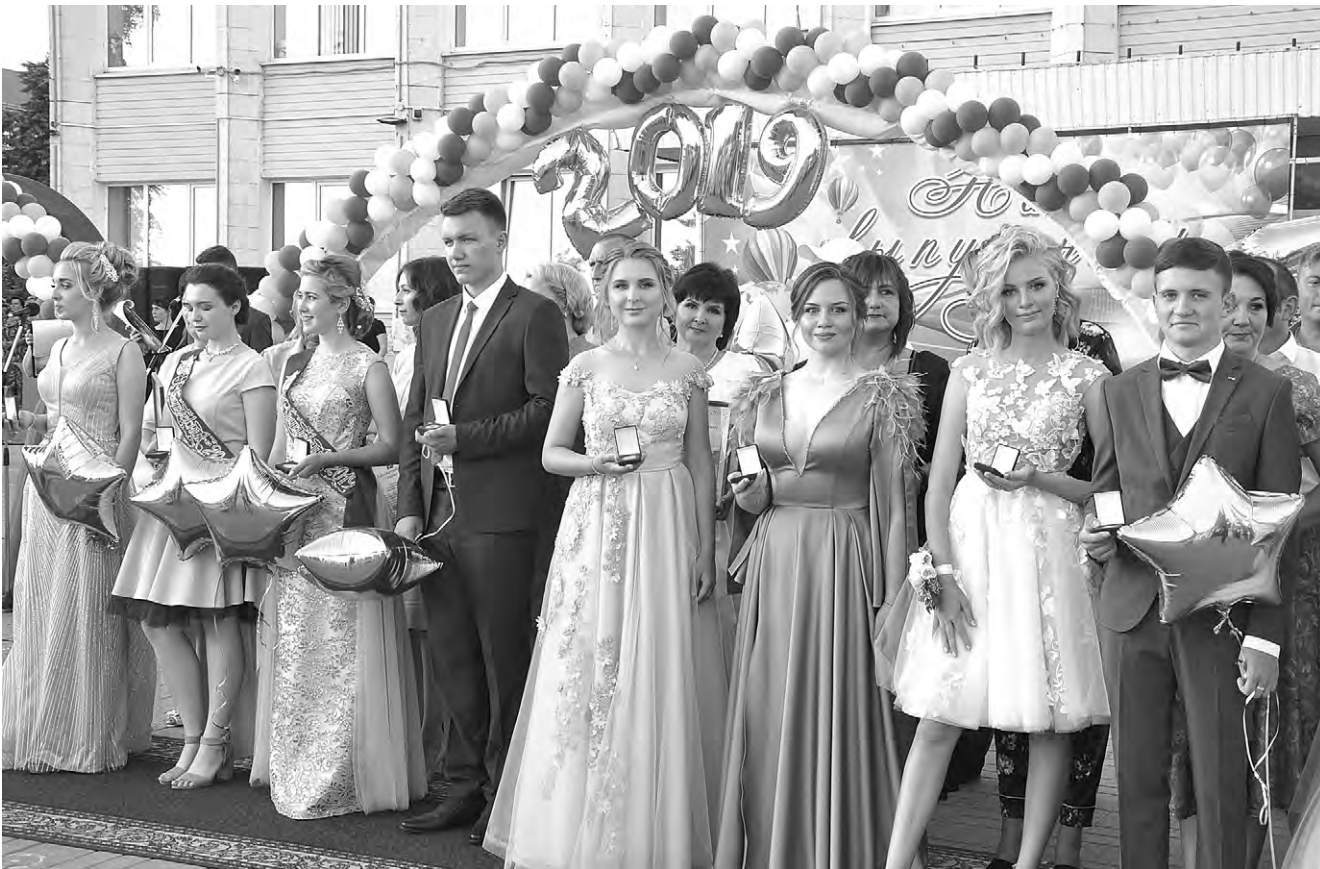
Гордость Алексеевского городского округа — медалисты. В этом году их было 32 человека.