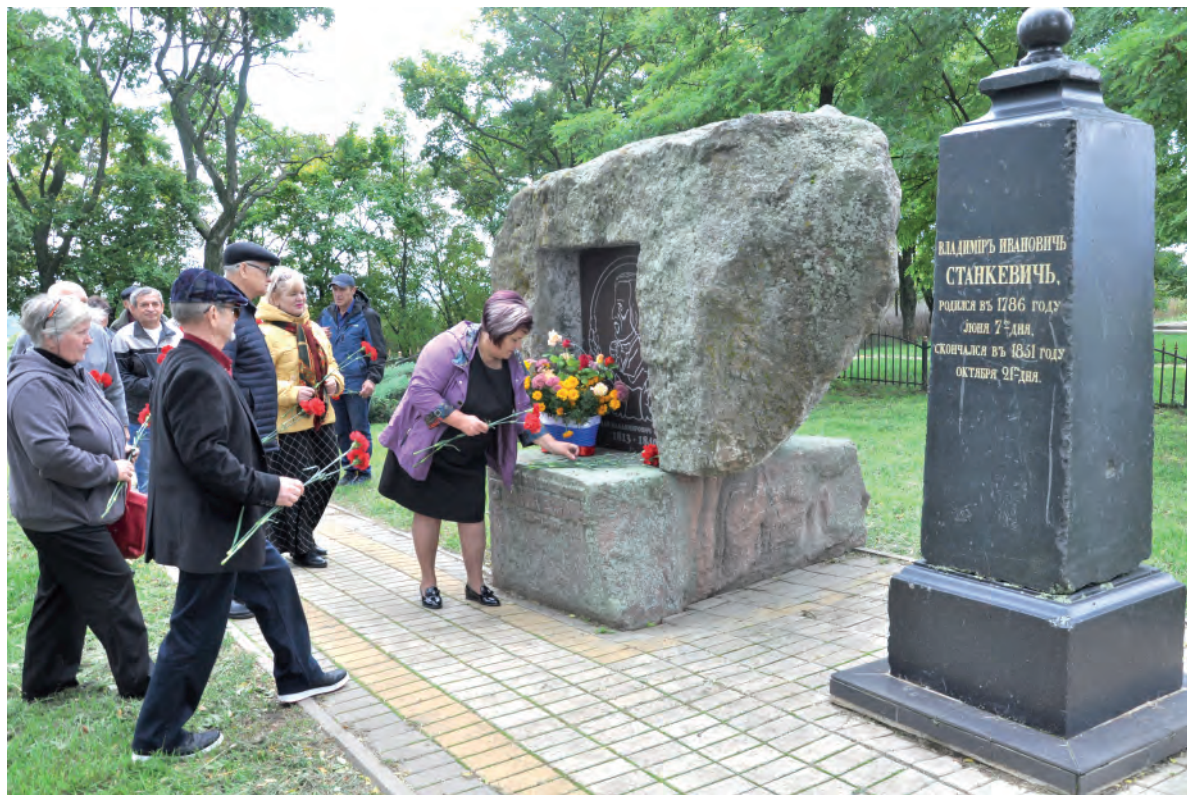
Участники фестиваля по традиции возлагают цветы к захоронению Николая Станкевича.