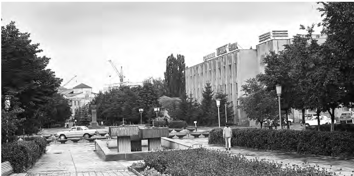
Улица Гагарина в 1980-е годы.