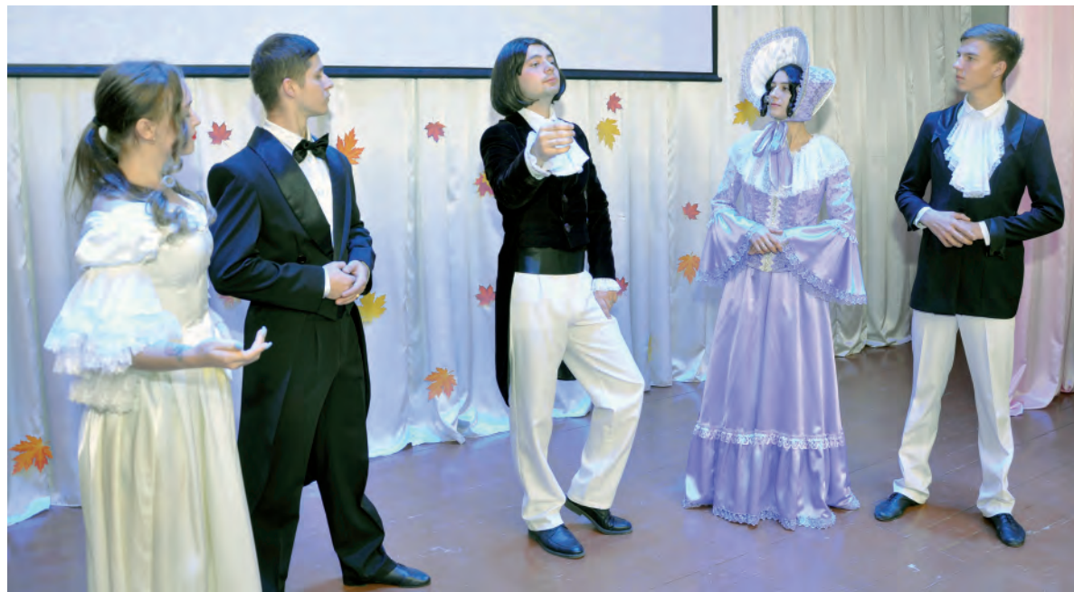
Николай Станкевич в кругу друзей — так представили эту сцену алексеевские артисты.

Заря Учредители: министерство общественных коммуникаций Белгородской области; администрация Алексеевского городского округа, администрация Красненского района Белгородской области, Совет депутатов Алексеевского городского округа Белгородской области, муниципальной совет муниципального района «Красненский район», АНО «Редакция газеты «Заря».