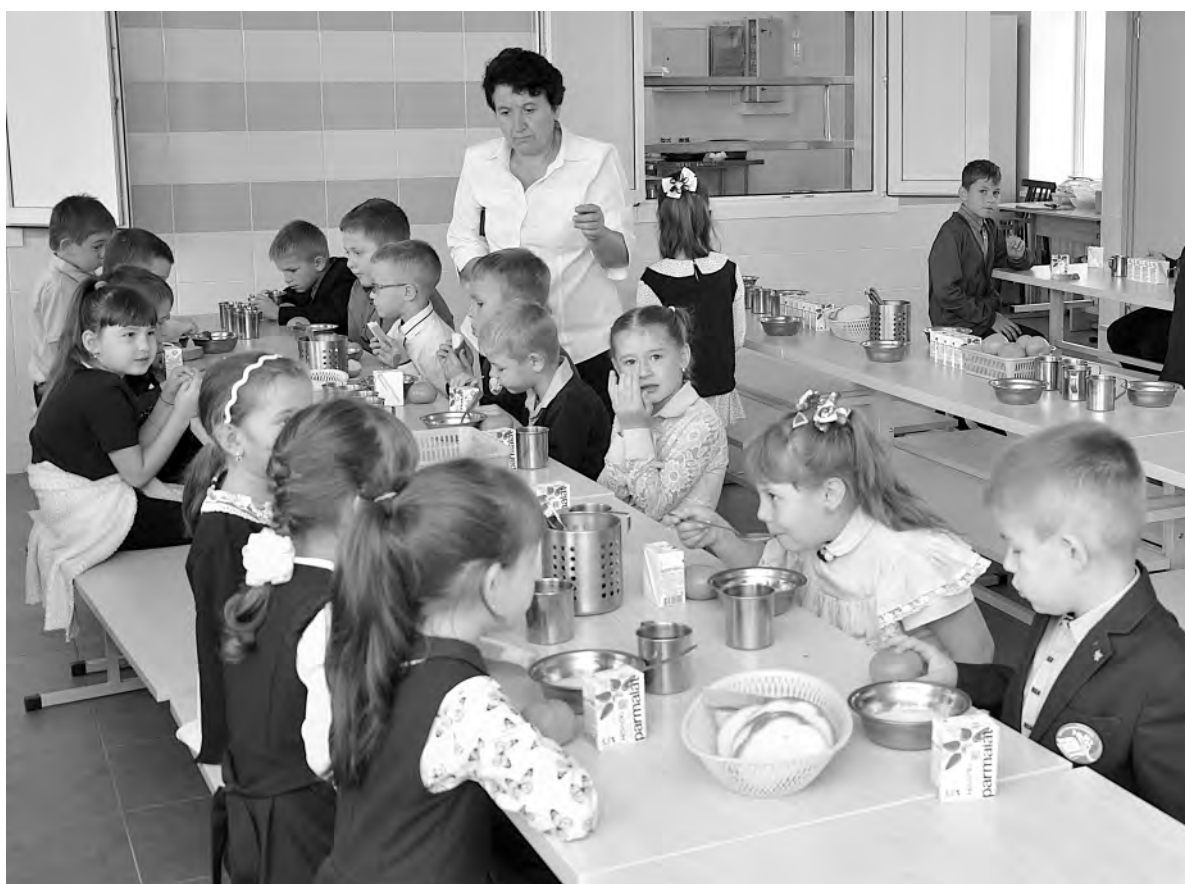
Малыши завтракают в обновлённой столовой.