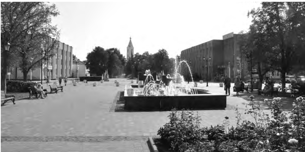
Это же место сейчас.