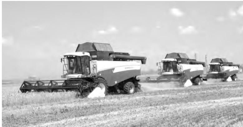
Жатки комбайнов быстро «съедали» посеянные озимой пшеницы.