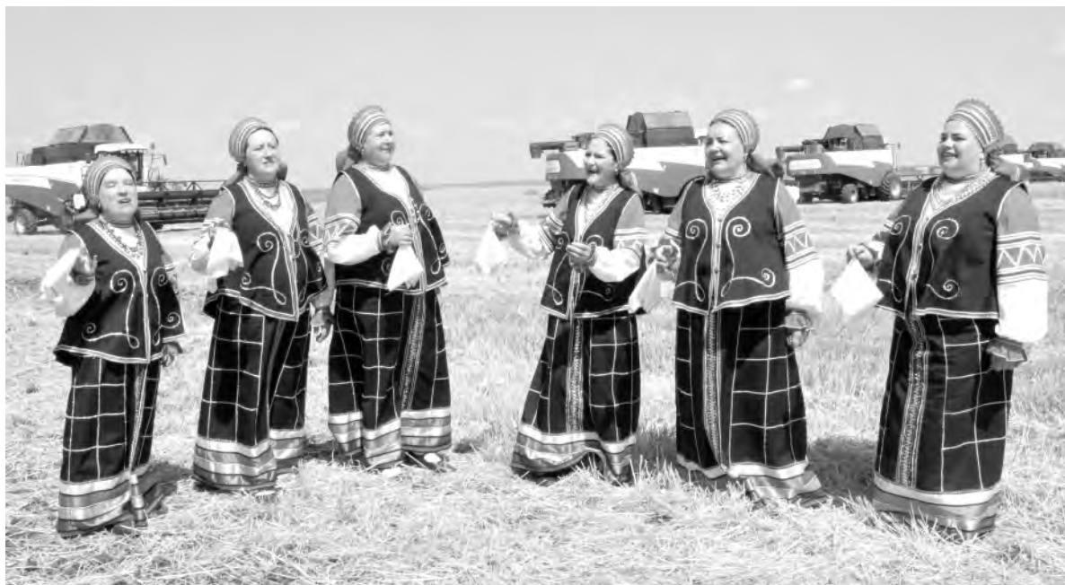
Перед участниками жатвы выступил Большой ансамбль «Сударушка».