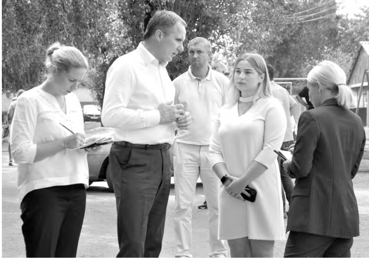
Губернатор Вячеслав Гладков общается с алексеевцами во время одного из прошлогодних визитов в муниципалитет.

Кроме того, интенсивное жилищное строительство и различные виды финансовой помощи позволили обеспечить жильём