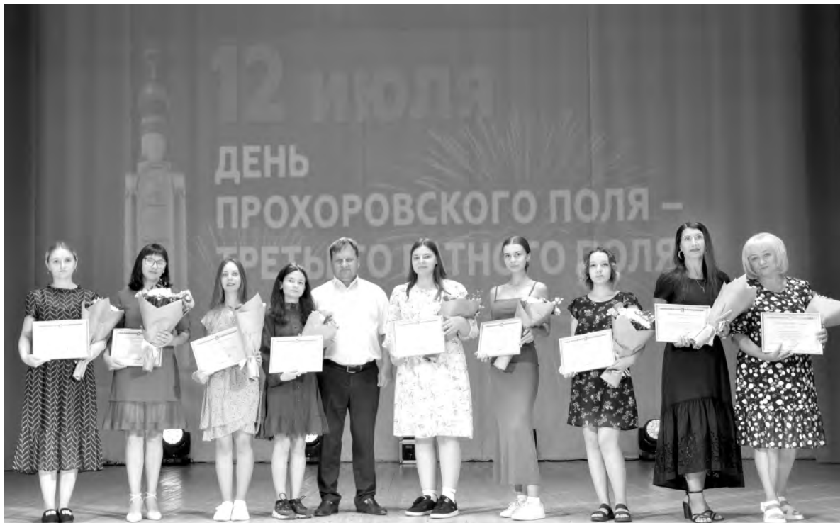
Активисты муниципалитета получили из рук первого заместителя главы администрации горокруга Алексея Горбатенко заслуженные награды.

Память земляков, чьи имена навсегда остались в истории нашей страны, присутствовавшие почтили минутой молчания.