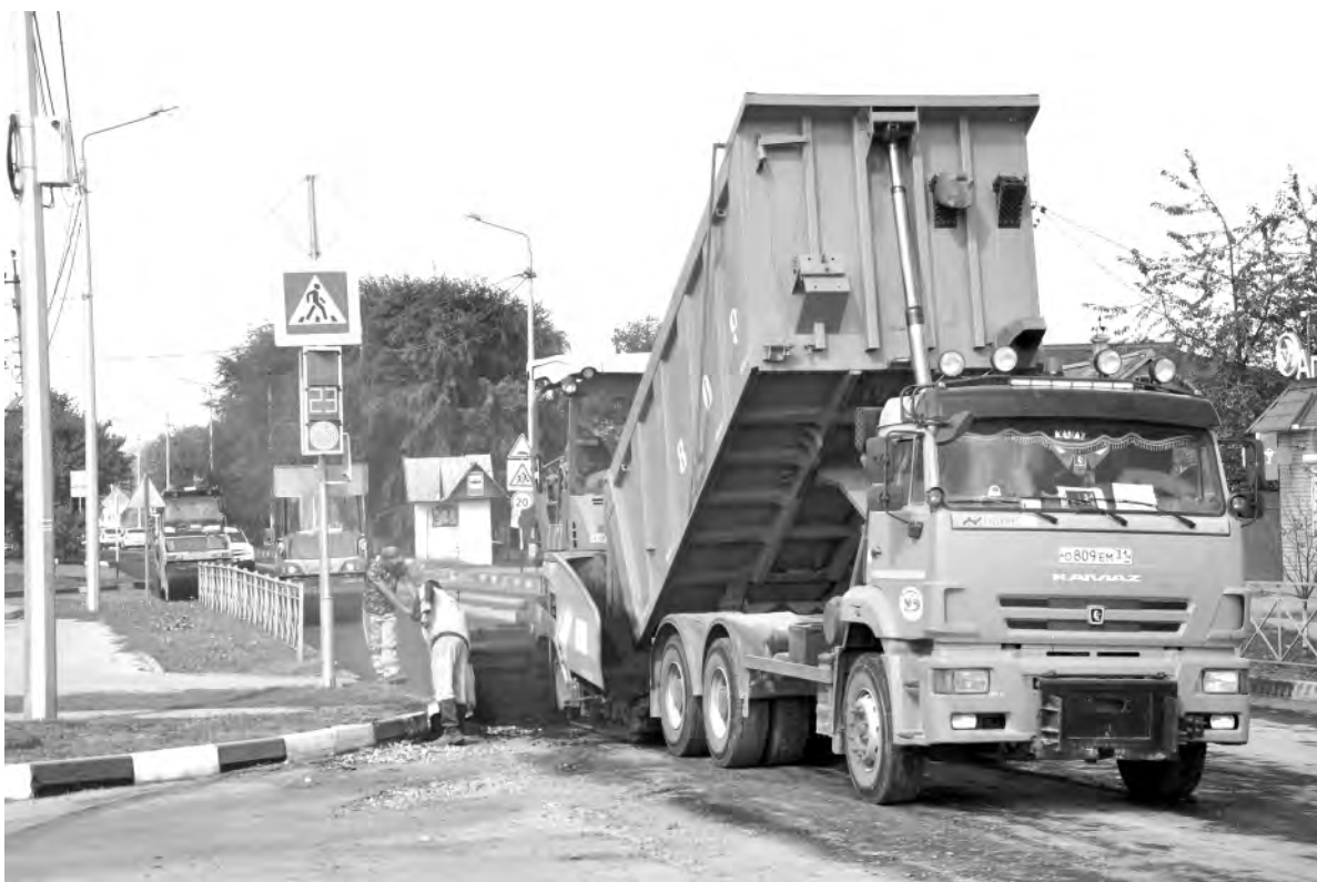
Качественные дороги — визитная карточка региона и муниципалитетов.