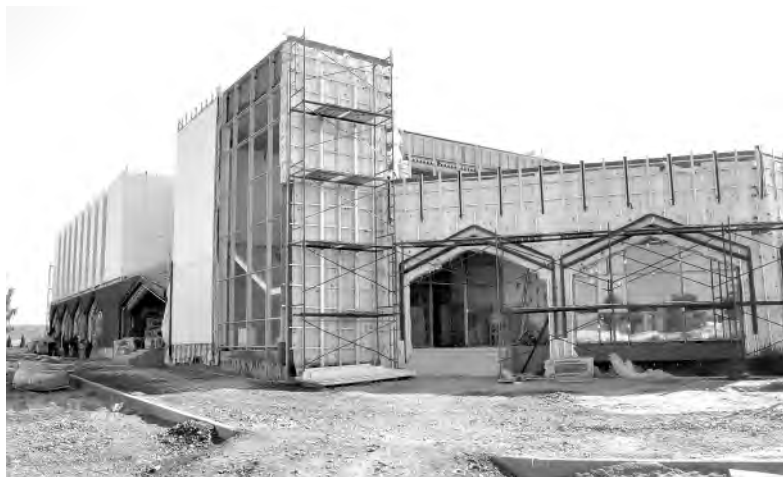
В области много внимания уделяется социальному строительству. В частности, в селе Ильинка возводятся Центр культурного развития и детский сад.