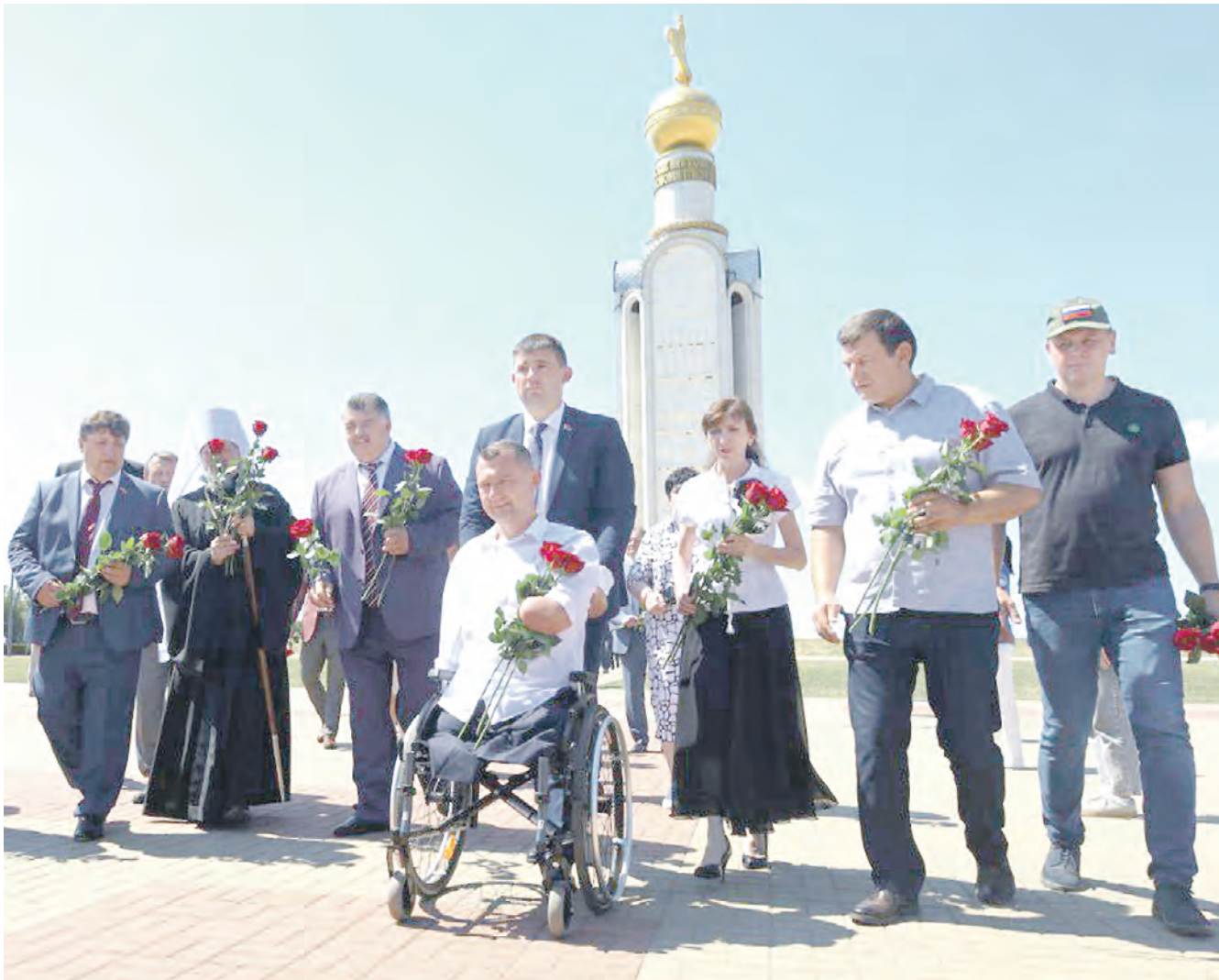
Почётная делегация на церемонии возложения в Прохоровке.