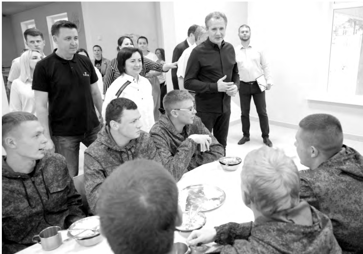
Вычеслав Гладков общается с курсантами «Арматы» в Алексеевке.

В прошлом году в Алексеевском горокруге начаты капитальный ремонт школы № 4 (закончен в нынешнем), строительство детского сада в Ильинке. Реализуется целый ряд мероприятий, связанных с реализацией нацпроекта «Образование». Результатом качественной образовательной политики является успешная итоговая аттестация выпускни-