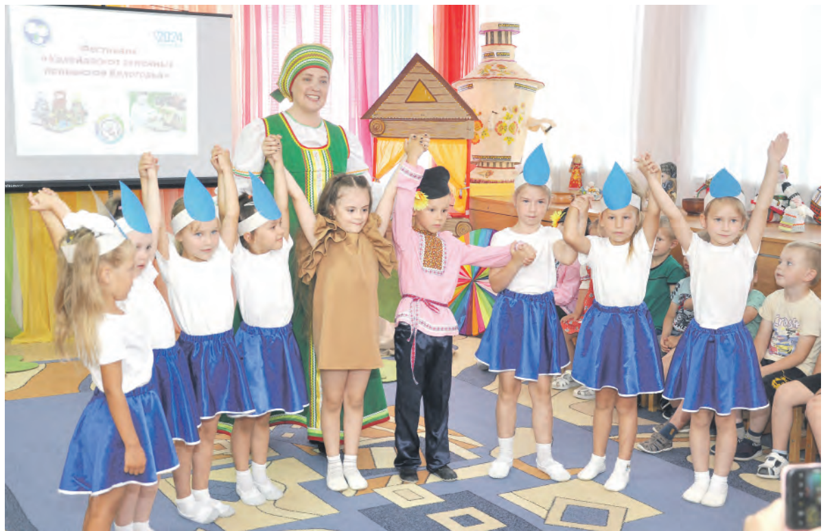
Сказка удалась на славу!