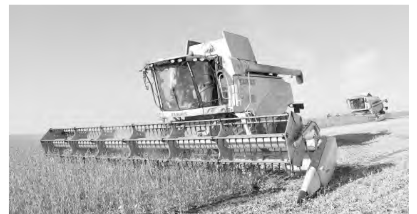
АПК региона и муниципалитетов работает на «отлично».