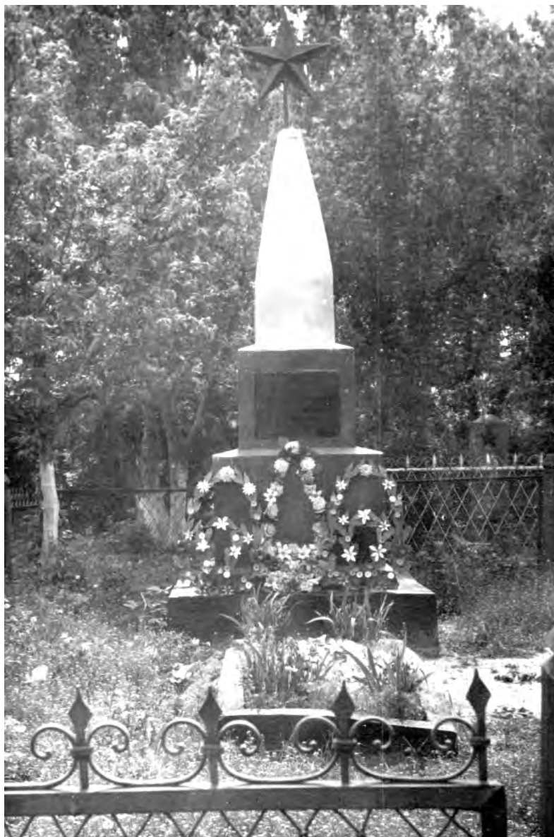
Обелиск на месте захоронения бойцов продотряда на нынешней Никольской площади. 1970 год.

Собранный материал Овчаренко поместил на целой странице «Зари» 7 ноября 1970 года. Затем статью опубликовали в «Белгородской правде» 20 января 1971 года. Позже на основе газетных фактов корреспонденту подготовил журналист столичных «Известий». Имена погибших членов продотряда Овчаренко предлагал выбить на обелиске. Сегодня на мемориале нет не только имён погибших, но и самого обелиска. После реконструкции 1985 года памятное место неузнаваемо изменено.