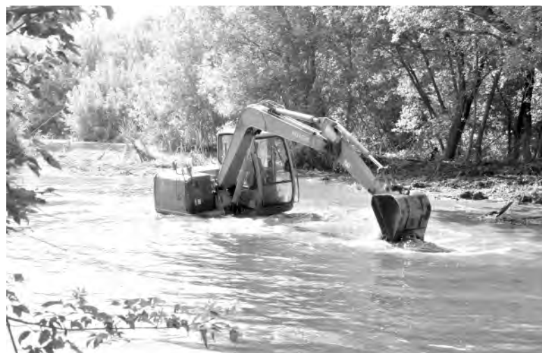
Очистка реки Тихая Сосна в рамках губернаторского проекта.