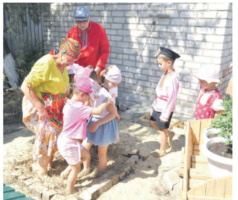
Замешивать саман — увлекательное и весёлое занятие.

Заря Учредители: министерство общественных коммуникаций Белгородской области; администрация Алексеевского городского округа, администрация Красненского района Белгородской области, Совет депутатов Алексеевского городского округа Белгородской области, муниципальной совет муниципального района «Красненский район», АНО «Редакция газеты «Заря».