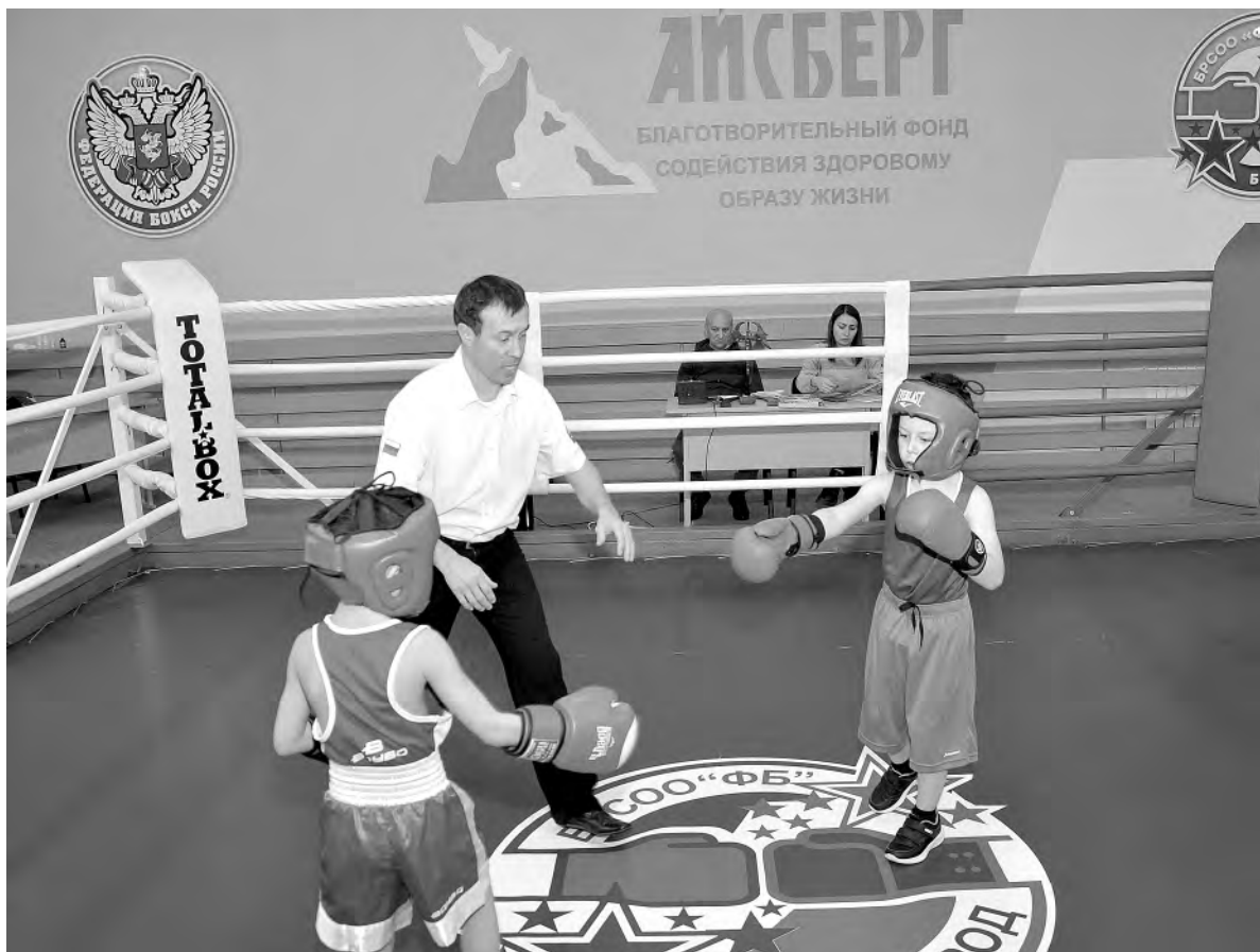
Занятия юных боксёров в зале «Айсберг», который появился в Алексеевке в прошлом году.