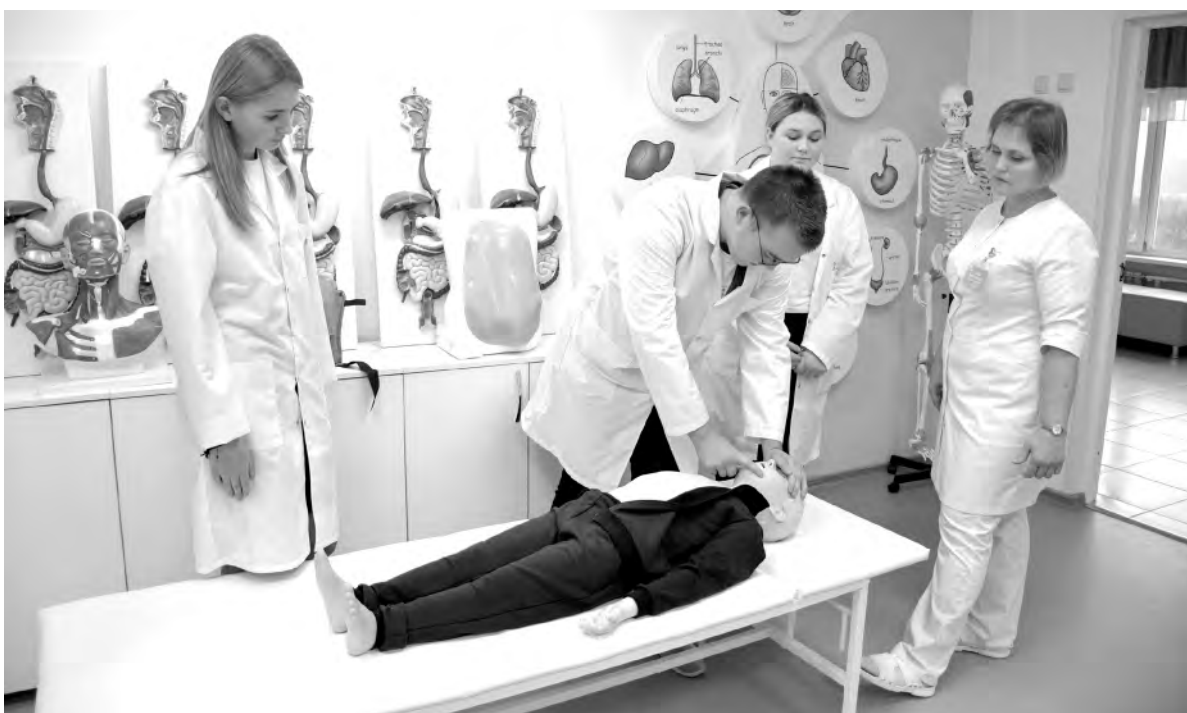
Создание медицинских классов, в том числе на Алексеевской и Красненской территориях, — инициатива губернатора.