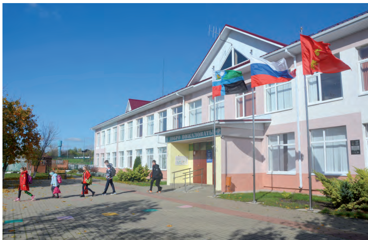
Фасад Готовской школы имеет современный облик.