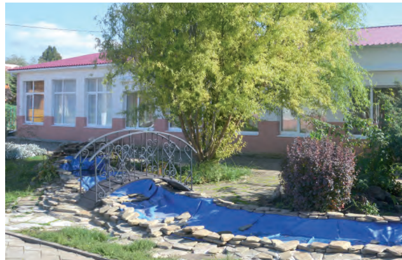
Благодаря качественному уходу растения у искусственного водоёма растут не хуже, чем у настоящего.