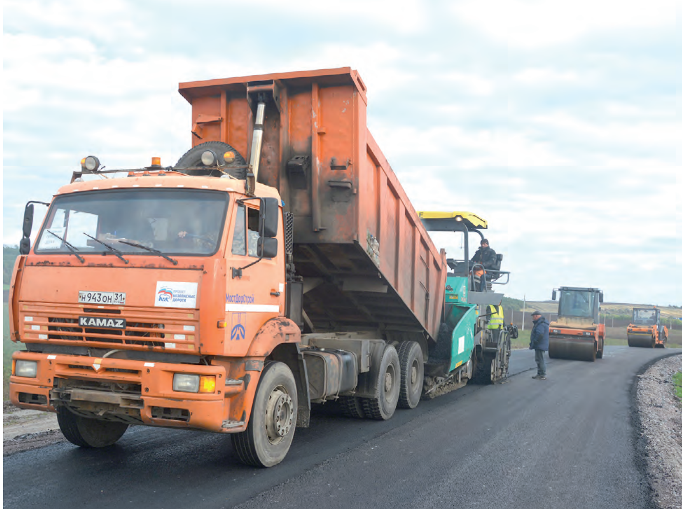
Завершающий этап работы на автодороге Камышенка-Готовье-Вербное.