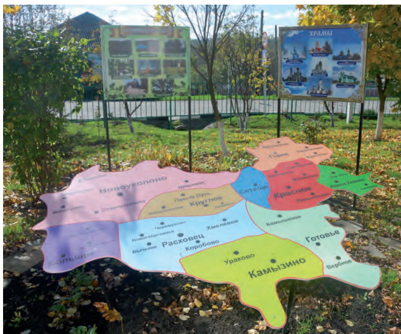
Интерактивная зона «Родные просторы».