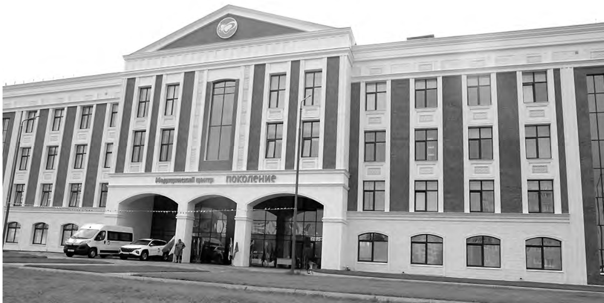
Общая площадь Центра малоинвазивной хирургии шесть тыс. кв. метров.