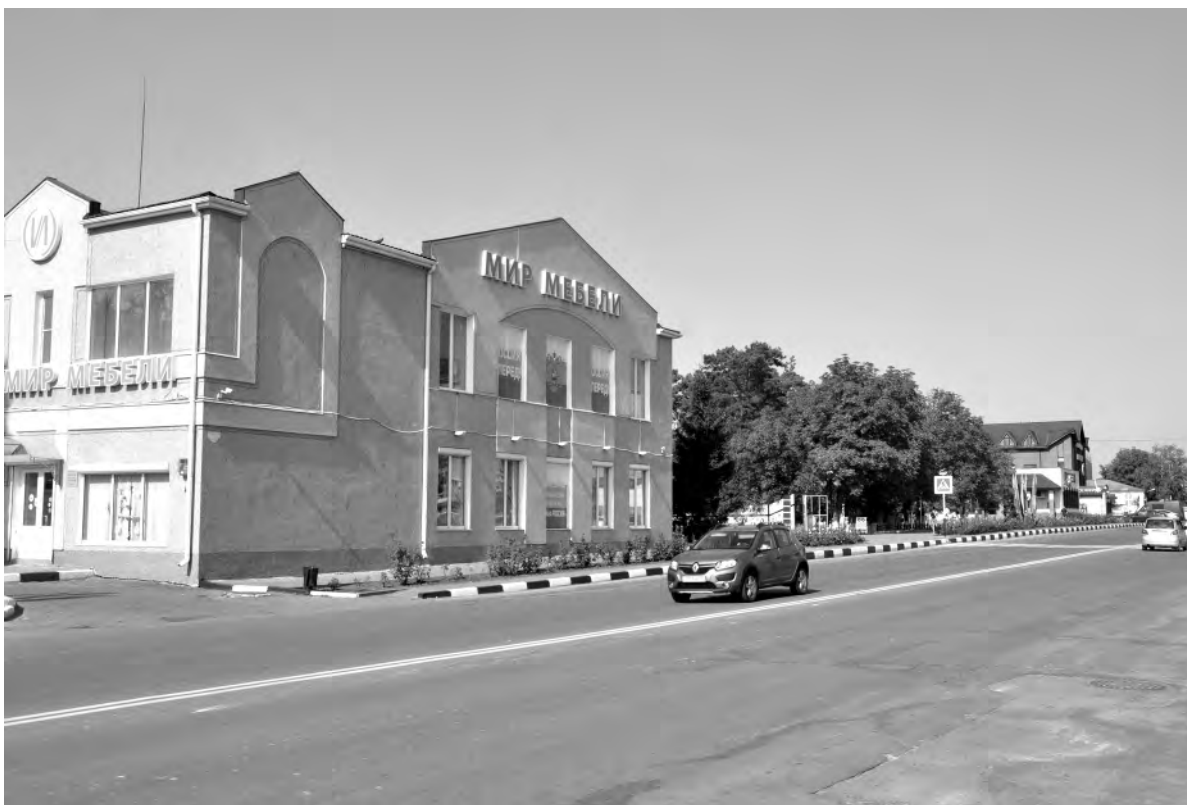
Это же место сейчас.