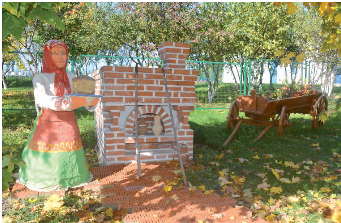
Этнографический уголок демонстрирует уклад сельской жизни наших предков.

Заря Учредители: министерство общественных коммуникаций Белгородской области; администрация Алексеевского городского округа, администрация Красненского района Белгородской области, Совет депутатов Алексеевского городского округа Белгородской области, муниципальный совет муниципального района «Красненский район», АНО «Редакция газеты «Заря».