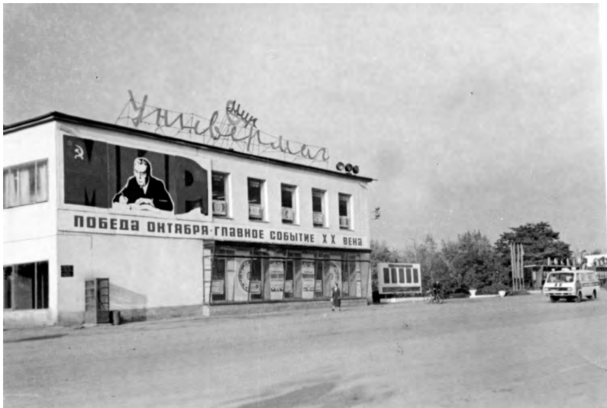
Улица Победы в 1980-е годы.