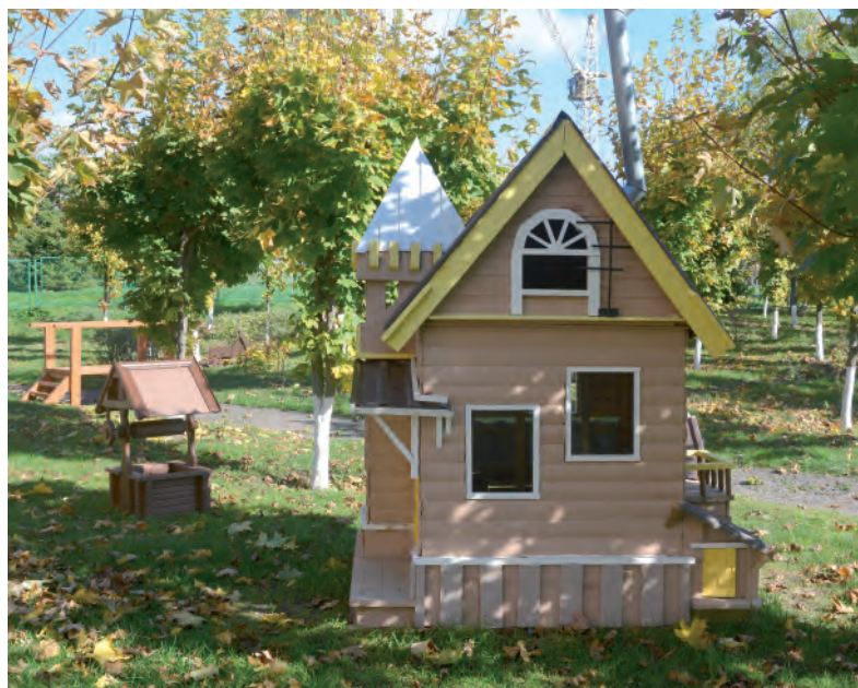
Теремок на «Поляне сказок».